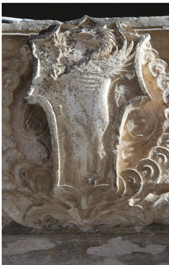
13. Korčula, ulica Žitnica, (palača Dragojević?), propeti grifon na grbu obitelji Mihetić-Dragojević, N. Firentinac (zadnja četvrt 15. stoljeća) Korčula, Ulica Žitnica, (Dragojević Palace?), griffin rampant on the coat of arms of the Mihetić-Dragojević family, Nicholas of Florence (last quarter of the 15 th century)

Na desetostranom je štitu, koji zauzima sredinu nadvratne grede, isklesan u plitkom reljefu obiteljski grb tipa „konjska glava“ s prikazom propinjućeg grifona (orolav) koji stoji na jednoj nozi, okrenut na (heraldičku) desnu stranu. Višesložno mitsko biće je formirano od dvije polovice. Donji dio tijela lava, sa stražnjim šapama, uspravljenim repom i izraženim rebrima, spojen je s glavom i krilima orla iz čijeg otvorenog kljuna plazi valoviti jezik, dok perje obavija njegov vrat. Prednje lavlje šape pretvorene su u orlove kandže, a desna pridržava sasvim malu, reljefnu krunu. Dvije plitke, uvijene vrpce ukrašavaju podlogu uz bočne stranice štita. 35 Iako su svi