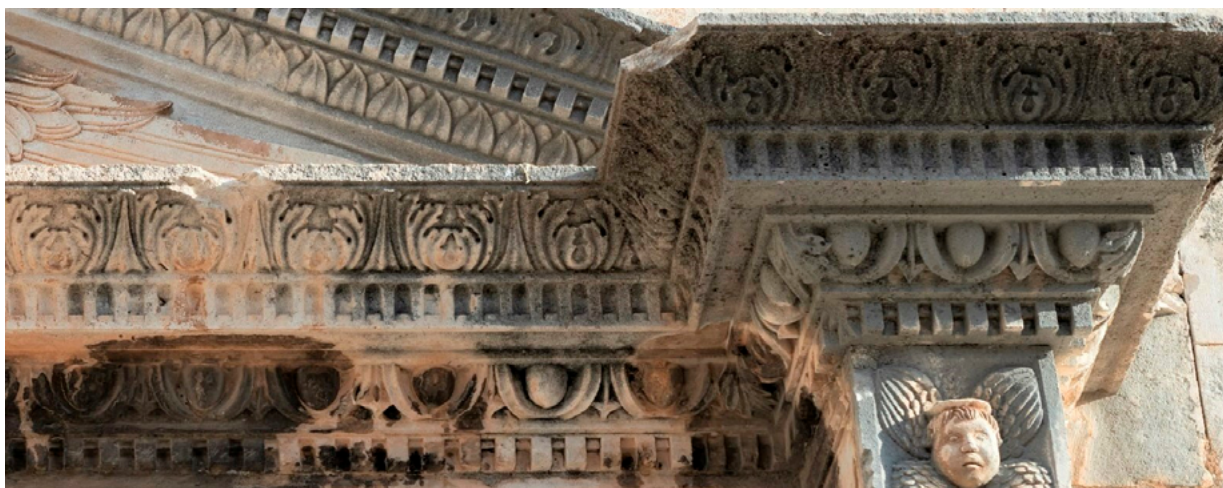
11. a - b Specifično oblikovanje ornamenta akantusa na vijencima, Petar Andrijić: a. Korčula, palača Gabriellis, b. Dubrovnik, crkva Sv. Spasa (1520.) Unique design of acanthus ornament on cornices, Petar Andrijić: a. Korčula, Gabriellis Palace, b. Dubrovnik, Church of St Saviour (1520)

u lapidariju Opatske riznice). 23 Međutim, ovaj niz nije upotrijebljen kao relevantni, klasični red ukrasa, nego je potisnut u pozadinski plan figuralnog sadržaja kapitela tako da se preko njega propinju razigrani repovi dupina pod abakom sjevernog kapitela, dok se na južnom za njega čvrsto drže četiri sirene (harpije) svojim kandžama. Uz to, majstor Marko ovaj ukras nije respektirao u pravilnim i jasnim proporcijama, već je izmjenama osnovnog ritma unio jednu vrstu živahnosti i nemira, kako je već navikao s animalnim i biljnim motivima, pa je na taj način svaki modul poprimio ponešto drugačiji oblik (sl. 10). 24 Prostor između ovula, koji je uobičajeno uzak s okomitim prutom oblika vrha strelice okrenute prema dolje, u svojoj maniri, on osjetno širi i preoblikuje. Tako se na nekoliko članaka ovog niza prednjih kapitela ciborija pojavljuju dva mala, savijena krilca vrha strelice koja se ne spajaju koso s plaštom ovula, kako je uobičajeno, već se nejednako povijaju u polukružne lukove na baznoj horizontali, dok gornji dio okomitog pruta poprima formu sličnu ribljem repu. Volumen i obris jajašca postali su srazmjerno mali u odnosu na masivnu konkavnu ljusku oplata, za razliku