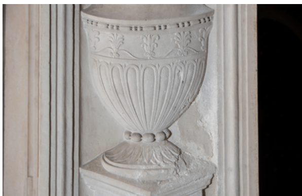
4. a - c Šibenik, katedrala sv. Jakova, primjeri ornamenta vretenaca s kamenom niti, Nikola Firentinac: a. vijenac iznad prozora tambura, b. lučni vijenac nad sjevernom apsidalnom kapelom, pogled s istoka, c. Trogir, kapela biskupa Ivana Ursinija, ulazni pilastar, dekorativni ukras s vretencima na reljefnoj vazi

Šibenik, cathedral of St Jacob, examples of spindle ornaments with stone thread, Nicholas of Florence: a. cornice above the tambour window, b. arched cornice over the northern apsidal chapel, view from the east, c. Trogir, chapel of Bishop Ivan Ursini, entrance pilaster, decorative ornament with dragonflies on a relief vase