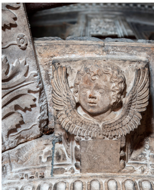
9. a - b Šibenik, katedrala, N. Firentinac (1499.) hibridni ornamenti: a. nasloni kanoničkih klupa (snimka: B. Pavazza, 2021.), b. vijenac korskih klupa koji se spaja s kružnim podestom ambona (arhiva HRZ-a, snimka: N. Vasić, 2016.)

Šibenik, cathedral, Nicholas of Florence (1499), hybrid ornaments: a. back of choir stalls (B. Pavazza, 2021), b. cornice of choir stalls joining the circular platform of the ambo (HRZ Photo Archive, N. Vasić, 2016)