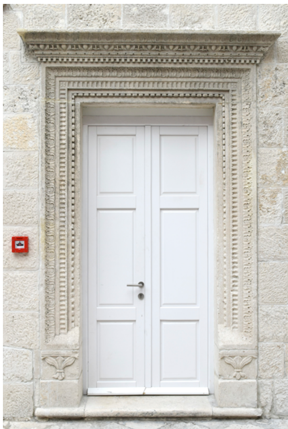
2. Korčula, palača Gabriellis, glavni portal, kameni okvir, rad Nikole Firentinca Korčula, Gabriellis Palace, main portal, stone frame, Nicholas of Florence

Ovaj je klasično ornamentirani okvir, kao glavni portal, asimetrično pozicioniran na desnoj strani istočnog pročelja palače (sl. 1 i 2). Svojim nizovima reljefnih ukrasa, ritmično položenima na kamenu profil ulaznih vrata, znatno se izdvaja od ostatka fasadne dekoracije kao