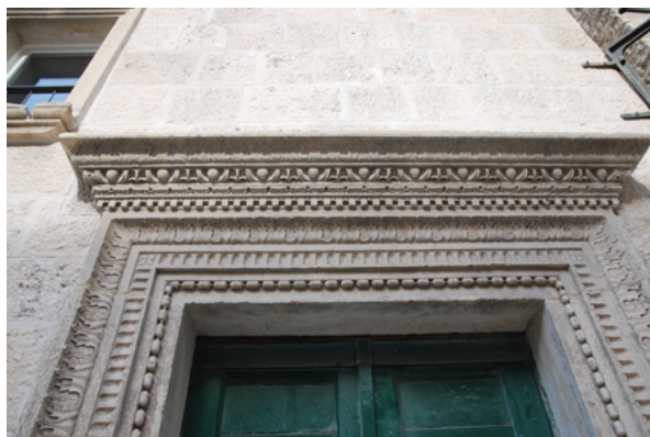
3. Skladni spoj kamenog okvira N. Firentinca s nadvratnim vijencem P. Andrijića Harmonious combination of Nicholas of Florence's stone frame and the cornice of P. Andrijić

stilski specifičan i primjetno drugačiji, ukrasni akcent. U kontekstu dekorativnog opusa Nikole Firentinca, predstavlja određen odmak jer dubinom svog reljefa ne razvija plastičnu prodornost nekih primjera izražajne ornamentike, poput velikog portala franjevačke crkve sv. Marije od Milosti u Hvaru ili poznatih Firentinčevih ciklusa