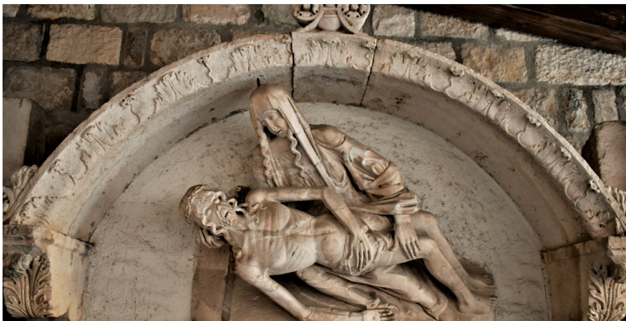
6. Split, Muzej grada Splita, luneta portala crkve sv. Eufemije, N. Firentinac (1465.) prva primjena ornamenta akantusa u kombinaciji s cvijetom (snimka: B. Pavazza, 2021.)

Split, Split City Museum, lunette of the portal of the church of St. Euphemia, Nicholas of Florence (1465), first use of acanthus ornament in combination with a flower (B. Pavazza, 2021)