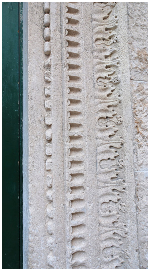
5. Korčula, palača Gabriellis, desni dovratnik ulaznog portala, N. Firentinac (snimka: B. Pavazza, 2020.) Korčula, Gabriellis Palace, right door post of the entrance portal, Nicholas of Florence (B. Pavazza, 2020)

arhitektonske plastike u Trogiru i Šibeniku. Ipak, na suzdržan način, fluidnim gradiranjem ornamentiranih traka i lakoćom klesarske izvedbe, obznanjuje ruku vještog Majstora. Izveden je u formi ukrasnog okvira, pri čemu čitav sklop s kaskadnim nizovima ornamentata skreće na uglovima, pod pravim kutom, iz vodoravnog usmjerenja u uspravno, po uzoru na velike portale antičkog vremena koji su Nikoli, tijekom njegova dugog radnog vijeka u Dalmaciji, bili lako dostupni, ogledni primjeri. 13