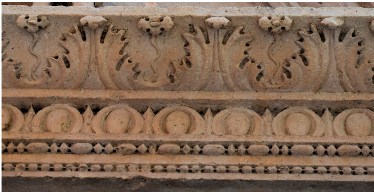
7. Šibenik, crkva sv. Ivana, južno pročelje, vijenac renesansnog prozora, N. Firentinac (1475.) Šibenik, church of St John, south façade, Renaissance window cornice, Nicholas of Florence (1475)

od polukružnog vijenca na luneti portala Sv. Eufemije u Splitu s motivom Pietà iz 1465. godine (sl. 6), a zatim se 1475. godine javlja u Šibeniku, na kornišu prozora južnog pročelja crkve sv. Ivana (sl. 7), te odmah pored, na balustradi stubišta istog pročelja, kao zanjihani cvijet bez listova akantusa. Otprilike u istom vremenu majstor ovu kombinaciju cvjetova i akantusovih listova koristi u punijem volumenu i razrađenoj formi na zidovima svojevrsne dekorativno-skulpturalne galerije u kapeli blaženog biskupa Ivana Trogirskog (Ursinija) čija je gradnja započeta 1468. godine. 17 Tu su nizovi ovih ornamenta raspoređeni duž glavnog vijenca koji nose anđeli telamoni , a prostiru se preko svih stranica kapele te se nastavljaju preko ulaznih pilastara (sl. 8 a i 8 b). Njihova je modelacija naglašena, a oblici su klasično i jasno rezani, s dubljim sjenama i svjetlijim akcentima dok su facete završnih, kliznih udaraca ravnim dlijetom, lako uočljive. Listovi akantusa masivniji su i znatno izdvojeni od podloge, središnji se vrh lista presavija dublje u prostor, a zanjihani cvjetovi u visokom reljefu krupniji su te su njihove četiri latice oblikovane zasebno i dodatno odvojene izbušenom rupom, dok je stapka čvrsto povezana s listovima kao jedna cjelina.