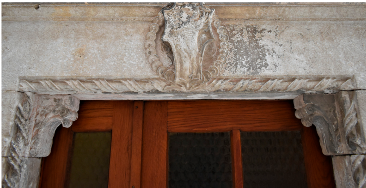
12. Korčula, ulica Žitnica, (palača Dragojević?) nadvratnik s grbom obitelji Mihetić-Dragojević, N. Firentinac Korčula, Ulica Žitnica, (Dragojević Palace?) lintel with coat of arms of the Mihetić-Dragojević family, Nicholas of Florence

Zadarskim je naručiteljima isporučio potprozornike za kuće Ghirardini i Pasini, a u franjevačkoj je crkvi izradio grb za plemićku obitelj Detrico. 31 Sljedeći se prijedlog odnosi na Nikolino autorstvo za jedno sasvim malo kiparsko djelo. Riječ je o kamenom nadvratniku s obiteljskim grbom koji je dio ulaznog portala kuće u korčulanskoj ulici Žitnica. 32 (sl. 12 i 13) Ova se kuća svojim graditeljskim obilježjima i opremom može svrstati u bogatije uređena zdanja gradske jezgre. 33 Smještena je pored palače Paparčić, u istom nizu koji se pruža na istok do glavne Ulice Korčulanskog statuta i komunalnog trga s vijećnicom, a na zapad do Trga korčulanskih klesara i kipara. Kameni okvir njezina nevelikog ulaznog portala, na unutarnjim je bridovima obrubljen reljefnim oktogonalm štapićem koji obavija dvostruka uvijena traka. Gornje uglove otvora za vrata, zapremaju tipični kasnogotički, konzolni ukrasi. Ovaj je način dekoriranja ulaznog portala uobičajen za korčulansku sredinu u 15. i početkom 16. stoljeća, stoga se dovratnici mogu odrediti kao proizvod lokalne klesarske radionice. 34