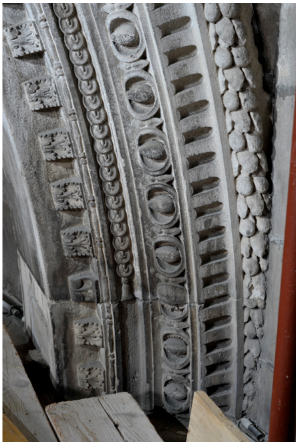
14 a - b. Šibenik, katedrala Sv. Jakova, veliki arhivolt glavne apside, niz ornamentata preklapljenih kolutova (1476.–1479.), N. Firentinac Šibenik, cathedral of St Jacob, large archivolt of the main apse, a series of ornaments of folded rings (1476–1479), Nicholas of Florence

elementi grba s crtačkim i anatomskim detaljima uzdignutog grifona vrlo vješto i minuciozno izvedeni, što su bile i Nikoline odlike, 36 po njima nije moguće precizno prepoznati ruku klesara, s obzirom na to da je više majstora tog vremena, uz povećanu usredotočenost na ovako malom formatu i uz pomoć predloška ili prikladnog crteža u mjerilu 1 : 1, moglo postići dobar rezultat. Ono što bi moglo suziti širi krug potencijalnih izvođača ovog djela, odabir je i kvaliteta izrade reljefnog ornamenta koji