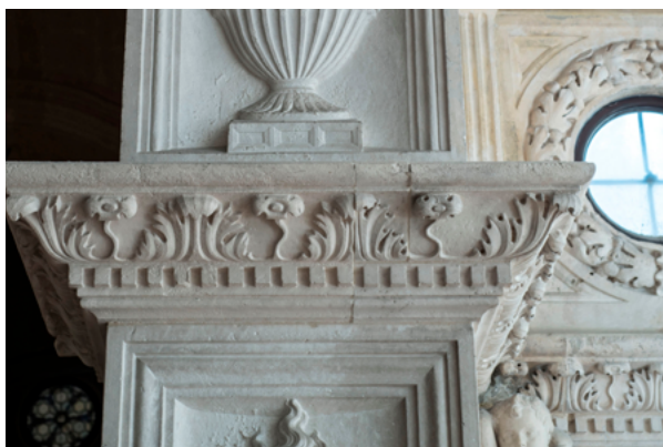
8. a - b Trogir, kapela biskupa Ivana Ursinija, N. Firentinac (1468.–1480.), ornamenti akantusa s cvijetom: a. unutarnji kornič koji nose anđeli telamoni, b. ulazni pilaster

Trogir, chapel of Bishop Ivan Ursini, Nicholas of Florence (1468–1480), acanthus ornaments with a flower: a. inner cornice carried by telamon angels, b. entrance pilaster