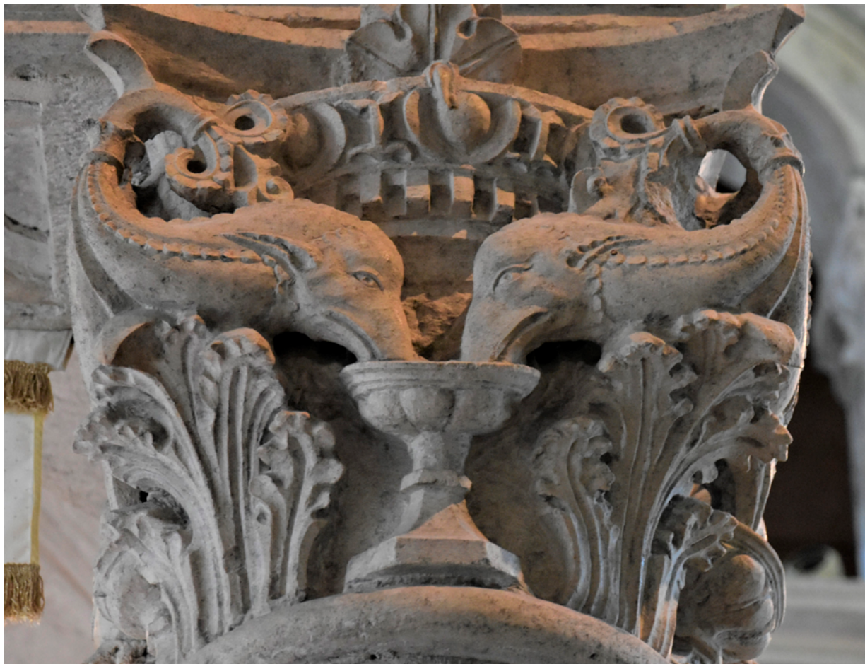
10. Korčula, katedrala sv. Marka, kapitel ciborija, primjer preoblikovanja antičkog ornamenta ovulusa – Marko Andrijić (1486.) (snimka: B. Pavazza, 2021.)

Korčula, cathedral of St Mark, ciborium capital, example of transforming an ancient ovolo ornament, Marko Andrijić (1486) (B. Pavazza, 2021)