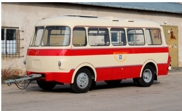
3. Autobusna prikolica Jelcz PO1 iz 1972. godine. Konzervatorsko-restauratorske radove izveo je Vlastimil Urbánek u suradnji s Prometnim poduzećem grada Brna i radionicom Metodološkog centra za konzervaciju Tehničkog muzeja u Brnu u Rečkovicama Jelcz PO1 bus trailer of 1972. Conservation was carried out by Vlastimil Urbánek in cooperation with the Transport Company of the City of Brno and the workshop of the Methodological Centre for Conservation of the Technical Museum in Brno, in Rečkovice