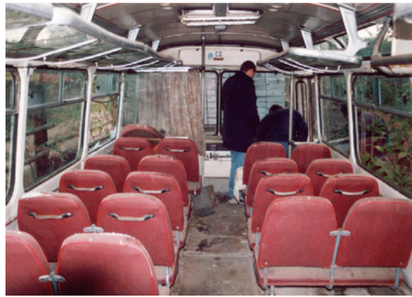
11. Zatečeno stanje interijera autobusa Karosa ŠL 11.1305 (TMB, snimka: T. Kocman, 2003.)

Autobusni pod je načinjen od voodootporne šperploče. Pojedini rezani dijelovi pričvršćeni su vijcima na čelične profile okvira kolnog ormara. Voodootporna je šperploča s vanjske strane pokrivena lijepljenom podnom oblogom. U sredini se poda nalazi crna rebrasta guma koju i danas nudi tvrtka Gumex, dok je glatka siva podna obloga Linolit ispod sjedala trebala biti zamijenjena novim materijalom, podnom oblogom Super iste sive boje. Od kraja pedesetih godina u češkim su se vozilima javnog prijevoza kao unutarnja obloga koristile ploče od umakarta s karakterističnim uzorkom površine. Proizvodnja umakarta trajala je više od četrdeset godina u kemijskom poduzeću UMA Pardubice. Umakart znači umjetni karton, a u današnje vrijeme zamjenjuju ga HPL ploče ( high pressure laminat ). Srećom je originalna unutarnja obloga od umakarta u autobusu Karosa ŠL 11.1305 bila u vrlo dobrom stanju, te se mogla sačuvati i iznova iskoristiti tijekom restauratorskih radova (sl. 13).