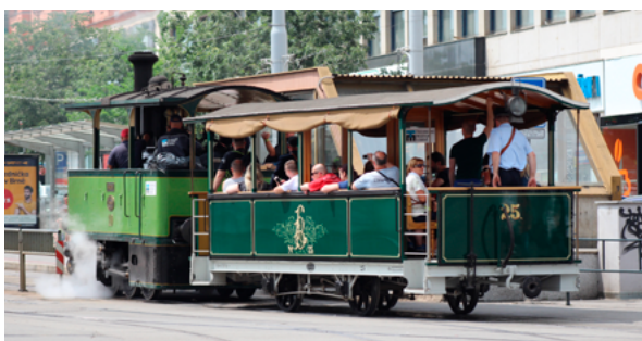
4. Parna tramvajska lokomotiva Caroline s prikolicom broj 25 našla se u središtu pozornosti javnosti za vrijeme proslave 150. obljetnice tramvajskog prometa u Brnu 2019. godine (TMB, snimka: T. Kocman, 2019.) Caroline steam tram locomotive with trailer number 25 was in the public spotlight during the celebration of the 150 th anniversary of tram traffic in Brno in 2019 (TMB, T. Kocman, 2019)