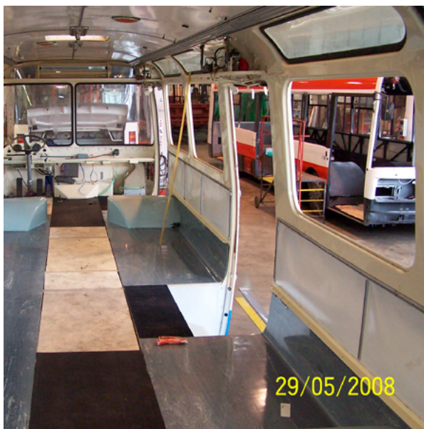
13. Lijepljenje novih podnih obloga u interijeru autobusa Karosa ŠL 11.1305 (2008.)

Gluing new flooring in the Karos ŠL 11.1305 bus (2008)