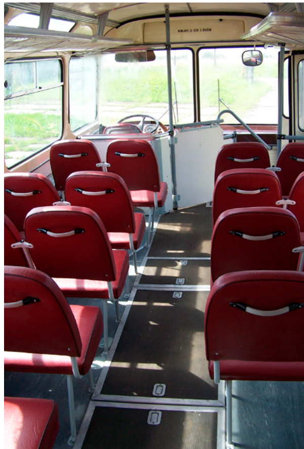
12. Stanje interijera autobusa Karosa ŠL 11.1305 nakon konzervatorskog-restauratorskog zahvata (TMB, snimka: T. Kocman, 2009.)

Condition of the interior of the Karos ŠL 11.1305 bus before conservation (TMB, T. Kocman, 2003)