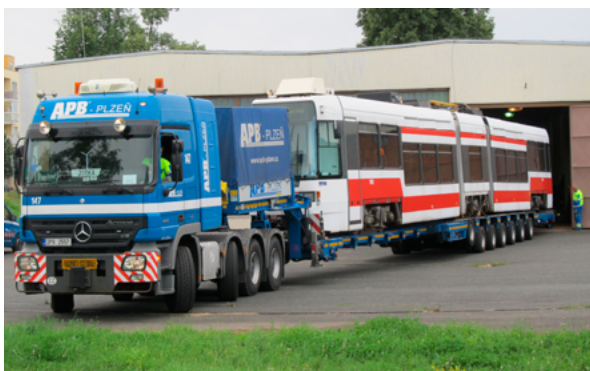
2. Tramvaj ČKD RT6N izrađen 1997. godine tijekom istovara iz specijalnih kola u depou Tehničkog muzeja u Brnu 22. lipnja 2018. godine Tram ČKD RT6N, made in 1997, during unloading from special cars in the depot of the Technical Museum in Brno on June 22, 2018

U okviru testiranja procjenjuje se i povijesna originalnost, kao i tehničko stanje vozila. 3 Pravila za tračnička