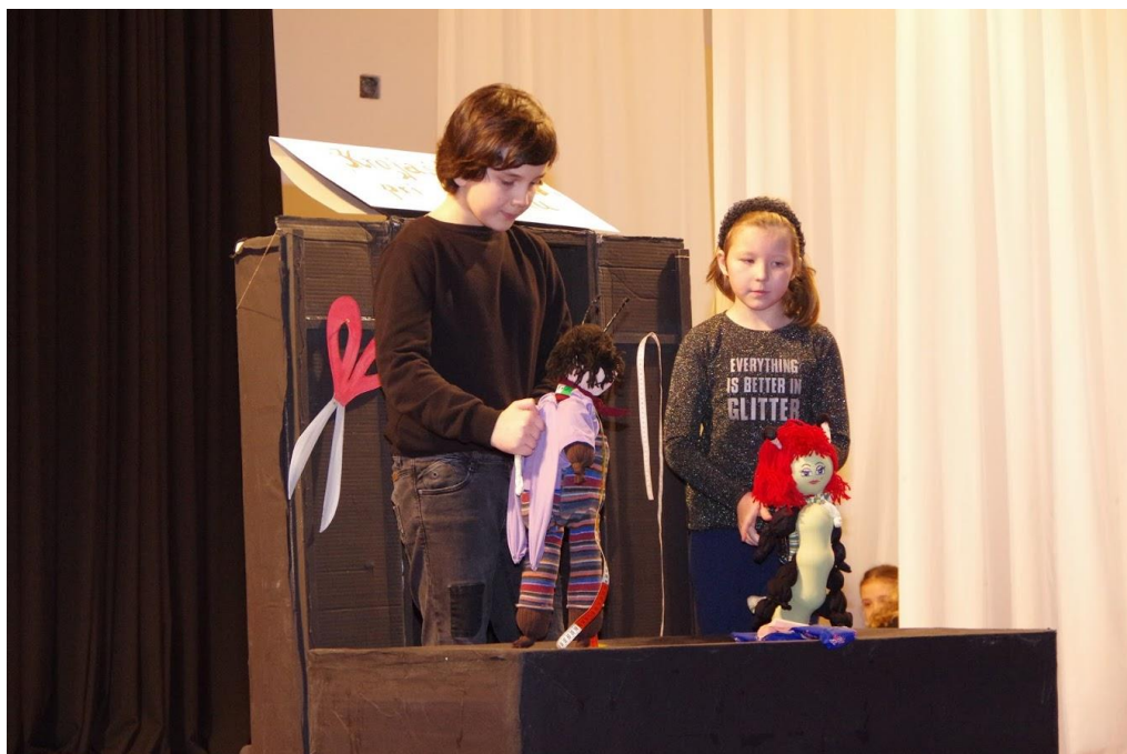
Slika 3. Krojač Cvrčak i gusjenica Tia