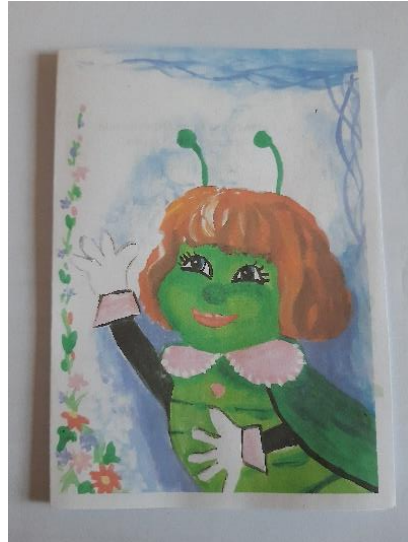
Slika 5. Kazališni list

Kazališni list je izrađen jednostavno. Bijeli list presavijen na pola i obojan tempera bojama.