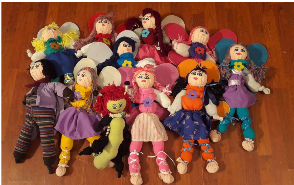
Slika 1. Lutke leptirice, gusjenica i cvrčak