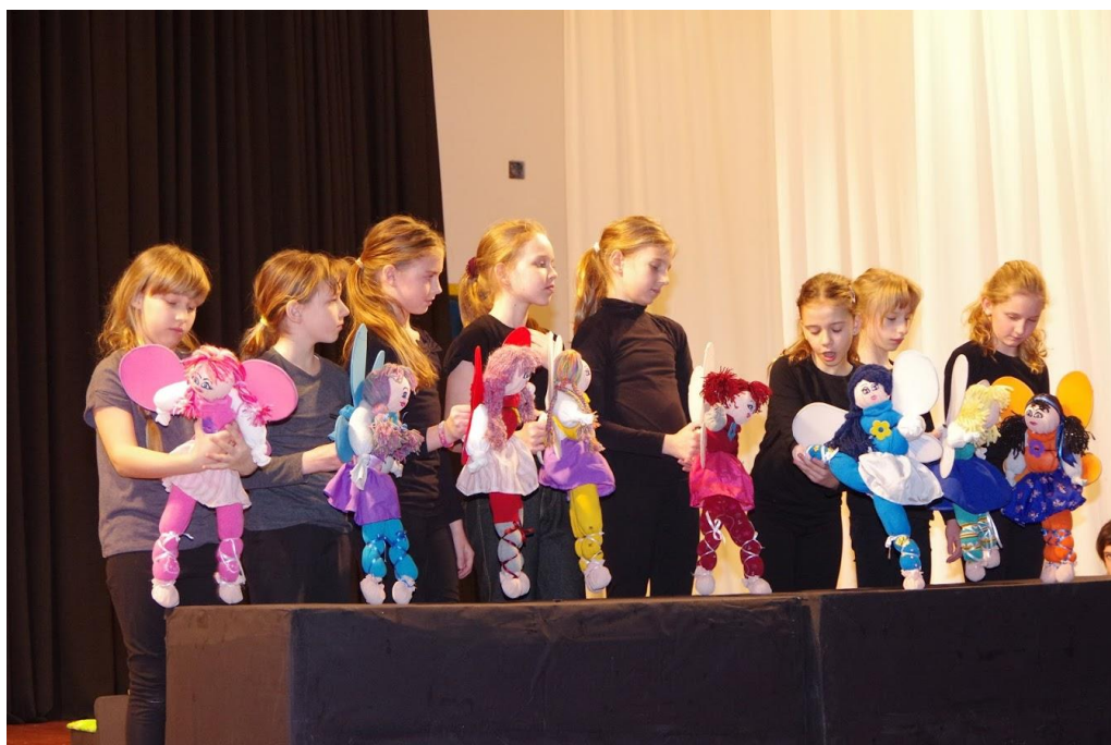
Slika 2. Leptirice

Za scenu smo upotrijebili dvije velike kartonske kutije i obojili ih crnom temperom.