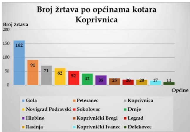
Grafikon 1. – Broj žrtava po općinama kotara Koprivnica (izvor: Izrada autora, prema: HR-HDA-1944-KUŽ, kut. 137-142).