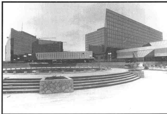
2. Arh. Ivan Antić: Blok 20 - Novi Beograd: "Jugopetrol" poslovna zgrada, hotel "Hyatt"

Rekonstrukcija Narodnog pozorišta samo je još jedan dokaz kako stoljetne rekonstrukcije u ovom gradu podliježu nekompetentnim zavodima za zaštitu spomenika kulture, koji spuštaju kriterije vrednovanja kuća, svakim danom. Svaka intervencija, u povijesti, bila je odraz tog trenutka, te ne uviđamo razloge kompromisa između starog i novog. Današnje zdanje, koje