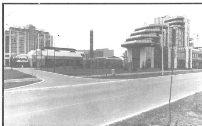
3. Arh. Kosta Reljić: Blok 20 - Novi Beograd: "Genex" poslovni centar