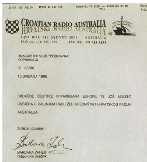
Sl. 10. Čestitka pristigla čak iz Australije.