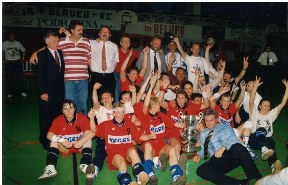
Sl. 7. Mi smo Prvaci! RK Podravka Prvak Europe!

bes na parketu i tribini može započeti tako da su zvuk sirene koja označava kraj dočekali svi u jednom velikom zagrljaju.