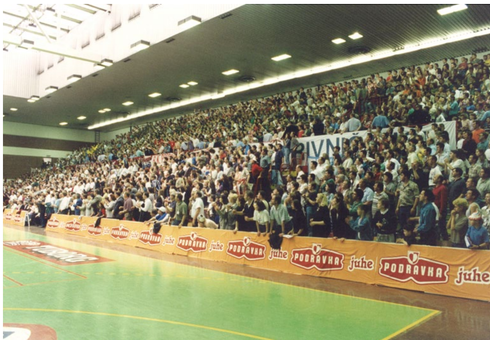
Sl. 1. Sportska dvorana je dva sata prije početka utakmice bila ispunjena do posljednjeg mjesta.

Gošće su na uzvratni susret u Koprivnicu došle sa četiri pogotka prednosti, jer je Podravka prvu finalnu utakmicu u Beču izgubila rezultatom 17:13, koji pokazuje da napad baš nije bio učinkovit. Iznimno loš početak igračica Podravke rezultirao je ranim i visokim vodstvom domaće ekipe 6:0, koje je tijekom utakmice bilo nemoguće stići. U kalkulacijama za uzvratnu utakmicu u Koprivnici igrala je isključivo