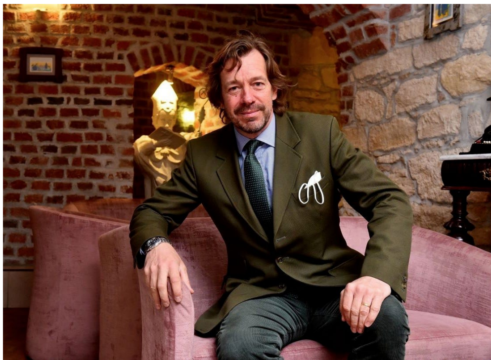
Sl. 3. Grof Nikolaus Draskovic

Moj se otac trudio održati kontakt s ljudima i vlastima u Velikom Bukovcu nakon rata. Ranih 1970-ih dva ili tri puta smo posjetili Bukovec tijekom nogometnih utakmica momčadi iz našeg grada protiv ekipe iz NK u Bukovcu. Dvorac je tada bio škola i sjećam se kabineta biologije na prvom katu koji je bio pun prepariranih životinja i trofeja mog djeda. To su bili moji prvi posjeti Bukovcu. Sjećam se svete mise kada su sanduci s posmrtnih ostacima mog pradjeda i prabake premješteni iz kapele u Križančiji u župnu crkvu u Velikom Bukovcu gdje su potom pokopani.