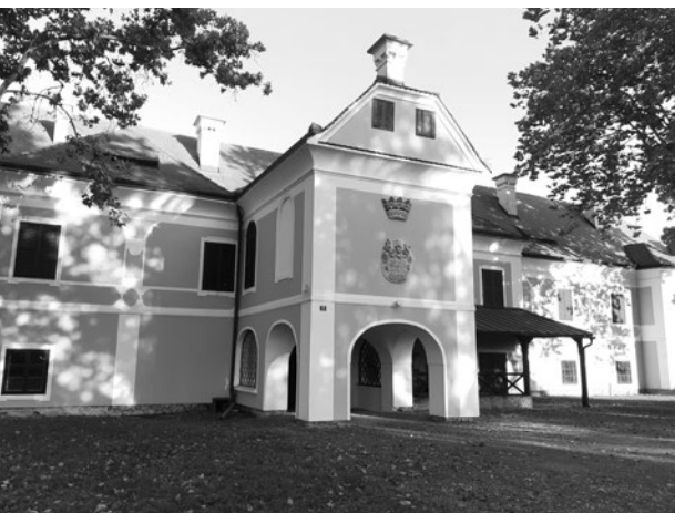
Sl. 1. Dvorac u Velikom Bukovcu danas

Moj djed Pavao koji je bio vlasnik posjeda tada je živio između Gradišća i Bukovca. Putovati u doba rata bilo je izrazito teško i bile su potrebne mnoge propusnice i pristojbe za prelazak iz NDH u Mađarsku ili 3. Reich, a prema kraju rata to je postalo nemoguće. Mislim da je djed zadnji put posjetio Bukovec 1943., možda jednom 1944., a potom mu više nikad nije dozvoljeno da