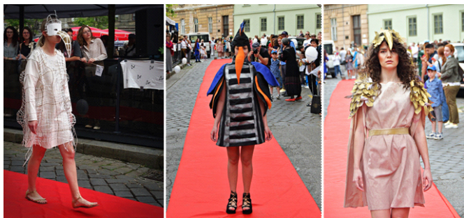
Slika 9. EDU radionica Kostim – moda – performans – suvremena umjetnost, izložba u Galeriji KARAS, Praška 8, Zagreb 2015.

U zaključku se može posebno istaknuti neiscrpna sinergija umjetničkog i tehničkog (odnosno majstorskog i zanatskog) polja stvaralaštva s jedne strane i komplementarnost mentorskog rada i studenskih radova s druge strane, jednako vrijednih u polju umjetničke kreacije i u polju tehničke izvedbe EDU međunarodnih studentskih radionica. Time se potvrđuje kontinuirana potrebitost inovativnih pristupa u obrazovnom programu, kako u znanstvenom, tako i u praktičnom radu.