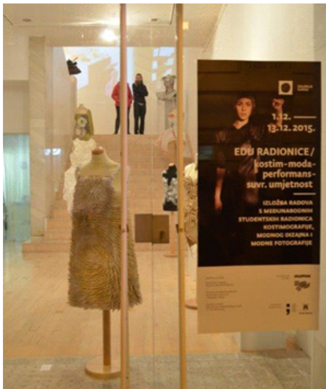
Slika 9. EDU radionica Kostim – moda– performans – suvremena umjetnost, izložba u Galeriji KARAS, Praška 8, Zagreb 2015.