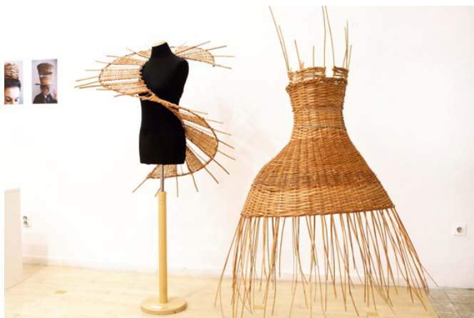
Slika 5. Radovi polaznika radionice Pletenja pruća u materijalu trske i šiblja kao teme i medija u suvremenoj umjetnosti, produkt dizajnu i modi, izložba u Galeriji KARAS, Praška 8, Zagreb 2013., Foto: Tomislav Rastić

Tijekom studenog 2013. u sklopu radionice Pletenja pruća u materijalu trske i šiblja kao teme i medija u suvremenoj umjetnosti, produkt dizajnu i modi pod vodstvom Tonija Franovića, slikara i Ann Elizabet, skulptorice te u suradnji s majstorima zanata Vladimirom Rumecom i Dragutinom Francekom Matošem, realizirani su radovi od osnovne skice do realiziranog umjetničkog rada, koji su zajedno s radionicama kostimografije i modne fotografije bili prezentirani javnosti u galeriji Karas. Petero studenata različitih zagrebačkih Fakulteta provelo je pet dana u slikovitom ambijentu i susrelo se u prirodi s materijalima trske i šiblja – upoznali su tehnike rezanja, obrade, sušenja i finalnog pletenja objekta prema prethodno izrađenih skicama. Pletenjem pruća i šiblja na manufakturni, stoljećima neizmijenjen način, mogu nastati novi jezici mode, a ne samo „demižoni“ vina, košare ili vrtnice stolice (slika 6 i 7).