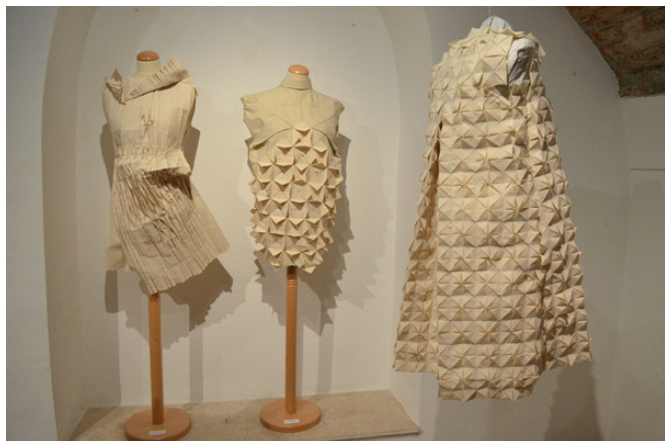
Slika 10. Radovi polaznika radionice Origami, izložba u Galeriji ULUPUH, Tkalčićeva 14, Zagreb 2016.

Radionice fotografije najbolje prezentira primjer radionice iz 2016. [6], s izložbom u TTF galeriji 2017., koju u predgovoru izložbe opisuje Silva Kalčić: