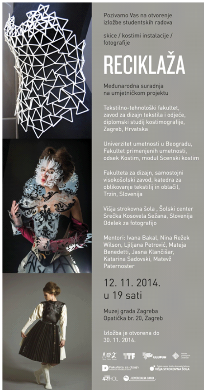
Slika 2. Pozivnica za izložbu Reciklaža , Muzej grada Zagreba, Zagreb 2014.

mentorstva unutar 5 dana u javnim prostorima galerija u sklopu privremeno oformljenih šivaona i radiona, do nastave na daljinu, kao posljedicu pandemije COVID-a (hibridno realizirane radionice kombinacijom nastave uživo i „na daljinu“ ili u najtežim trenucima pandemije, realizacijom potpuno „na daljinu“ putem ZOOM platforme ili WhatsApp aplikacije 1 ).