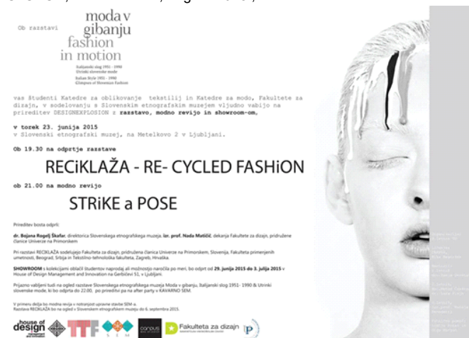
Slika 4. Plakat izložbe Reciklaža – RE-CYCLED Fashion , u sklopu izložbe Moda v gibanju , Slovenski etnografski Muzej, Ljubljana 2015.