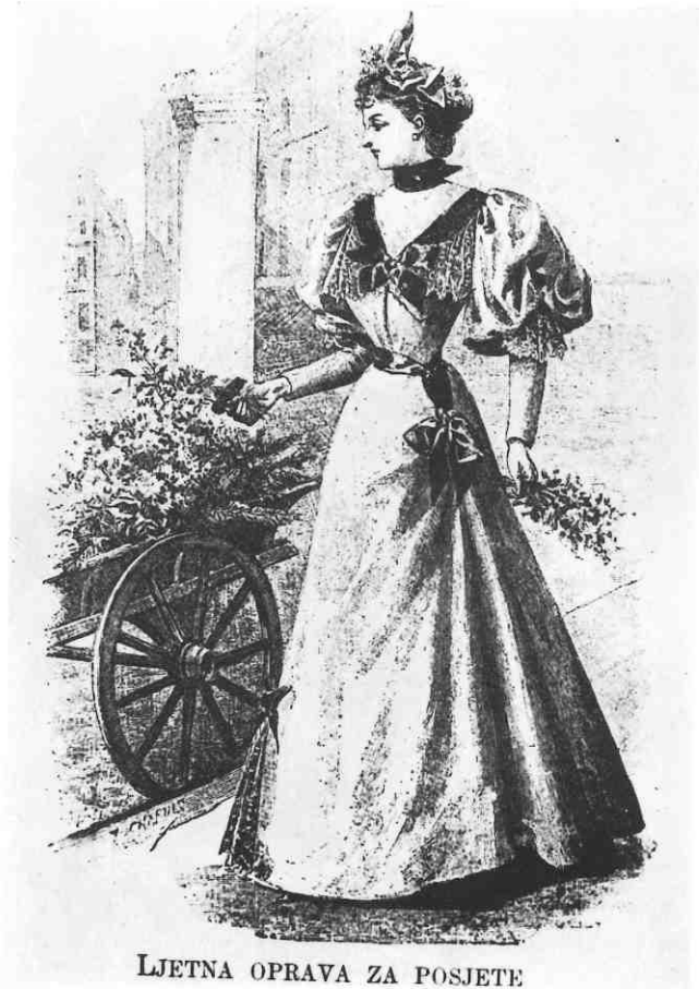
LJETNA OPRAVA ZA POSJETE

diferencirani modeli za odrasle žene i oni za djecu raznih uzrasta. Samo nigdje nije bilo muških modela, naprosto su nestali iz modnih novina. Umjesto adresa modnih salona sad su uz modele sasvim konkretne praktične upute za izradu pojedinih modela, a često i krojni arci (ne zaboravimo da smo u eri šivaćih strojeva). Zbog višestruke važnosti i očiglednih referenci na razvoj naše modne žurnalistike posebno ćemo se još osvrnuti na likovno-grafičku opremu berlinskih novina. Veoma kitnjasto zaglavlje s ornamentiranim slovima, puttima i biljnim viticama bit će pratnja mnogih sličnih novina i zadržat će se s manjim oscilacijama do kraja stoljeća. Čitav tekst modnog priloga sastoji se od opisa modela i uputa za rad, a samo izuzetno zalutaju neki opći tekstovi o novoj modi. Stranice su pravilno, strogo simetrično komponirane, pa će simetrična kompozicija biti prepoznatljivo obilježje stranice modnog lista sve do osamdesetih godina. Veoma su popularne srednje stranice, »duplerice«, s velikim grupama modela. Ti se gruppni prizori nastoje povezati i osmisлити nekom zajedničkom radnjom (najčešće šetnjom na promeni ili u parku), a da pri tom ne bude narušena jasnoća pojedinog modela.