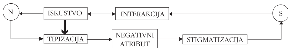
Shema 3. Situacija niske razine anonimnosti

Svjesni važnosti igranja uloga (i posljedica neigranja) pojedinci prihvaćaju uloge koje im je društvo namijenilo (što vrijedi i za “normalne” i za stigmatizirane, devijantne uloge) i nastavljaju se ponašati u skladu s njima, što u ekstremnom slučaju može dovesti i do svojevrsnog poništenja osobnosti. Tipiziranje i igranje uloga, samo po sebi, nije loše, čak je i neophodno za funkcioniranje pojedinca i društvenog života. Kada ne bismo tipizirali, morali bismo pomno analizirati svaku osobu koju susretnemo (kao i njezine namjere), što bi iziskivalo previše energije i vremena i kosilo se s pragmatičnom prirodom svakodnevice. No, ako i kada tipiziramo drugu osobu na temelju očekivanog atributa (za koji nas je društvo socijalizacijom naučilo da prema njemu trebamo zauzeti negativan stav, pa se on u našoj svijesti pojavljuje kao negativan atribut), i na njemu tvrdoglavo ustrajemo čak i onda kada imamo drugačije informacije – znači da tu osobu nepotrebno stigmatiziramo. Takav stav je zatim teško napustiti jer “čim se akteri tipiziraju kao izvođači (stigmatiziranih, op. a.) uloga, njihovo vladanje ipso facto podliježe prisilnom provođenju. Udovoljavanje i neudovoljavanje društvenim standardima uloga više nije stvar izbora” (Berger i Luckman, 1992.:95). Ipak, postoji i jednostavan proces kojim se tipizacija i stigmatizacija mogu smanjiti ili čak izbjeći/nadići, što prikazuje sljedeća shema: