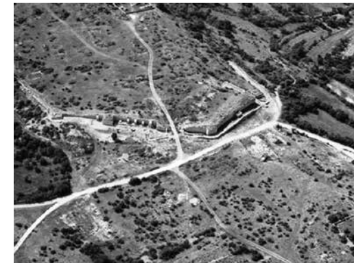
Sl. 4. Zračni snimak Aserije

istraživanja na području Aserije. 26 Ubrzo nakon toga, 1906. godine naš poznati pjesnik i putopisac Ante Tresić Pavičić (1867. – 1949.) posjećuje i opisuje pojedine znamenitosti aserijatskog areala. 27 U novije vrijeme se sustavna arheološka istraživanja vrše na prostoru Aserije od 1998. godine pod stručnim vodstvom dr. sc. Ive Fadića i dovela su do mnogih zanimljivih spoznaja o životu toga grada. Upravo bi daljnja arheološka istraživanja mogla potvrditi sliku Aserije kao jednog od najvažnijih arheoloških lokaliteta na području Liburnije i šireg prostora rimske provincije Dalmacije.