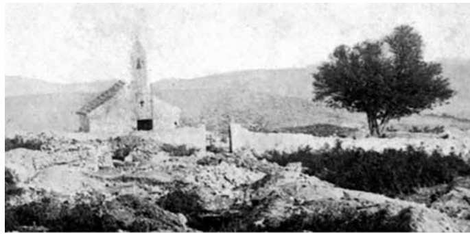
Sl. 3. Prikaz crkve sv. Duha na području Aserije (P. VEŽIĆ, 2004)

Alberto Fortis također daje sliku morlačkoga naroda i njihovog odnosa prema kulturnom nasljeđu i arheološkim spomenicima Aserije. Prema Fortisu, dotični Morlaci nisu oštećivali spomenike kopajući ili orući zemlju. Međutim, zbog neimaštine su silom prilika bili prisiljeni iz zaleđa volovima odvoziti stanovite nadgrobne spomenike sve do mora. Prema riječima Alberta Fortisa, morlački stanovnici Podgrađa bi postali tragači i čuvari starodrevnih spomenika kada bi se nadali nagradi za otkrića i trud. 22 Taj podatak nadalje valja koristiti u pogledu postojanja, odnosno, ubikacije nekropole s kamenim nadgrobnim spomenicima. U jednoj drugoj epizodi Fortis u kući stanovitog Morlaka Jureke otkupljuje za male novce također jedan nadgrobni spomenik, kojeg sa sobom nosi u Italiju. 23 To nažalost nije usamljen primjer otuđivanja spomeničke baštine sa prostora Aserije, odnosno, istočno-jadranske obale i njenog zaleđa u cjelosti. 24 Fortis konačno napušta područje Aserije, odnosno, Podgrađa „noseći u sebi jaku želju da se onamo vrati opskrbljen nužnom opremom za iskapanje“. 25