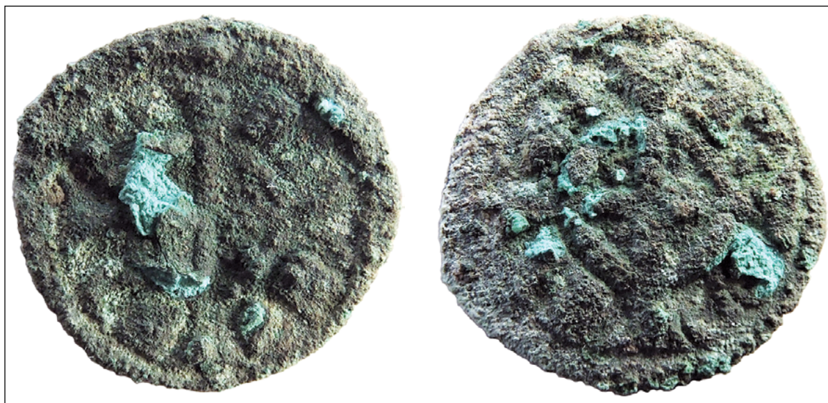
SLIKA 1. Novac rimsko-njemačkoga cara Fridrika II. Hohenstaufena (1218. – 1250.) iz pećine Vlakno na Dugome otoku