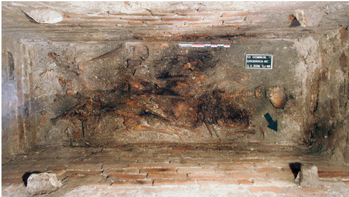
SLIKA 2. Grobnica 6