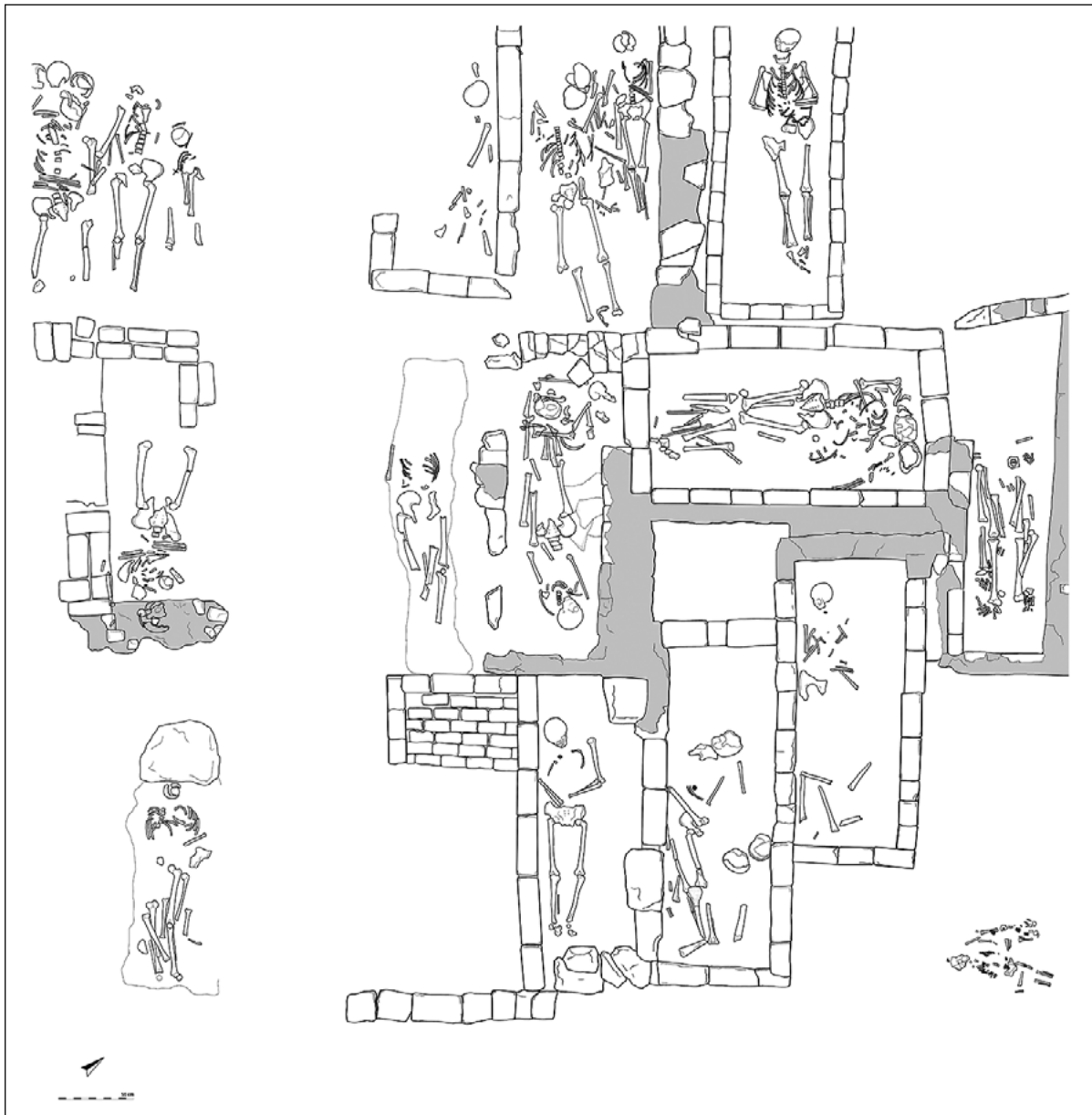
SLIKA 1. Tlocrt sonde (izradio: D. Vujević) FIGURE 1 Probe layout (made by D. Vujević)

dugo je bila poznata isključivo preko podataka iz arhivske građe. Osim manjih zahvata u apside provedenih tijekom posljednje obnove, u samoj crkvi nikad nisu obavljena arheološka istraživanja. Početkom 21. stoljeća Arheološki muzej Zadar provodio je istraživanja okolnog prostora crkve za potrebe gradnje nove zgrade Kazališta lutaka, pri čemu su otkriveni dijelovi samostana i različiti kulturni slojevi koji se mogu pratiti do rimskog razdoblja. 6 Godine