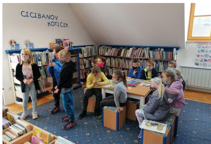
Slika 4. Posjet knjižnici

Tijekom razgledavanja odnosno prezentiranja knjižnice djeca se upoznaju s knjižnicom i njezinim 'ulogama', pri čemu im predstavimo način organiziranja knjižnice, naglasimo važnost čitanja te ih upoznamo s odgovornim postupanjem i čuvanjem knjige. Djeca usvajaju pravila ponašanja u knjižnici, te uče kako ju samostalno koristiti. Svrha je približiti djeci čitanje te potaknuti znatiželju, radoznalost i želju za otkrivanjem nečeg novog. Na taj način uvidjet će i da knjižnica ima neizmjerne mogućnosti da zadovolji njihovu znatiželju.