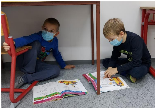
Slika 3. Čitanje u školi, minute za čitanje