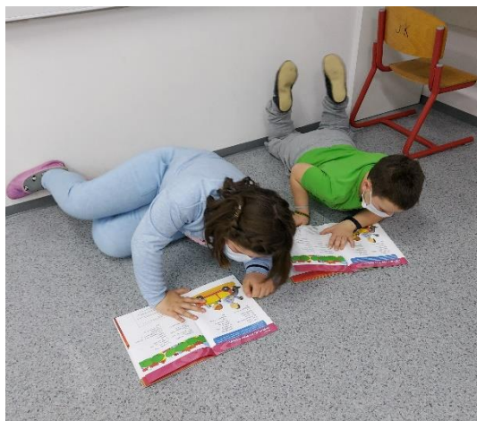
Slika 5. Čitanje u paru

U 3. razredu imamo kutak za čitanje koji koristimo i za čitanje u parovima. Čitamo metodom dugog čitanja, doživljenog čitanja. Pobuđujemo u djetetu želju za dodatnim čitanjem. Učenici čitaju u parovima. Svaki par odabere način čitanja. Svatko ima mogućnost pročitati jednu stranicu ili odlomak. Ovdje dolaze do izražaja princip suradnje te princip tolerancije. Knjige koje ih čekaju na knjižnoj polici također biraju po dogovoru, u paru.