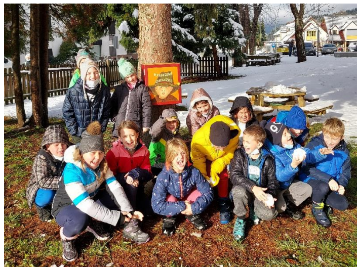
Slika 6. Mala slobodna knjižnica

Za ostale razrede u školi izradili smo pokazivače (kazala) za knjige s natpisom: Ako imaš knjigu viška, ne bacaj je. Nekome može biti neprocjenjivo blago i dobra prijateljica. Poklonili smo im pokazivače i na taj način potaknuli i ostale učenike da čitaju i uživaju u kutku pod borovima.