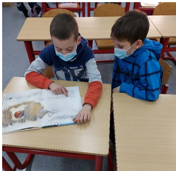
Slika 2. Čitanje u školi, čitateljska značka