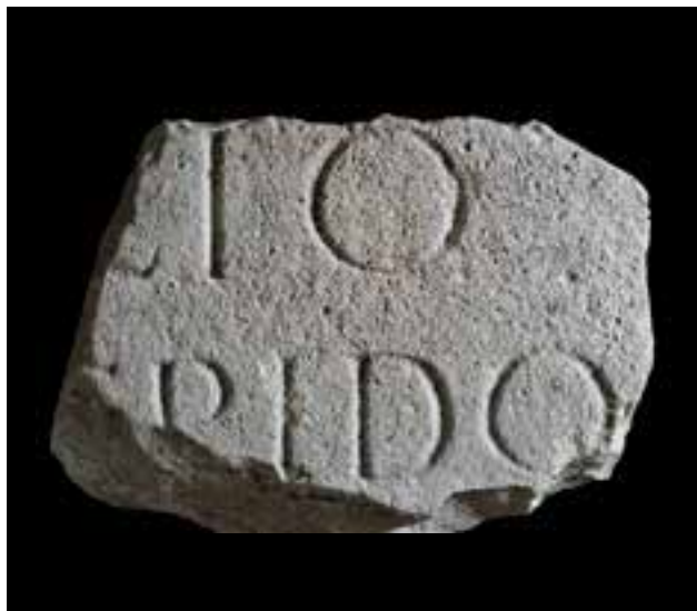
Slika 5 Ulomak natpisa M. Lepida iz Posušškoga Graca (Zemaljski muzej u Sarajevu; snimio O. Harl)