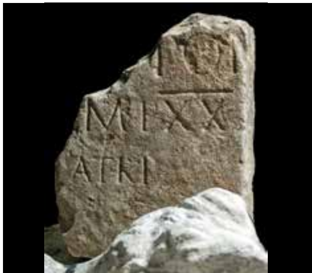
Slika 6 Augustov natpis iz Posušškoga Graca (Zemaljski muzej u Sarajevu)

spomenicima, netaknuta preživjela pobunu iliričkih etnija 6. – 9. godine. 32 Zbog toga je sasvim opravdano zaključiti da je podizanje rimskog kompleksa na Gradini u Posušskom Gracu bila direktna posljedica konačnoga gušenja pobune iliričkih etnija 9. godine. A to svakako potvrđuju i dva natpisa iz Augustova doba, koja se s popriličnom sigurnošću datiraju između 9. i 13. godine.