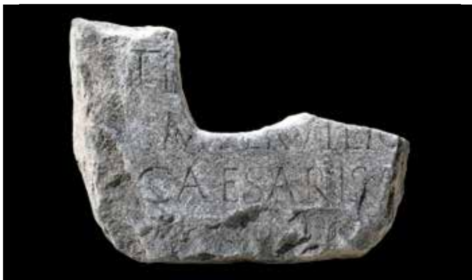
Slika 1 Natpis M. Servilija iz Salone (Arheološki muzej u Splitu)

prihvaćeno u većini modernih baza podataka. 5 Međutim, kada sam pregledavajući navedene baze podataka prvi put primijetio taj natpis, sa sigurnošću sam mogao predložiti restituciju natpisa na sljedeći način: