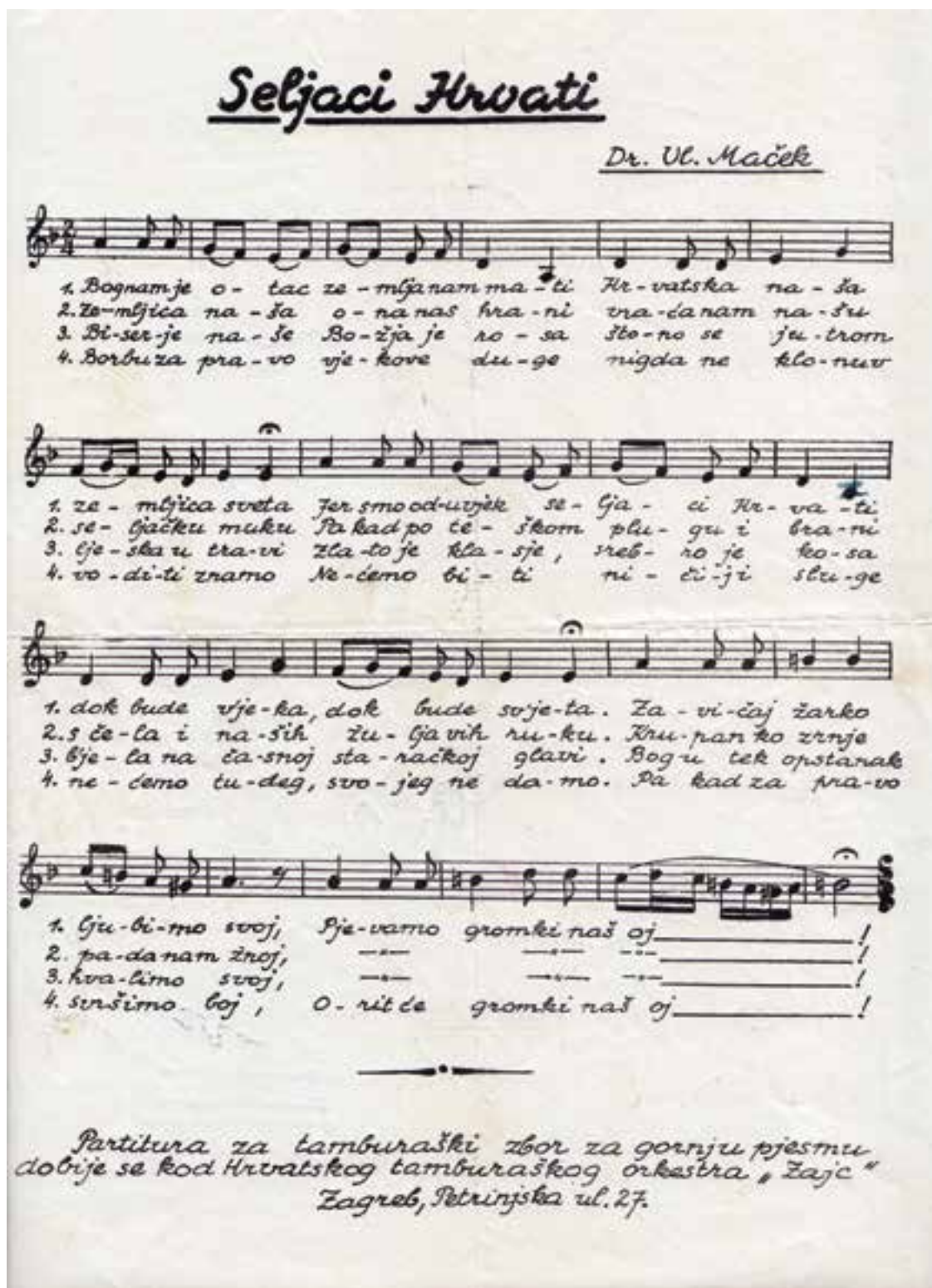
Vladko Maček: Seljaci Hrvati, za jednoglasni zbor i tamburaški orkestar (zbornica dionica), (arhiv muzikalija)