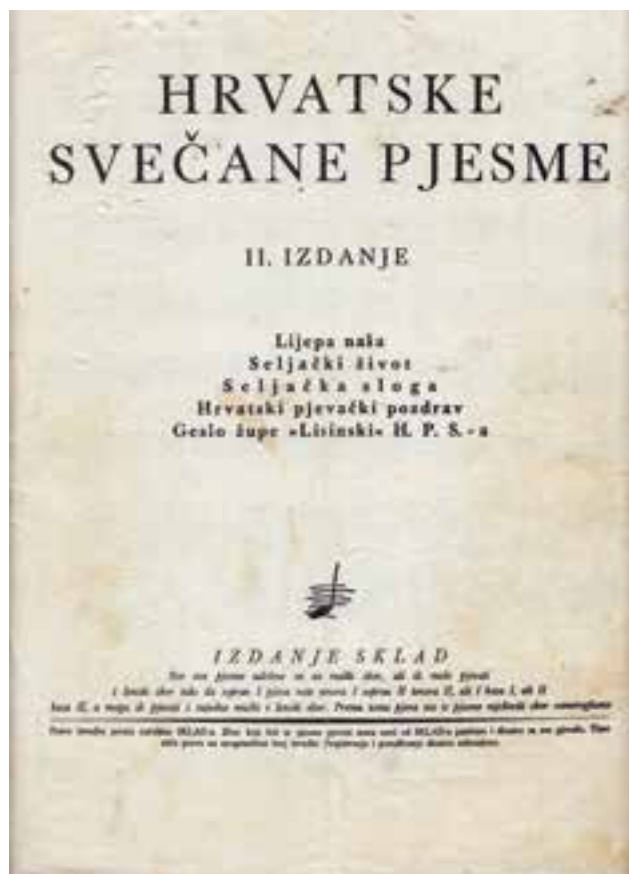
Slika 5 Naslovnica zbirke Hrvatske svečane pjesme u izdanju zadruga Sklad (arhiv muzikalija pjevačkog zbora Seljačke sloge Solin, vlasnik Tonći Čičerić)

Gordona Jacoba, Johna Irelanda i Williama G. Whittakera. Kritičar potpisan inicijalima V. K. u splitskom dnevniku Novo doba o Englezima piše u superlativima ističući kako su njihove odlike »fina kultura glasa, neobično muzikalna sigurnost, smisao za fino fraziranje i nijansiranje dinamičkih preliva, potpuna homogenost i slivenost glasovnih dionica u jednu skladnu cjelinu«. Spominje kako je nastup solinsko-vranjičkoga seljačkog zbora bio nenajavljen (naime, u programu su upotpunili nastup splitskoga pjevačkog društva »Tomislav« koje iz nepoznatih razloga