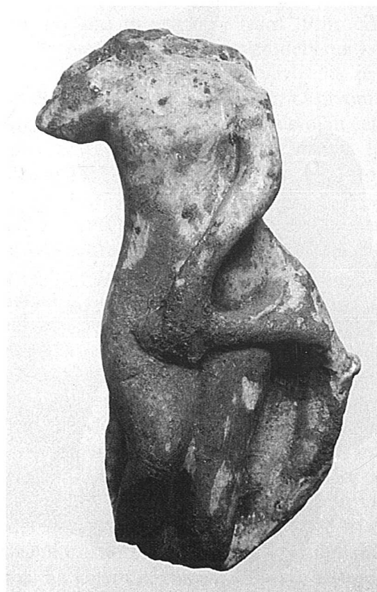
4. Manja figurica Venere - Afrodite od bijelog mramora