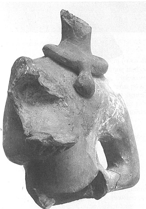
5. Gornji dio glinene muške figurice s ogrlicom i ostatkom lampice

6. Naga muška figurica od svijetlosmeđe pečene gline (u fakturi tamno sive), s ostacima sjajne crvenkastosmeđe prevlake, slična gornjoj. Glava joj također nije sačuvana kao ni desna ruka i predmet koji je njome držala (također nesrazmjerno velika lampica), ni veći dio punih raširenih debljih nogu. Na ramenima su sačuvani pramenovi duge kose, a na prsima slična masivna ogrlica s privjeskom kao na predhodnoj figurici, samo što ta ogrlica nije bila prikazana i straga. Lijeva joj je ruka, s urezima označenim prstima, također bila savijena u laktu i oslonjena na lijevi bok, s kojim je njen donji dio stolpljen. Straga su malo grublje, ali također zaglađeno prikazani obrisi tijela.