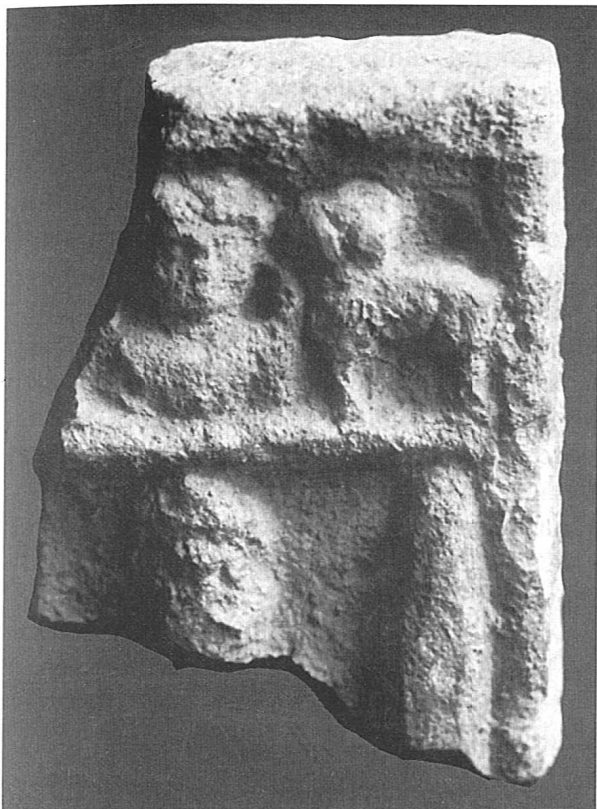
2. Ulomak ploče od vapnenca s ostacima reljefa u dva polja

obrađenoj pozadini, bila potpuno naga, te je teško vjerojatno da se radi o ostacima spuznute odjeće. Sačuvana visina 22, širina 6, debljina 3 cm. Nalazište Osijek-Kalvarija, 1898. godine. 2 Neobjavljena.