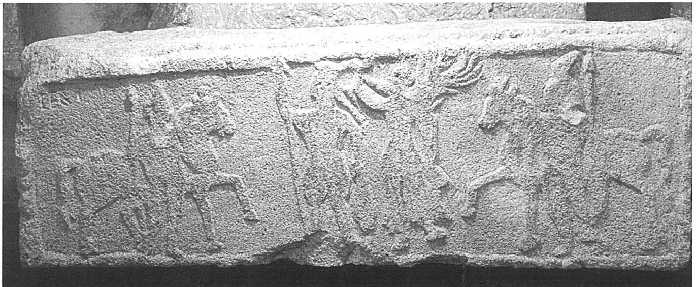
10. Prizmatički blok od pješčenjaka s rustikalnim reljefima dva božanstva s konjima, cara i Viktorije