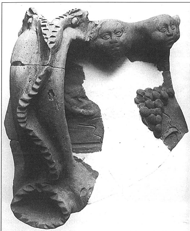
7. Ulomak ruba, gornjeg dijela i ručke s reljefima, glinene kultne vaze, sastavljen od više ulomaka - pogled srijeda

8. Olovna pločica s prikazima podunavskih konjanika, tipa Dalj, varijante A (I. Iskra-Janošić 1966., 50), pačetvorinastog oblika, po sredini malo ispupčena. Reljefni prikaz u četiri zone nalazi se unutar polukružne edikule ukrašene astragalom,