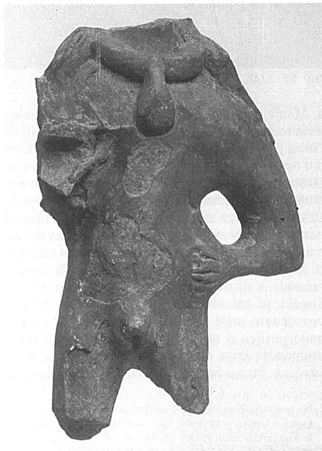
6. Slična glinena muška figurica s ogrlicom i lampicom