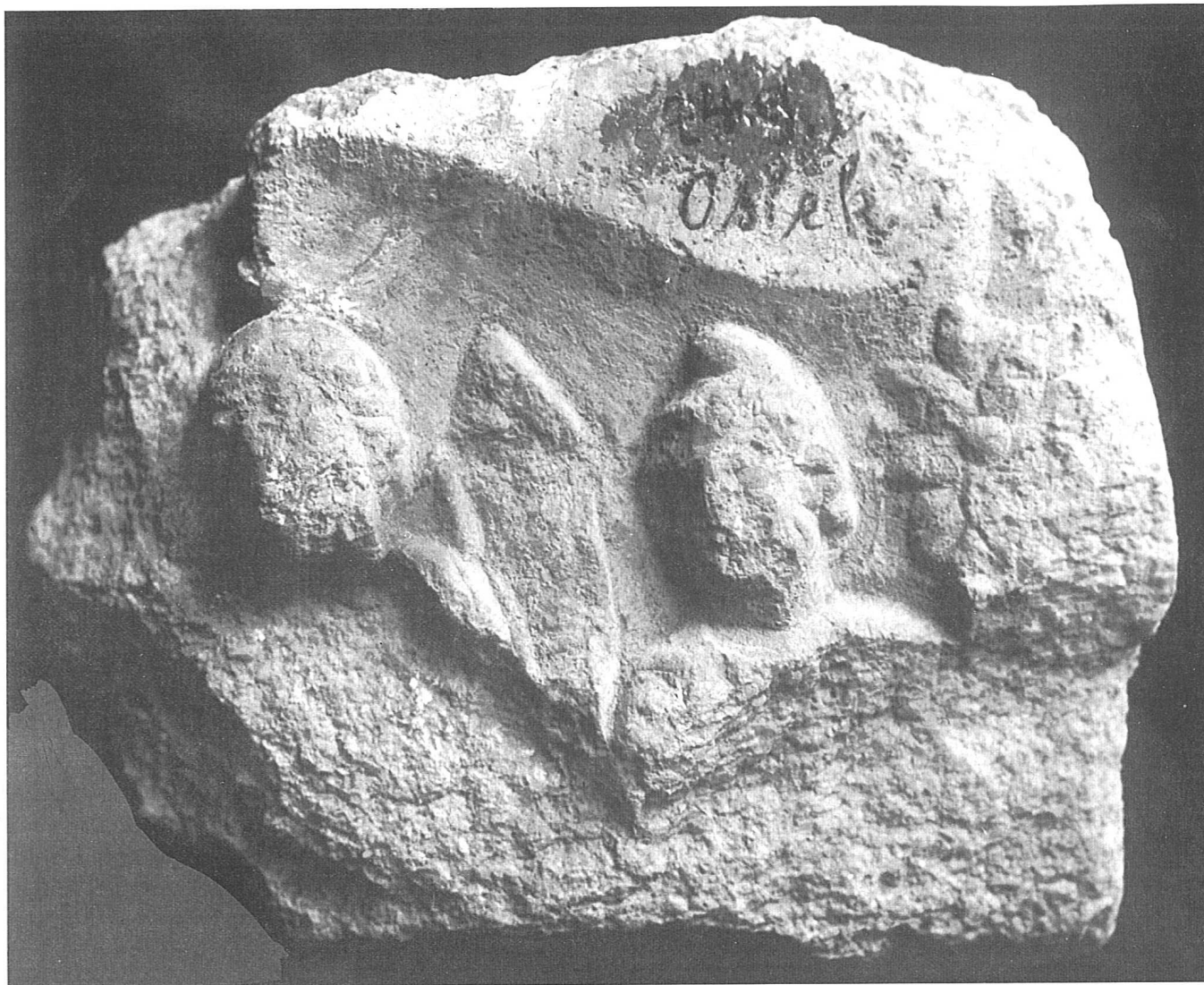
1. Ulomak mramorne ploče s ostacima reljefa

stoji životinja s razmjerno velikom glavom (ovca ili pas). U donjem polju vidi se s lijeve strane muška glava, en face, pokrivena, kako se čini, frigijskom kapom. I ona je isto tako istrošena i oštećena, pa se teško mogu razaznati pojedine crte; nismo sigurni za tragove bojenja. Njoj s desne strane, tik uz rub ploče, je uski vertikalni duguljasti predmet, možda identičan onom na prvoj pločici.