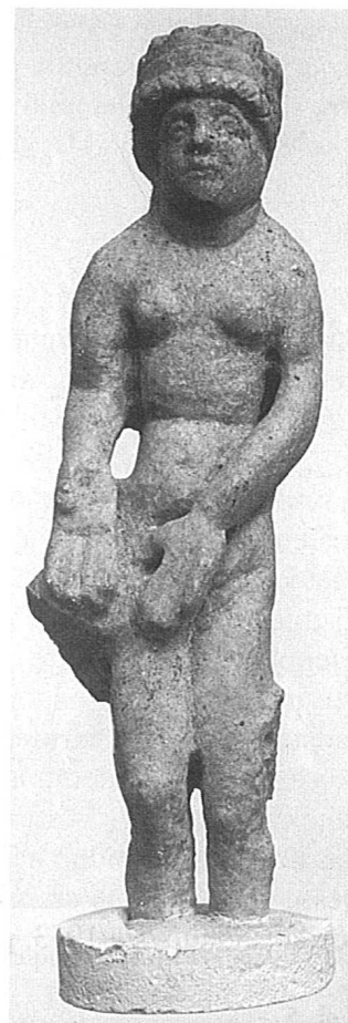
3. Figurica Venere - Afrodite od sivkastog mramora, en face

2. Na području Kalvarije 1898. godine nađeno, po Inventarnoj knjizi, i žensko poprsje od bijelog mramora, sa stiliziranom kosom pokrivenom velom, nabavljeno od J.Schmidta, koje je trenutačno nepristupačno, pa se ovdje ne uzima u obzir.