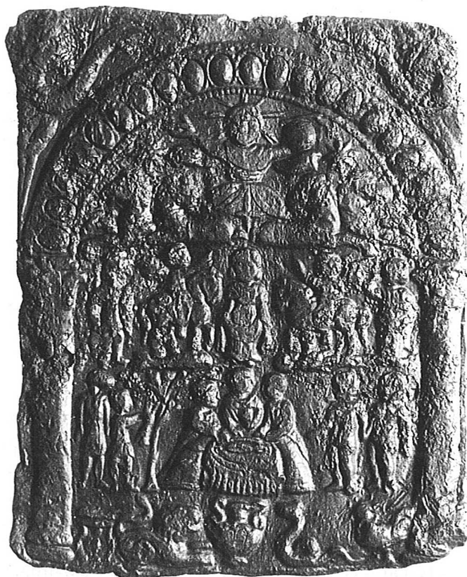
8. Olovna pločica podunavskih konjanika nakon čišćenja

8. Olovna pločica s prikazima podunavskih konjanika, tipa Dalj, varijante A (I. Iskra-Janošić 1966., 50), pačetvorinastog oblika, po sredini malo ispupčena. Reljefni prikaz u četiri zone nalazi se unutar polukružne edikule ukrašene astragalom,