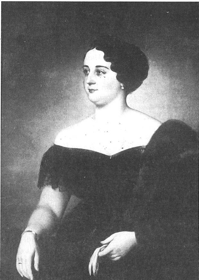
Portret grofice Sophie Schönbrunn - Wiesenthied, rođ. Eltz, 1846. godina

zatvorena do vrata i ukrašena zlatnim brošem na spoju čipkastog ovratnika u četiri sloja. Tamna kosa je u sredini, pada niz lice i skupljena je u potiljku. Preko tog gornjeg dijela pričvršćen je crni čipkasti transparentni ukrasni veo 7 . U krilu grofice sjedi mlado psetance.