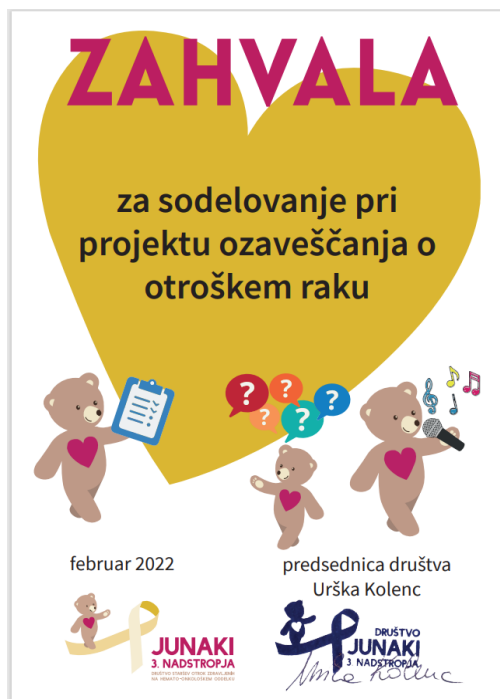
Slika 2: Zahvala društva Junaka s 3. kata

Kroz ovakve projekte tijekom nastave i školovanja djeca stječu dodatna znanja za život i to je prava svrha školovanja. Pored znanja, dijete mora stjecati i određene sposobnosti za život.