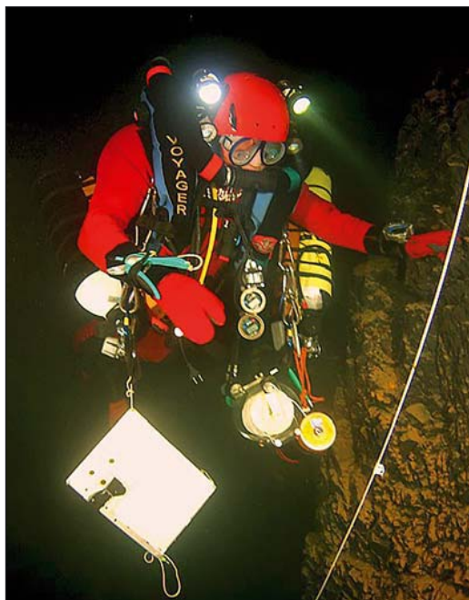
Lorenzo del Veneziano