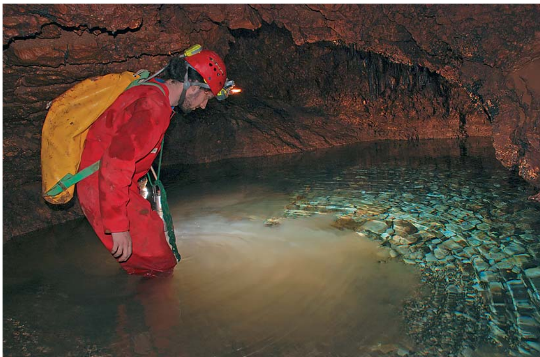
Jezerce u špilji Kotluši

1. kolovoza – petak. Uslijedilo je pakiranje opreme i rasporemanje logora. U logoru su ostali