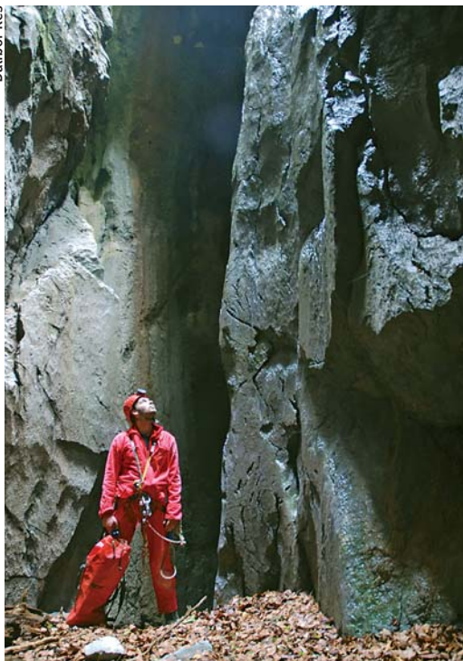
Polica u jami Disto