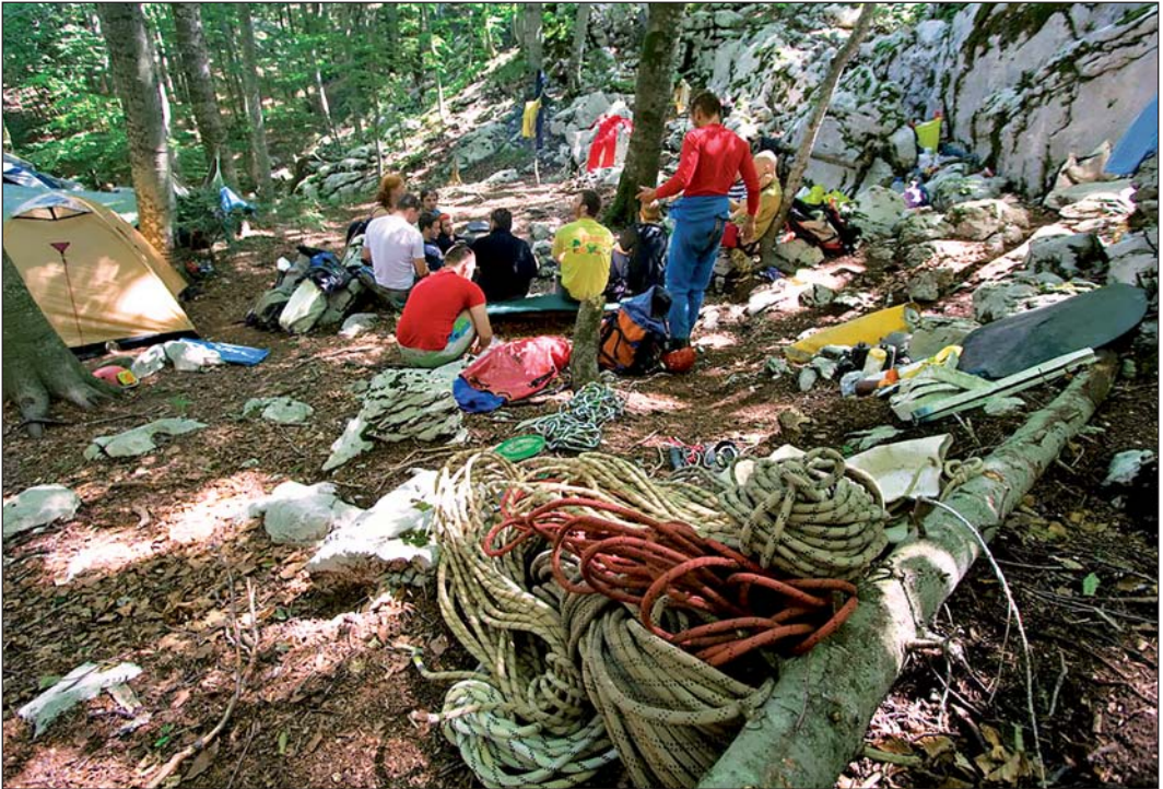
Odmor u logoru kod Jame vjetrova