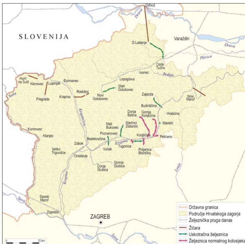
Sl. 1. Prostorni razmještaj željezničkih pruga prema vrstama na prostoru Hrvatskog zagorja

Iako se prostor Hrvatskog zagorja nije nalazio na prostorima zahvaćenim industrijskom revolucijom per se , već je bio na periferiji tih zbivanja promjene koje je industrija donijela bile su iznimno velike, a ogledale su se u zapošljavanju stanovništva te posljedično promjeni agrarnih pejzaža, izgradnji objekata za stanovanje, te ostalih uslužnih funkcija. Počeci industrijske proizvodnje vežu se u razvoj industrijske proizvodnje keramike na početku 19 stoljeća u zgradi Lovrec u Magistratskoj ulici u Krapini. Nakon toga započinje razvoj eksploatacije sumpora za čije rafiniranje se koristio smeđi ugljen vađen u Radoboju (KOZINA, D., 2007., KRKLEC-ŠVALJEK, V. 1998.). Godine 1845. pokrenuta je proizvodnja u Krapini, a 1885. godine pokrenuta je i industrijska proizvodnja (HRV-DAVŽ-SCKR 425). Do kraja 19. stoljeća otvaraju se rudnici u Ivancu (1874.), Novom Golubovcu (1875.), Starom Golubovcu (1876), Pregradi (1888.) i Gornjoj Konjščini (1890.) (Enciklopedija Hrvatskog zagorja, 2007., str. 865-866). Krajem 19. stoljeća s razvojem željeznice uslijedio je i relativno brz proces izgradnje novih industrija uz pravce novih željezničkih pruga. Tako je u Zaboku 1889. godine osnovana tvornica cigle i proizvoda od gline Zagorka (22), Godine 1893. u Đurmancu se otvara pilana, a 1920. u Krapini s radom započinje