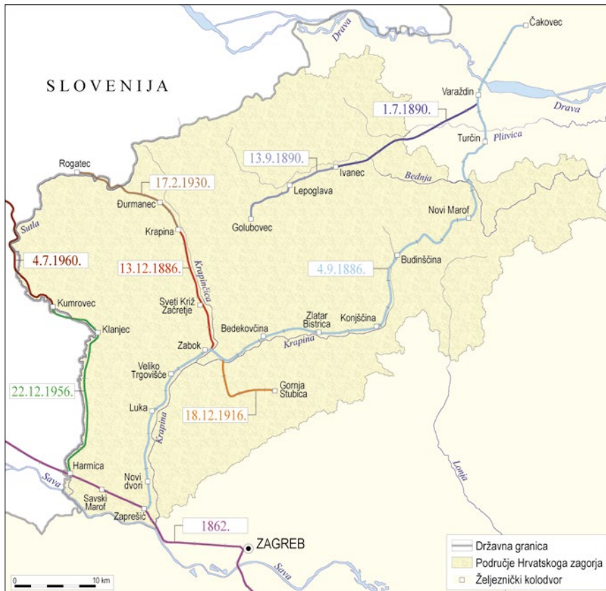
SI. 2. Prostorni razmještaj željezničkih pruga s kolodvorima na prostoru Grvatskog zagorja