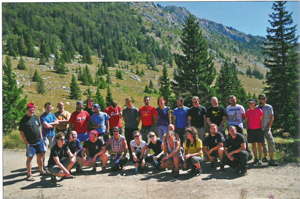
Sudionici prve predekspedicije

Logor je bio smješten u Velikom Lomu, nedaleko od ulaza u jamski sustav Lukina jama – Trojama. Budući da se na ulaznoj vertikali Lukine jame nalazio ledeni čep, jama je opremana kroz ulaz u Trojamu, koja se na oko -580 m spaja s Lukinom jamom. Jama je postavljena do bivka na -780 m, a užeta su preparirana i ostavljena da vise na sidrištima. Podignuta su dva bivka: na -350 m i -780 m; transportirani su ka-