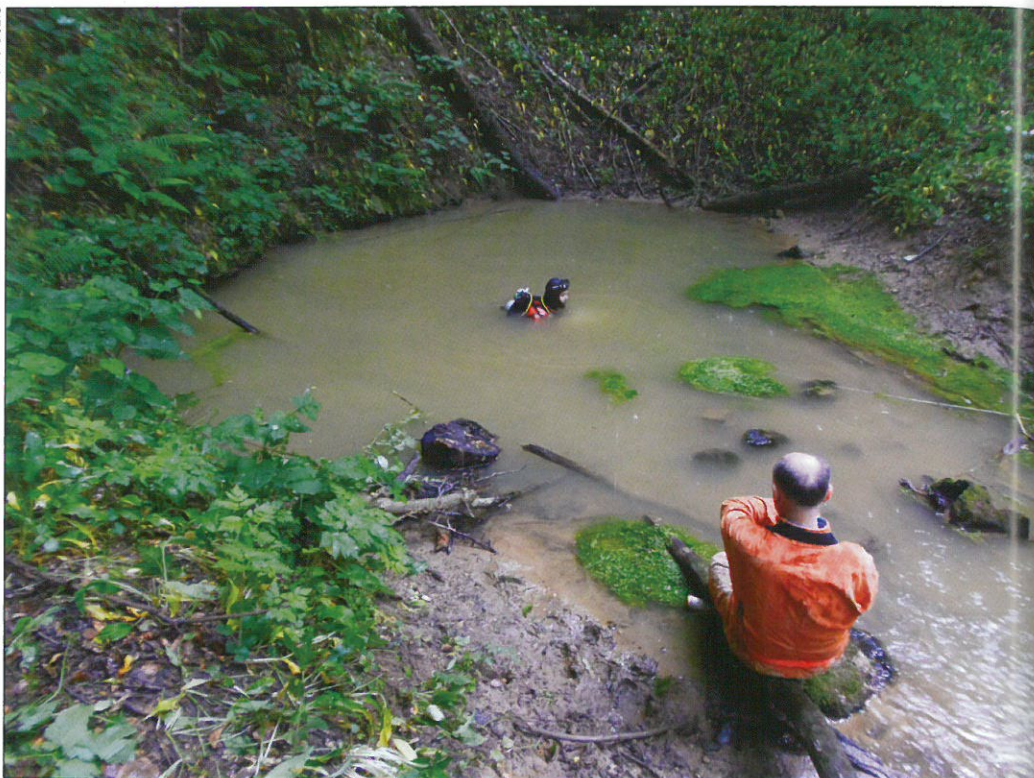
Zamućenje vrela nakon ronjenja