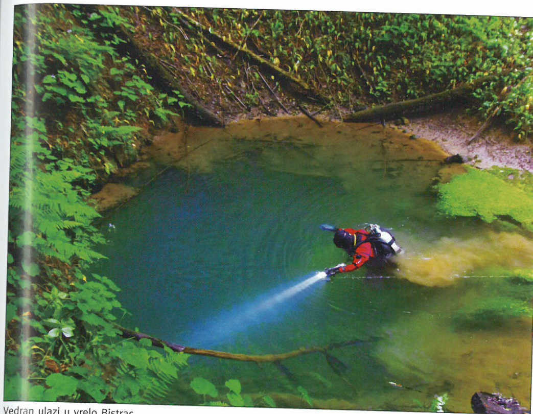
Vedran ulazi u vrelo Bistrac

će se potok zamutiti. U dogovoreno vrijeme nije se nažalost pojavio nitko osim nas speleologa.