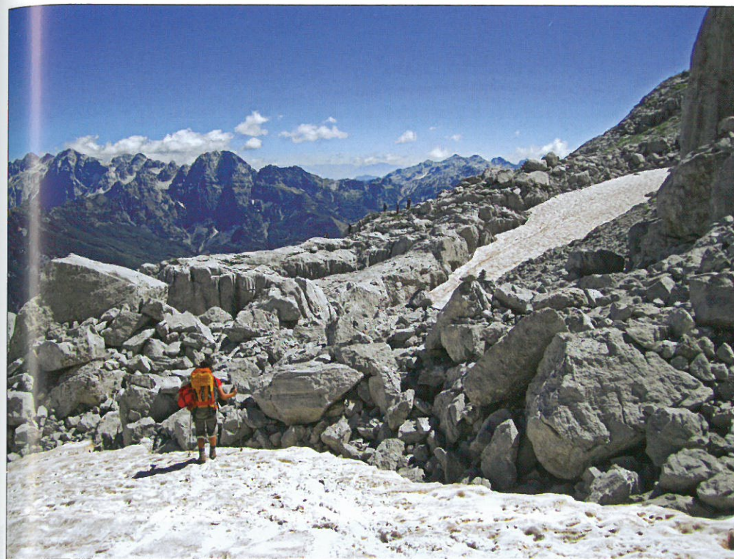
Na prilazu jami »Ru«

Nesporazum je ubrzo riješen, ali je dobrodošlica ostala na razini. I tako je propao još jedan slavni juriš naše ekipe. Nakon burne noći, u kojoj su neki od nas pokleknuli, pao je dogovor da ono što se dogodilo u Nikšiću ostaje u Nikšiću. Moramo odati počast momcima i djevojkama iz Nikšića, stvarno su si dali truda i priuštili nam nezaboravnu večer. Sljedećeg smo dana u noćnim satima stigli kući puni dojmova i uspomena, kojih ćemo se s veseljem sjećati. Nekako nam je svima ovo bilo nezaboravno putovanje, jer kad se sve zbroji i oduzme, stvarno nije moglo bolje proći.