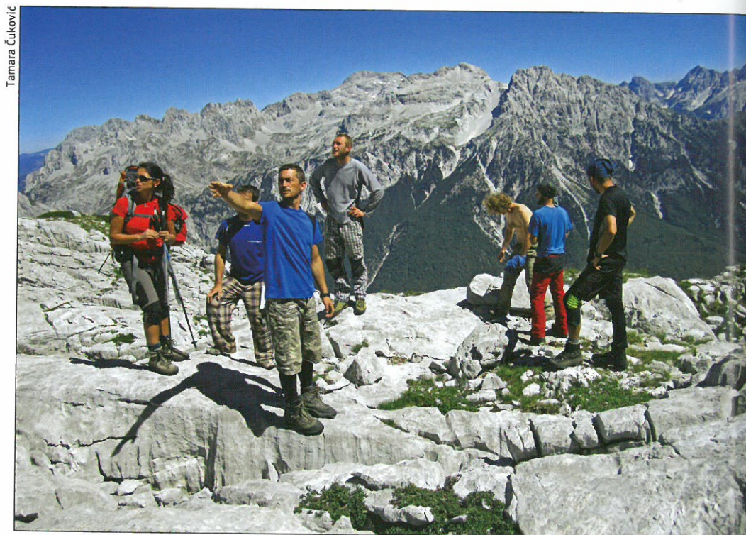
Put do jame Ru