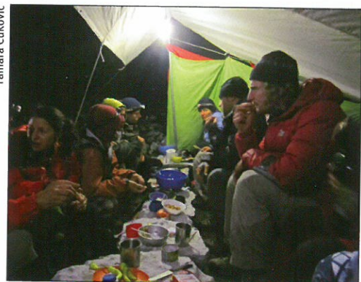
Večer u bugarskom logoru

Nesporazum je ubrzo riješen, ali je dobrodošlica ostala na razini. I tako je propao još jedan slavni juriš naše ekipe. Nakon burne noći, u kojoj su neki od nas pokleknuli, pao je dogovor da ono što se dogodilo u Nikšiću ostaje u Nikšiću. Moramo odati počast momcima i djevojkama iz Nikšića, stvarno su si dali truda i priuštili nam nezaboravnu večer. Sljedećeg smo dana u noćnim satima stigli kući puni dojmova i uspomena, kojih ćemo se s veseljem sjećati. Nekako nam je svima ovo bilo nezaboravno putovanje, jer kad se sve zbroji i oduzme, stvarno nije moglo bolje proći.