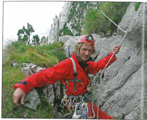
Slaven na ulazu u jamu

Sljedeći dan smo proveli istražujući visoravan iznad naše jame koja se nalazi na 2000 m visine. Pri povratku smo naišli na grupu Bugara koji su došli posjetiti »našu« jamu. Uz čašicu razgovora saznali smo da joj je ime Cilikokave te da je duboka 505 m. »A što ste mislili, da ste Ameriku otkrili?« rekao nam je Bugar nudeći rakiju. Također su nam pokazali nakapnicu među