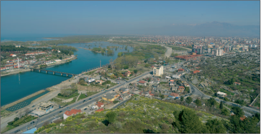
Pogled s Rozafe na grad Skadar

sličnoga našem. Putem nam je pokazivao smjerove gdje je koja država i govorio nam koliko dana hoda ima do koje granice. Kao radnik sve je to prolazio pješice.