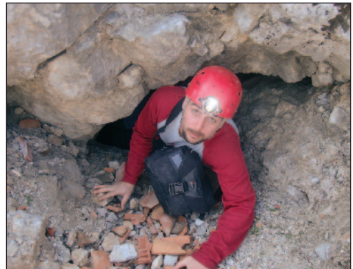
Ulaz u špilju Špelu

Prošli smo kroz Crnu Goru, zastali u Petrovcu na ručku, došli do granice, imali malih nespozazuma s papirima, no uspjeli smo i to nekako riješiti te smo konačno krenuli ka Skadru i samostanu u nedalekom Hajmeliju. Uz nekoliko krivih skretanja i pomoću GPS-a domogli smo se i samostana u rane večernje sate. Pokucali smo,