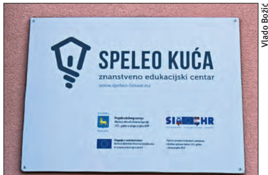
Podsjetnik da je Speleo kuću u Vodicama financirala EU

Svi su se sudionici okupili u Speleo-kući u petak, gdje su navečer održana prva predavanja. Sutradan je najprije ispred zgrade pregledan pribor za mjerenje i crtanje i tečajci su podijeljeni u 5 skupina, a zatim im je na otvorenom prikazano mjerenje azimuta, nagiba i duljina. Potom su svi autima otišli u selo Lanišće, udaljeno dvadesetak km, do špilje zvane Mačeha, gdje su tečajci uz pomoć instruktora mjerili i crtali špilju. Predvečer, nakon povratka u Vodice, sređivali su svoje nacрте, i onda se svi odvezli u selo Jelovice (udaljeno 6 km) na večeru. Nakon večere su u Vodicama održana još dva predavanja. Cijelo nedjeljno prijepodne posvećeno je konačnoj izradi speleološkog nacрта na klasičan način, a održano je i predavanje o kasnijoj digitalizaciji