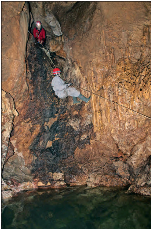
Prelaz jezera pomoću prečnice