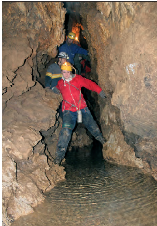
U kanalu špilje Veternice između Plaže i slapa Viktorija

kroz sljedećih 5 vikenda. Teorijski je dio ove godine malo upotpunjen s nekoliko dodatnih predavanja vezanih uz umjetne speleološke objekte i onečišćenja podzemlja, a bila je predstavljena i speleološka ekspedicija u Maleziju i Borneo kao praktičan primjer organizacije speleološkog istraživanja u inozemstvu. Dio predavanja održali su i gostujući predavači iz SO-a Velebit te SK-a Ozren Lukić, s dvojakim ciljem osiguravanja najveće moguće kvalitete edukacije, ali i promoviranja suradnje s ostalim speleološkim društvima među budućim speleolozima pripravnici.