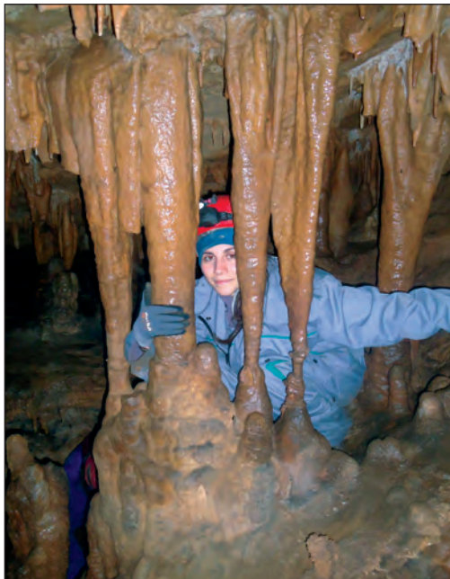
Iza rešetke - u Velikoj špilji kod Klane