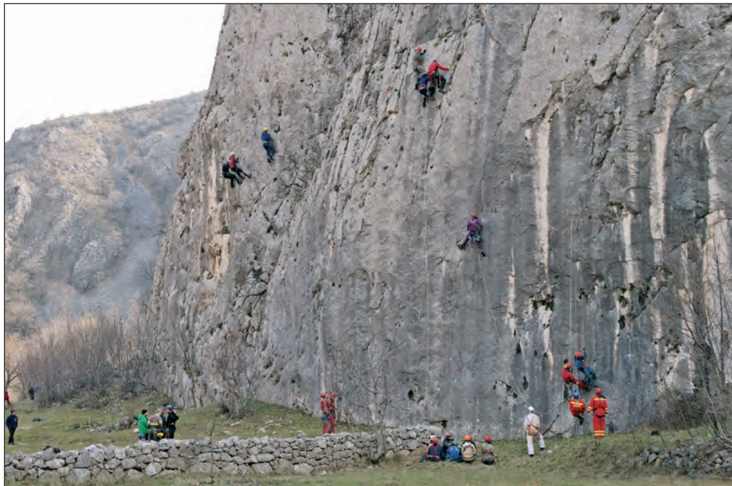
Vježba penjanja na Paninom kuku u kanjonu Zrmanje

Terenski dio započeo je, tradicionalno, vikendom na zagrebačkoj gori Medvednici. Kroz prvi susret s Veternicom, a potom i »zastrašujućom« stijenom Gorskog zrcala, budući pripravnici su napokon dobili sliku za što su se u stvari prijavili. Gacanje po vodi do Plaže, zavirivanje u Pakleni kanal, konfuzija Pakla i »opuštanje« na 10 milimetara najlona 20-ak metara od tla – po završetku su sve nedoumice nestale, uz tek jedno odustajanje. Uspjeli smo tog vikenda postići i novi rekord u napučenosti naše najbliže špilje - naime, uslijed preklapajućeg rasporeda, školarci Željezničara i Velebita