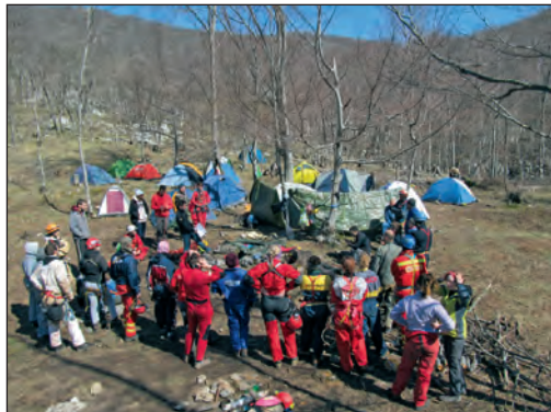
Dogovor pred odlazak u jame

tradicionalnom Crnopcu. Nastavljajući uspješan koncept od prethodne godine, završni terenski ispit pripremljen je kao simulacija istraživanja, pri čemu je svaka skupina, koju je sačinjavao jedan instruktor te dva ili tri školarca, imala određenu zadaću - postavljanje linija za napredovanje, pripremu bivka, uspostavljanje telefonske veze s površinom, bio-speleološko istraživanje, raspoređivanje i transport bivka te raspremanje samoga speleološkog objekta. Ove godine su radi efikasnosti školarci razdvojeni u dvije skupine - jedna je prije spomenuti koncept isprobavala u obližnjoj Jami vjetrova, dok su se spremniji školarci uputili put našeg najvećeg speleološkog objekta - Kite Gaćešine. Vremenski uvjeti nisu nas mazili tako da je završni ispit uistinu pokazao školarcima sve „radosti“ speleologije. Hladan vjetar, kiša, tuča, slapovi, smrzavanje na užetu, gužva u bivku – isprobali su sve vožnje u lunaparku, a nadobudniji su tražili i kartu više.