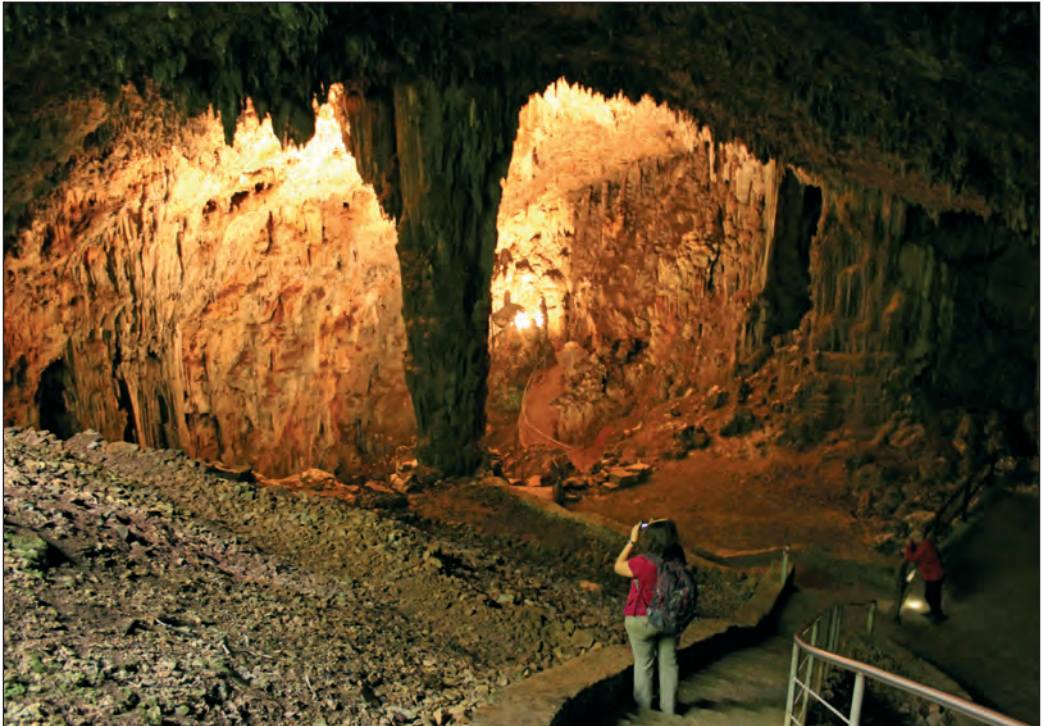
Ulazna dvorana Planinske špilje