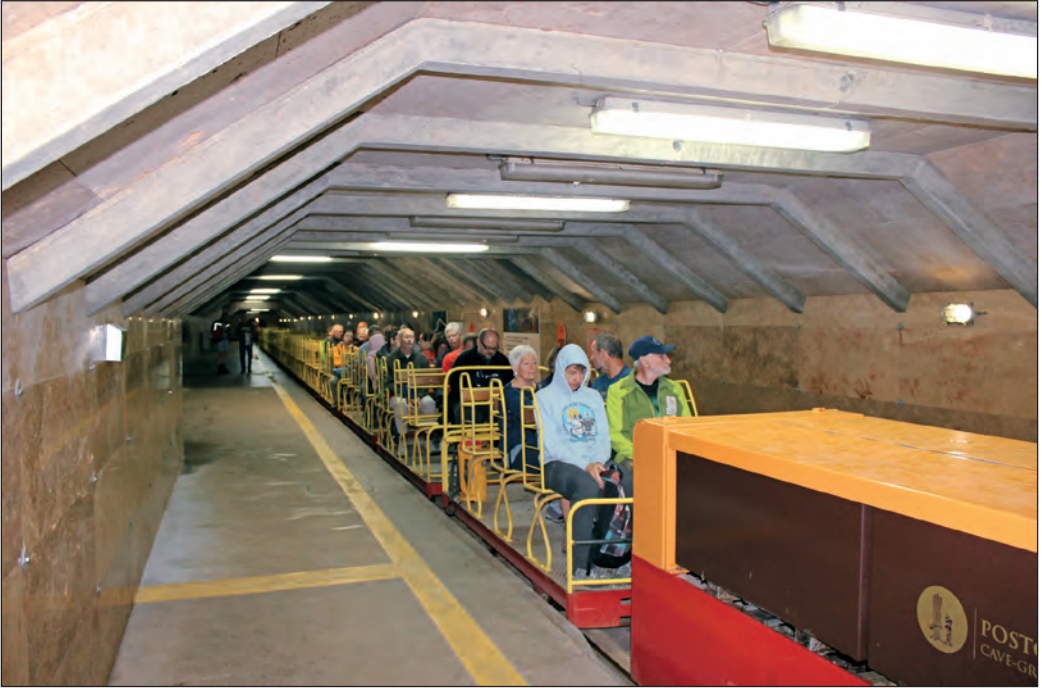
Kolodvor u Postojnskoj špilji, pokraj Koncertne dvorane

Nakon popodnevni predavanja skup je okončan. Službeni jezik skupa bio je engleski.