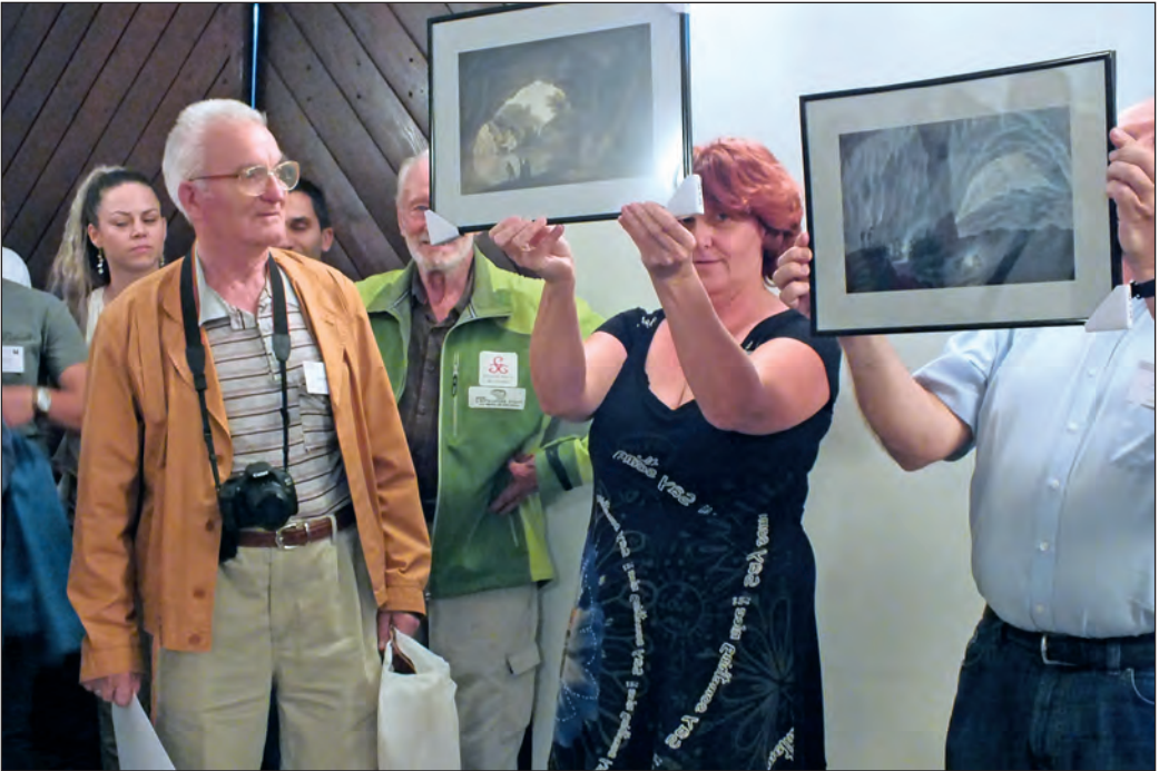
Predaja poklona (2 slike) hrvatskih speleologa organizatorima Skupa

je tema bila speleologija bio održan u Budimpešti 1927. godine, a na njemu je sudjelovalo i 5-6 predstavnika iz Hrvatske (još se istražuju imena tih predstavnika). Ronjenje u špiljskom sustavu Postojnske špilje počelo je 1954. godine, i to ronjenjem u prvom sifonu rijeke Pivke. Ronila su dva Hrvata, jedan iz Pule a drugi iz Splita, oba ronionci iz tamošnjih brodogradilišta. Zaronili su