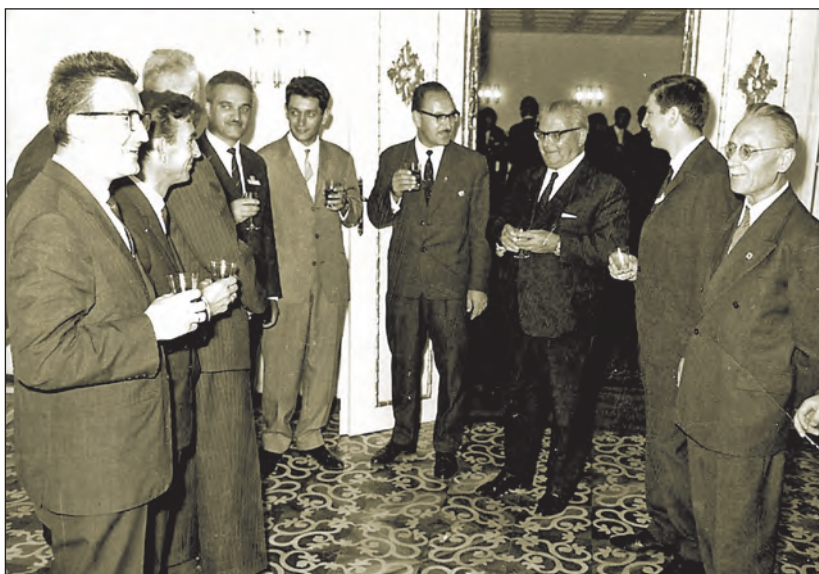
Dio sudionika iz Hrvatske u Ljubljani nakon osnivanja UIS-a, 16.9.1965.