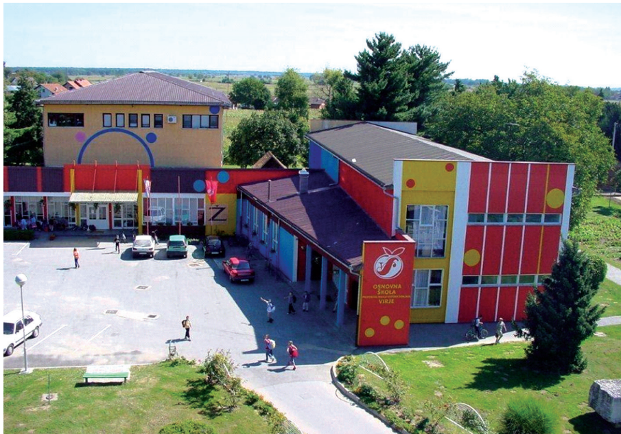
Slika 3. Zgrada nove škole u Virju izgrađene 1971., a dograđene i uređene 1999. godine.

Projektни zadatak adaptacija je zgrade od podruma do tavanskih prostorija kako bi se dobila jedna funkcionalna cjelina. Ukupna vrijednost projekta iznosila bi 11.350.867,48 kuna s PDV-om. U te bi se prostore smjestila vinoteka, dvorana za prezentacije i promociju proizvoda domaćih OPG-a, proširio prostor mjesne knjižnice i Zavičajni muzej Virja, multimedijaska dvorana za kino, koncerte, priredbe i predavanja, galerija, prostor za umjetničke radionice, radio stanicu i druge sadržaje. Sada valja čekati da pro-