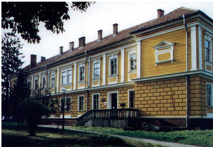
Slika 1. Školska zgrada krasotica izgrađena 1894. godine danas.

stva uz potporu tadašnjega predstojnika Odjela za bogoštovlje i nastavu doktora Izidora Kršnjavija. Dr. Izidor Kršnjavi (Našice, 1845 - Zagreb, 1927.), hrvatski je slikar, povjesničar umjetnosti, književnik i političar. U Beču je studirao povijest i povijest umjetnosti. Kao član mađaronske Narodne stranke biran je za narodnog zastupnika i od 1891. do 1895. godine bio je predstojnik Vladinog Odjela za bogoštovlje i nastavu. Obnavljao je crkve, gradio škole, osnivao galerije i društva. U suradnji s biskupom Štrosmayerom i arhitektom Hermanom Bolleom odigrao je ključnu ulogu u pojavi klasicizma (neoromanička Đakovačka katedrala) i historicizma u Hrvatskoj. Zahvaljujući njegovom maru, izgrađene su brojne poznate zgrade u Zagrebu kao trajni spomenici njegovih nastojanja na području kulture (Glazbeni zavod Zagreb, dovršetak Hrvatskog