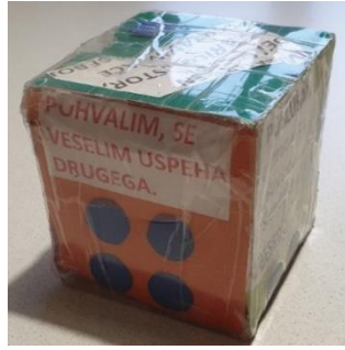
Slika 1: Kocka prijateljstva