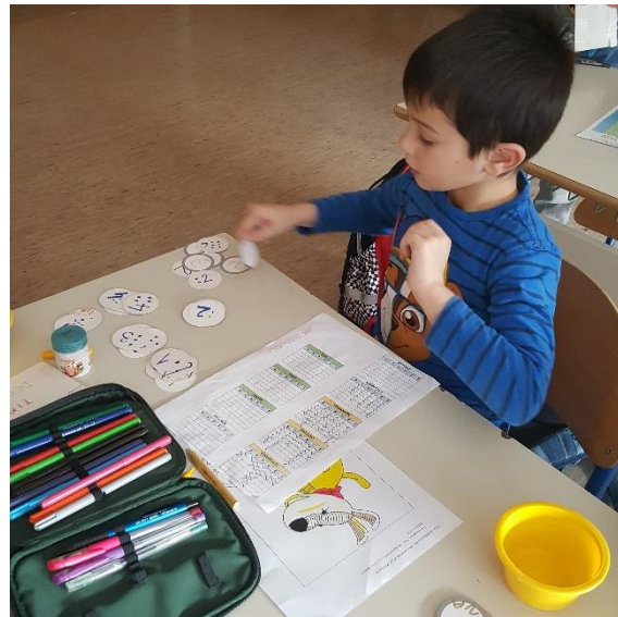
Slika 3: Učenici označavaju mjesečni broj novčića (lijevo) i broj novčića koje su sakupili za svaki broj točaka (desno).

Na kraju mjeseca zanimalo nas je i koliko smo novčića s pojedinim brojem točaka sakupili svi zajedno, kao razred.