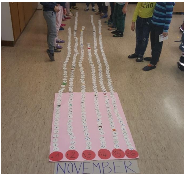
Slika 4: u studenome su učenici sakupili najviše novčića s dvije točke (88). To znači da su u tom mjesecu najviše vježbali pristojno sjediti na nastavi i trudili se biti uporni, čak i kad im je bilo teško.

Na kraju mjeseca zanimalo nas je i koliko smo novčića s pojedinim brojem točaka sakupili svi zajedno, kao razred.