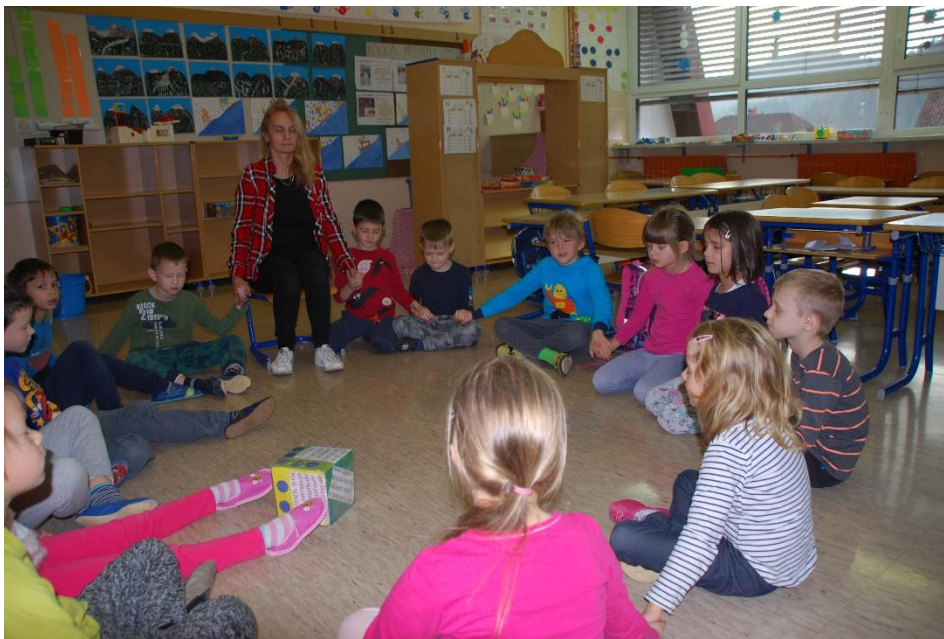
Slika 2: Jutarnji krug s kockom prijateljstva

Nastavili bismo igrom „Električni impuls” i jedni druge osjetili laganim stiskom dlana. Nakon toga uslijedio je taj žarko željeni trenutak u kojem bi učenik koji je taj dan bio na redu bacio kocku prijateljstva.