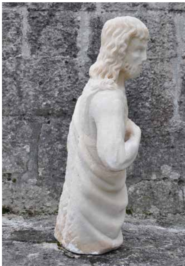
6., 7. Skulptura sv. Ivana Krstitelja, lijeva strana poledine i desna bočna strana Statue of St John the Baptist, left side of the back and right side

tanki štap s križem na vrhu koji, nažalost, nije sačuvan, dok desnom, savijenom u laktu, prstom upire u nj. 20 Dupojasno predočeni stojeći lik svetca prilagođen je formatu kamenog bloka i smještaju unutar plitke lunete glavnog portala, pa tako visinom doseže nešto ispod bokova i nagnut je prema naprijed, a jedva primjetan naklon njegove glave prati i okret udesno, što za sobom povlači laganu torziju čitavog tijela. Stražnja strana mramornog bloka je sumarno, a dijelom i prilično grubo obrađena. Na samoj skulpturi zamjetna su veća površinska oštećenja, i to upravo na prednjoj strani koja je u najvećoj mjeri i bila izložena djelovanju atmosferilija – od šećerastog osipanja površinskog sloja, potom manjih pukotina do gubitka materijala, a uočljive su i kromatske promjene u strukturi mramora. Osim vrha nosa, izgubljeni su i brojni, inače vrlo precizno i suptilno naznačeni anatomske detalji. To se ponajviše vidi na ogoljeloj i žilama prošaranoj podlaktici savijene desne ruke i pruženom kažiprstu, kao i na isturenim dijelovima lica koje s donje strane uokviruju kratki, sada gotovo podrezani i stopljeni pramenovi brade.