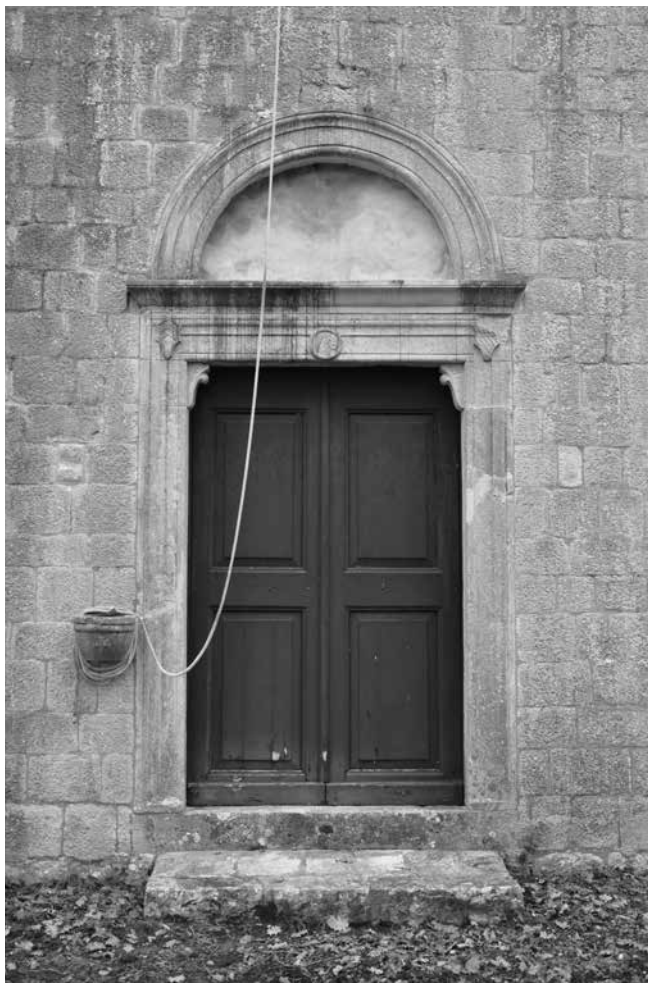
2. Crkva sv. Ivana Krstitelja na predjelu Šilovo Selo, glavni portal

Church of St John the Baptist in the area of Šilovo Selo, main portal