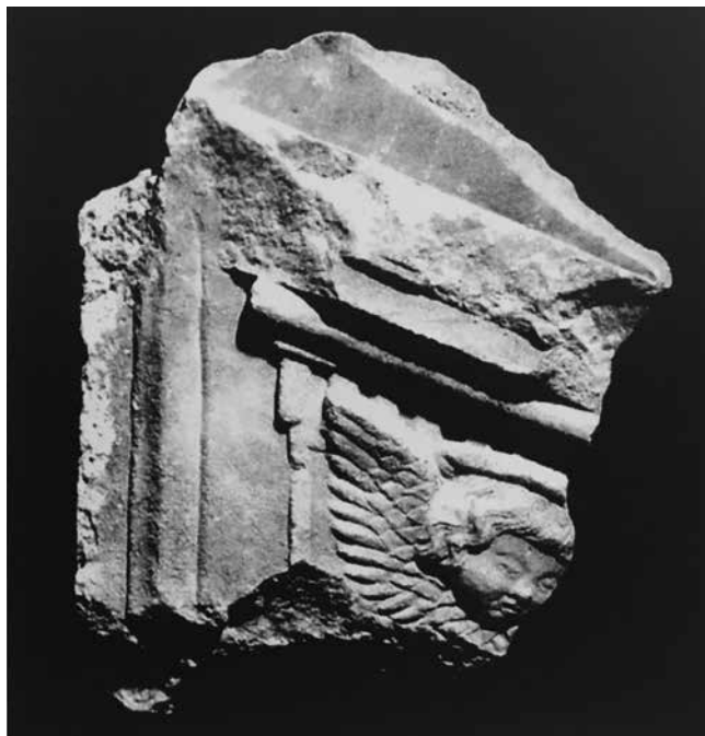
12. Ploča iz Arheološkog muzeja u Dubrovniku, stražnja i prednja strana

Plaque from the Archaeological Museum in Dubrovnik, back and front