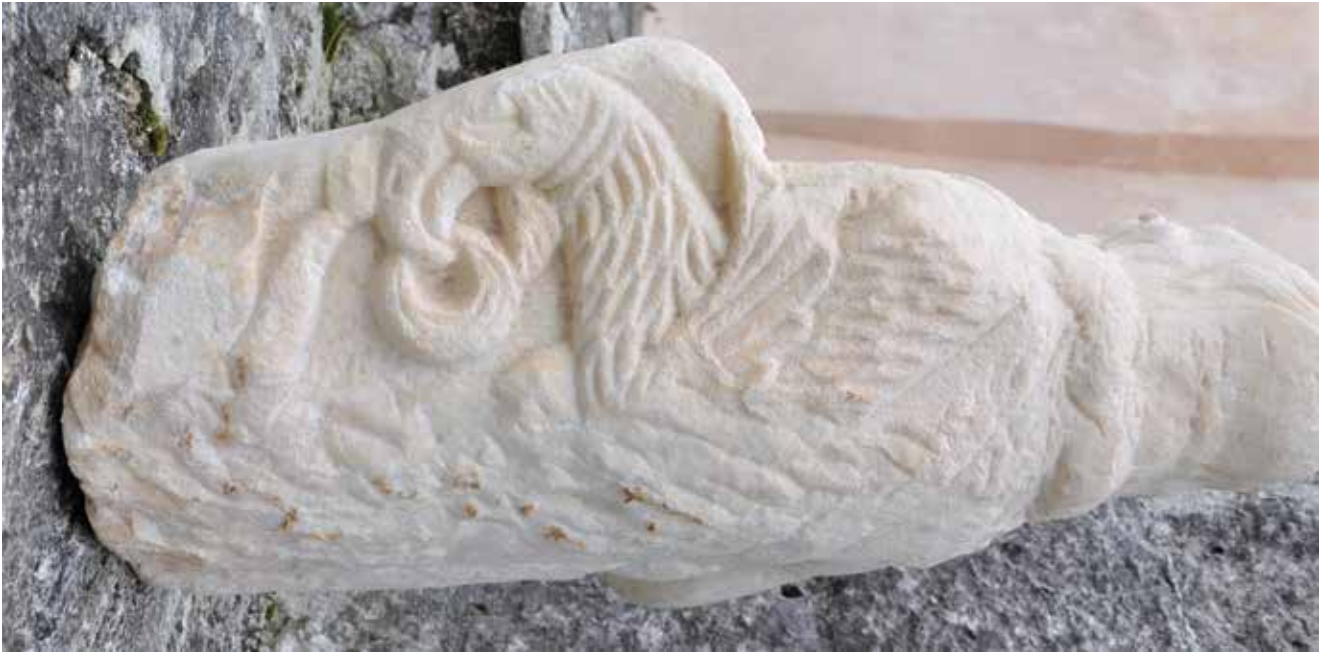
10. Reljef orla, poledina skulpture sv. Ivana Krstitelja (foto: Predrag Marković, 2021.) Relief of an eagle, back of the statue of St John the Baptist