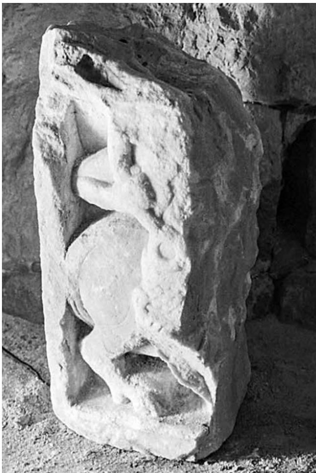
11. Greda iz katedrale u Dubrovniku