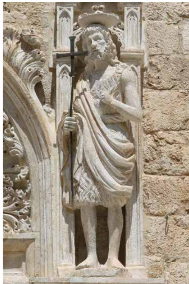
9. Leonard i Petar Petrović, skulptura sv. Ivana Krstitelja, južni portal franjevačke crkve u Dubrovniku

Statue of St John the Baptist, front, detail