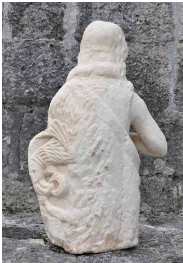
4., 5. Skulptura sv. Ivana Krstitelja, prednja strana i poledina (foto: Predrag Marković, 2021.) Statue of St John the Baptist, front and back

interpretiranih “rimskih” profilacija all’antica , zamjećujemo određene nedosljednosti i nespretnosti, a koje bi mogle upućivati na svojevrsno nerazumijevanje izvornog predloška i/ili na slabije zanatsko umijeće klesara koji ih je izradio. 17 Tako, primjerice, na okvirima nisu isklesane uobičajene tri plitke stepenasto poredane trake nego jedna, pri čemu je ta, plitka S traka na krajevima dovratnika jednostavno prekinuta, točnije nema onog karakterističnog “obrata” kakav inače nalazimo u uglovima nadvratnika, pa je završni prijelaz napravljen samo jednom plitkom kosinom. Također, izostaju uobičajeni denti između nadvratnika i vijenca, a obli štapa koji obrubljuje svijetli otvor na glavnom portalu malo je većih dimenzija i prežitak je starijega, gotičkog motiva. Stoga čini se da takva interpretacija “klasične profilacije” troslojno raslojenog arhitrava, s tankim oblim štapovima na stepenastim prijelazima, odaje ruku majstora koji je došao u dodir s novim, renesansnim, oblikovnim rješenjima, ali ih je prilagodio “tradicionalnom” shvaćanju dekorativnih oblika. Za lunetu glavnog portala u Šilovu Selu bila je izrađena i renesansna skulptura s likom titulara crkve – sv. Ivana Krstitelja. U drugoj polovini 20. stoljeća skulptura je premještena u unutrašnjost crkve, a ondje je i danas pohranjena. 18 Premda se radi o vrsnijemu