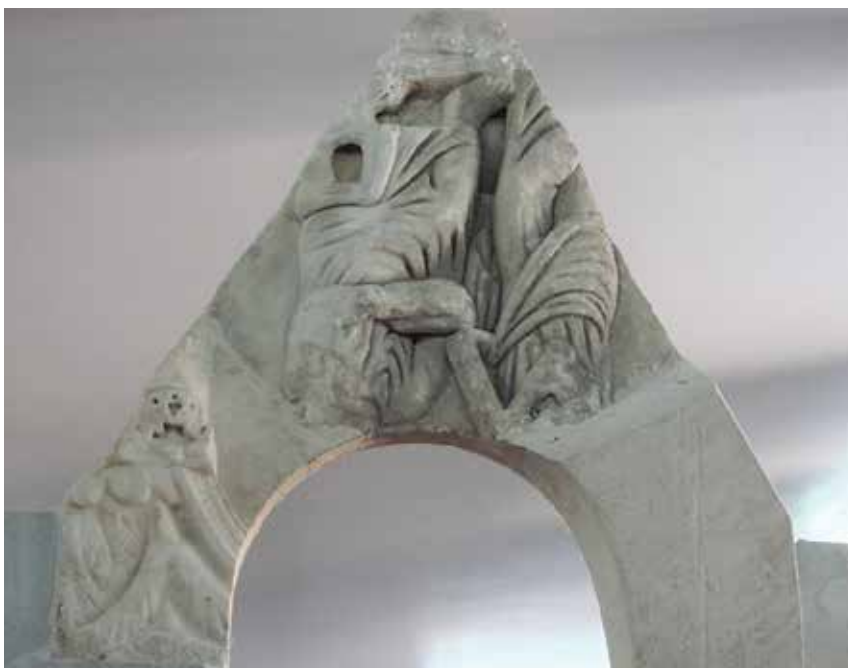
13. Zabat oltarne ograde iz crkve sv. Mihajla na otoku Koločepu, prednja strana

Gable of the altar rail from the church of St Michael on the island of Koločep, front