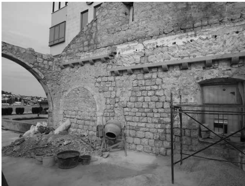
5. Unutrašnjost lođe tijekom recentne obnove Interior of the loggia during the recent renovation works

rane impostne zone luka sačuvane, i ulazi u prizemlju imaju naznačene impostne zone, no danas se na njihovom mjestu nalaze novija vrata pravokutnog oblika. Za razliku od lođe i glavnih ulaza koji su polukružno zaključeni, prozori u zoni kata imaju šiljate gotičke lukove, uklopljene unutar pravokutnih okvira. Premda je ovakvo heterogeno oblikovanje otvora u duhu tzv. »mješovitoga« gotičko-renesansnog vokabulara tipično za arhitekturu palača i vila druge polovice 15. i prve polovice 16. stoljeća, za koju je karakteristično supostavljanje gotičkih prozora i renesansno oblikovanih lođa ili trijemova, potrebno je arhivskim istraživanjem utvrditi vrijeme i faze gradnje sklopa Kaboga-Zec, prije nego što se kombinacija stilski različitih otvora pripiše integralnome projektu.