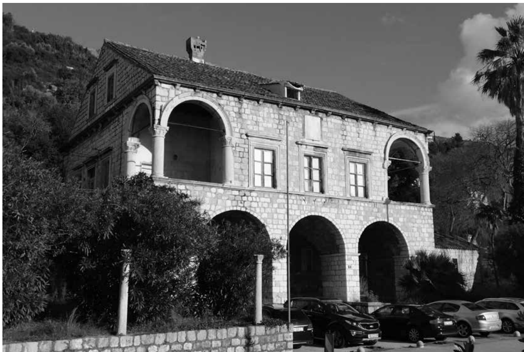
6. Ljetnikovac Sorgo-Natali Villa Sorgo-Natali