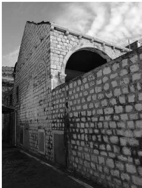
4. Djelomično zazidana ugaona lođa kompleksa Kaboga-Zec Partially walled corner loggia of the Caboga-Zec complex