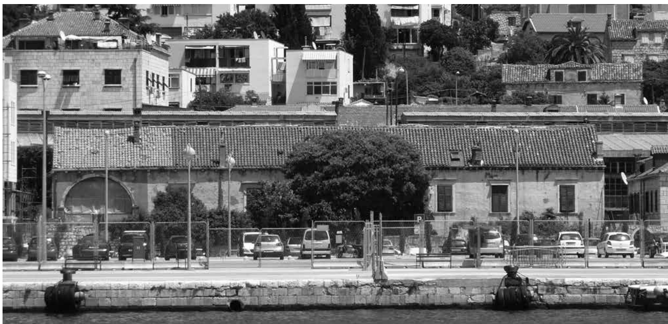
2. Pročelje kompleksa Kaboga-Zec prije recentne obnove (Registar kulturnih dobara Republike Hrvatske, br. reg. RST-1210) Front façade of the Caboga-Zec complex before the recent renovation works

otvora, pa čak i iznimke poput palače Isusović-Braichi ili same Sponze zadržavaju raskošniju inačicu – triforu s postranim monoforama. Nasuprot tome, pročelja ljetnikovaca koja nisu bila ograničena skućenošću prostora, razvijaju raspored centralne trifore sa po dvije bočne monofore kakav, primjerice, susrećemo na ljetnikovcima Bunić-Gradić u Gružu, Bunić-Kaboga na Batahovini ili onome Petra Sorga na Lapadu. Raspored s biforama kakav nalazimo na nacrtu sklopa Kaboga-Zec ipak se ne bi trebao smatrati sažetom