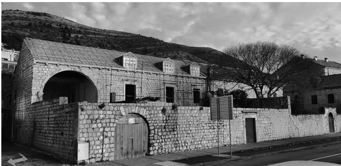
3. Pročelje kompleksa Kaboga-Zec tijekom recentne obnove Front façade of the Caboga-Zec complex during the recent renovation works

inačicom rasporeda s po dvije bočne monofore, budući da nisu ekvivalentne u tlocrtnom rasporedu. Naime, bočne bifore sklopa Kaboga-Zec odgovaraju bočnim prostorijama prvoga kata, a kod navedenih ljetnikovaca samo vanjski par monofora odgovara bočnim prostorijama, dok se unutarnji par nalazi u centralnoj dvorani. Široka, polukružnim lukom zaključena lođa na zapadnom kraju pročelja jedini je otvor do danas sačuvan u obliku u kojem je prikazan na crtežu. Poput lođe, kod koje su profili-