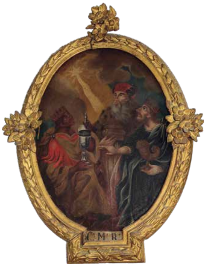
7. Sveti Ivan Zelina, župna crkva sv. Ivana Krstitelja, slika Sveta tri kralja, neznani slikar, 1726. godine

Sveti Ivan Zelina, parish church of St John the Baptist, painting of the Holy Magi, anonymous painter, 1726