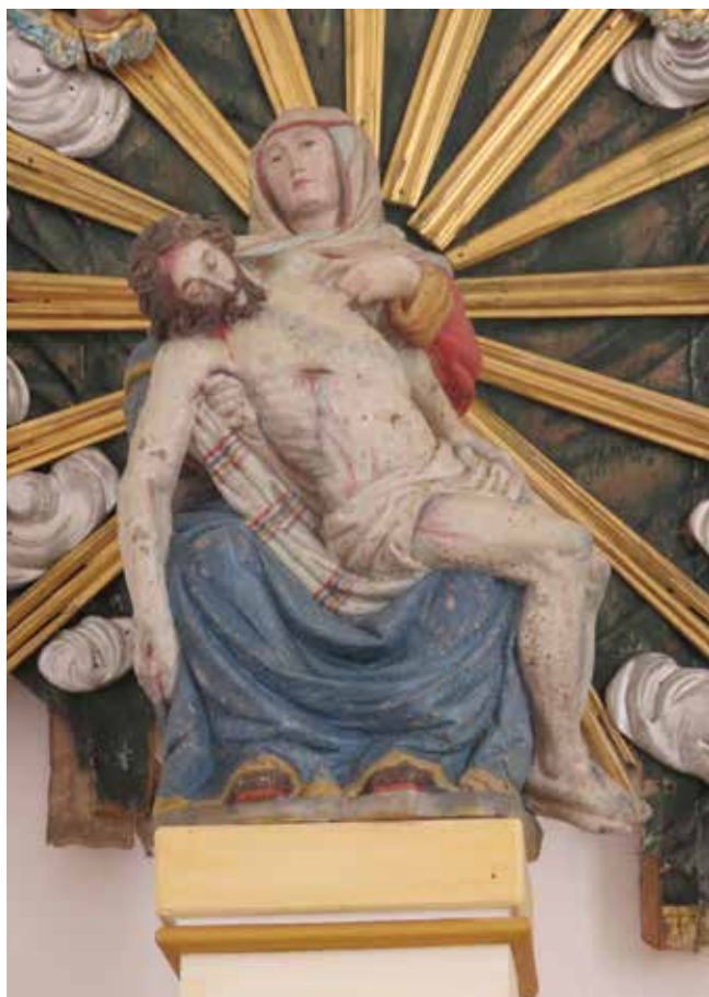
5. Vetrnica, crkva Majke Božje Žalosne, skulptura Bogorodice Sućutne na glavnom oltaru, Ivan Jakob Altenbach, oko 1680.

Vetrnica, church of Our Lady of Sorrows, statue of Our Lady of Compassion on the high altar, Ivan Jakob Altenbach, ca. 1680