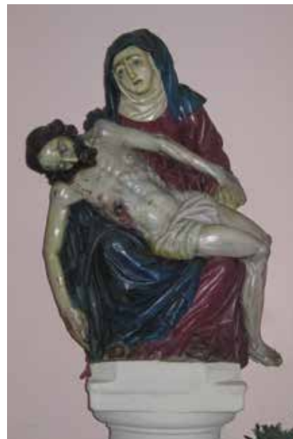
4. Gradec, župna crkva Ranjenog Isusa, skulptura Bogorodice Sućutne, Ivan Jakob Altenbach, 1678. Gradec, parish church of the Wounded Jesus, statue of Our Lady of Compassion, Ivan Jakob Altenbach, 1678