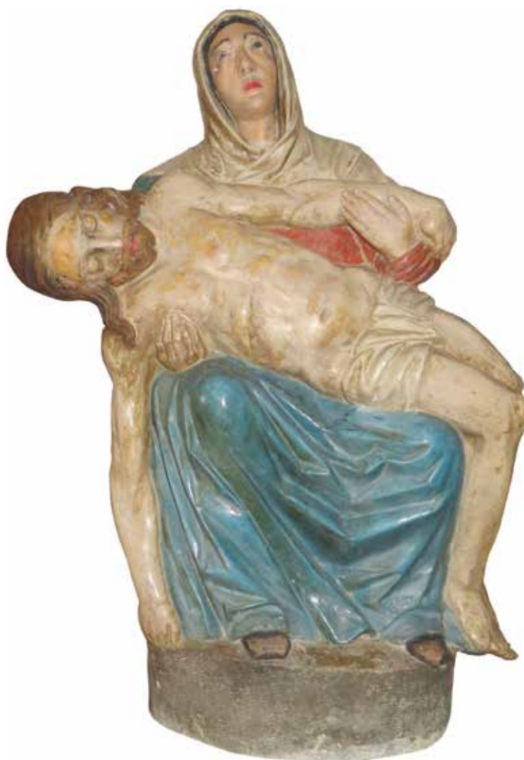
1. Sveti Ivan Zelina, župna crkva sv. Ivana Krstitelja, skulptura Bogorodice Sućutne, neznani kipar, kraj 17. stoljeća Sveti Ivan Zelina, parish church of St John the Baptist, statue of Our Lady of Compassion, anonymous sculptor, late 17 th century

ispod kojih se naziru samo koljena i stopala, a nabori vela i ogjavlja padaju oko vrata i na ramena te mreškajući se uokviruju Bogorodičino ovalno lice. Na njezinu se licu ispod naglašenih lukova obrva ističu krupne oči bolnoga pogleda usmjerenog prema nebu, između kojih je širi nos, punašne usne i okrugla brada. Kristovo tijelo ukoso je položeno na majčino krilo, a postrance mu nemoćno padaju noge i desna ruka koja svojom klonulom gestom tijesno prati liniju Marijinih potkoljenica. Njegovo nago tijelo pojednostavljene je modelacije bez akcentiranih anatomskih detalja, a oko prepona mu je prebačena kratka perizoma izbrazdana naborima. Blago opuštena Kristova glava zaokružena je gustim, pravilno usječenim pramenovima kose naglašenoga linearizma te kratkom bradom.