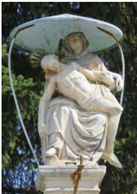
2. Biškupec, pil Bogorodice Sućutne, Ivan Jakob Altenbach, 1671. Biškupec, column of Our Lady of Compassion, Ivan Jakob Altenbach, 1671