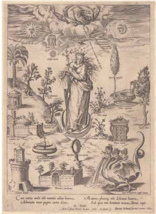
6. Cornelis Cort, Bogorodica s Djetetom i simbolima, Rim, 1567., izdavač Antonio Lafréry

Cornelis Cort, The Virgin with Child and Symbols , Rome, 1567, published by Antonio Lafréry