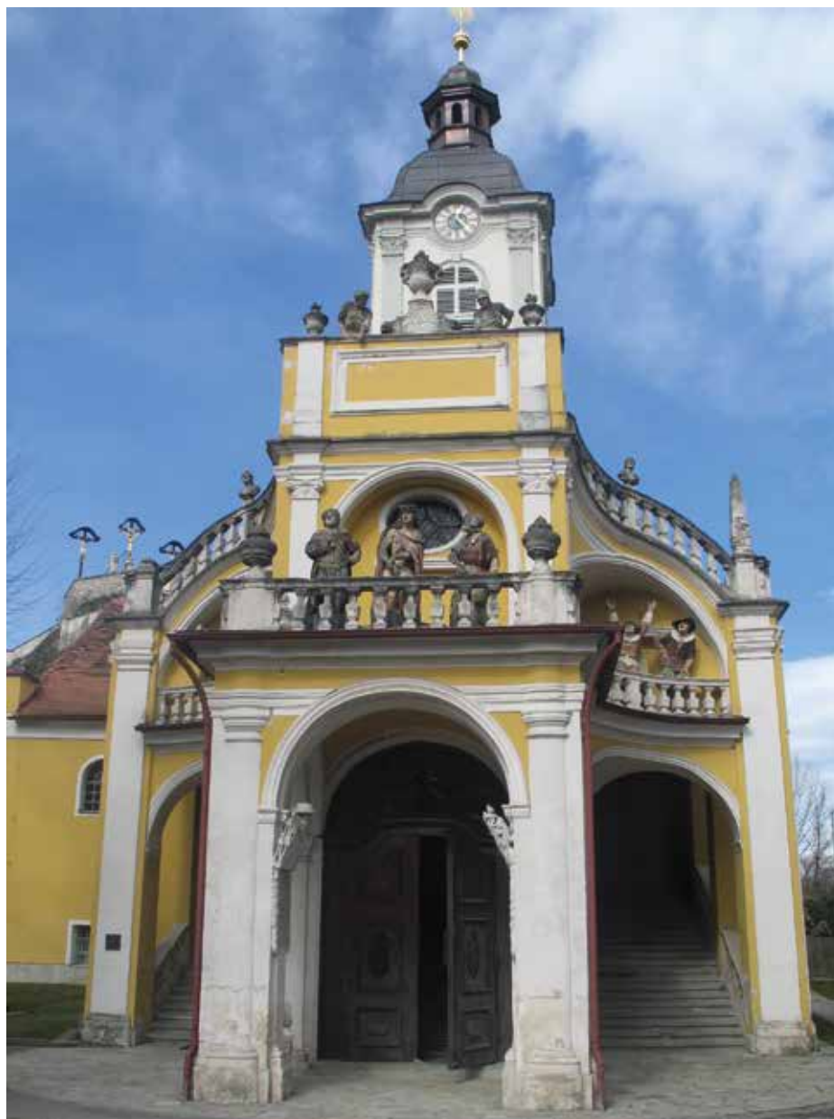
8. Graz, Kalvarienberg, Heilige Stiege , Johann Georg Stengg (?), 1718. – 1723. godine

Graz, Kalvarienberg, Heilige Stiege , Johann Georg Stengg (?), 1718–1723