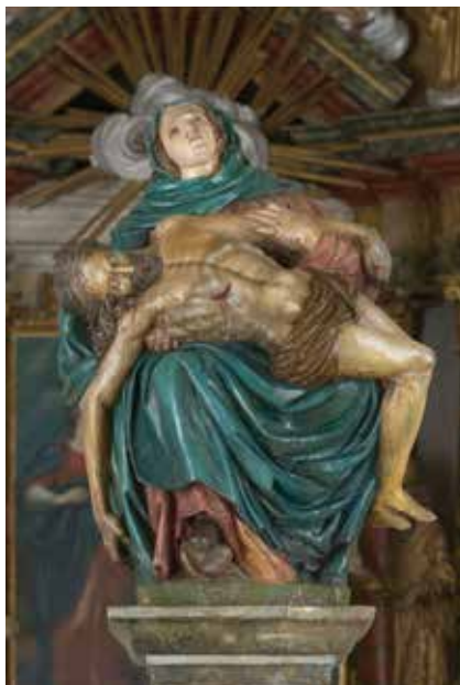
3. Križevci, crkva Majke Božje Koruške, pil Bogorodice Sućutne, Ivan Jakob Altenbach, 1674. Križevci, church of Our Lady of Koruška, column of Our Lady of Compassion, Ivan Jakob Altenbach, 1674