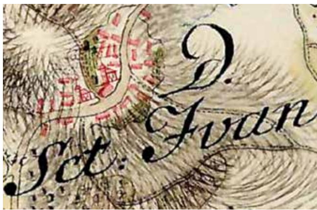
10. Sveti Ivan Zelina na jozefinskoj karti 1783. godine (izvor: Hrvatska na tajnim zemljovidima 18. i 19. stoljeća: Zagrebačka županija , /ur. Mirko Valentić – Ivana Horbec – Ivana Jukić/, sv. I, 2009.)

Sveti Ivan Zelina on a Josephine map from 1783