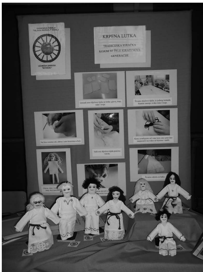
Slika 1. Krpene lutke – izložba na Županijskoj smotri učeničkih zadruga Karlovačke županije

poslužila im je kao inspiracija za odjeću koju će lutke nositi. Dijelovi tijela lutke krojeni su od tkanine, šivani ručno i punjeni vatom. Oči, nos i usta izrađeni su tehnikom veza na platnu, a kosa je napravljena od vune. Učenici su uživali u svakoj fazi rada. Odlično su reagirali na učenje krojenja, šivanja i veza na platnu. Kako je ova aktivnost neobvezna, nisu svi radili sve, već je svaki učenik radio ono u čemu je dobar i čemu može poučiti druge. Rezultat njihovog rada je obitelj lutaka, koja se sastoji od sedam članova (baka i djeđ, mama, tata i troje djece).