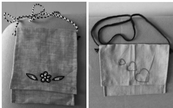
Slika 2. Torbice za mobitel i tablet

Nakon toga učenici su istraživali kakve su školske torbe nosili njihovi preci koji nisu imali udžbenike ni bilježnice, već samo pločice za pisanje. Male zadrugare je pločica podsjetila na tablet pa su odlučili sašiti torbice za tablet i mobitel. Izradili su ih po uzoru na tradicijsku školsku torbu u kojoj su naši predci nosili pločice za pisanje. Torbicu su ručno sašili, ispleli remen od vune te ukrasili vezom na platnu i zašili perlice.