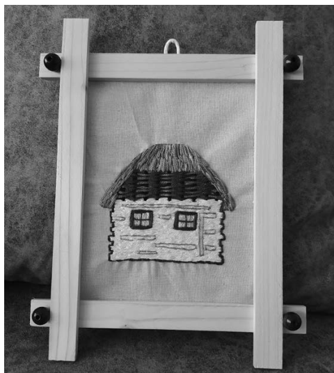
Slika 4. Tradicijska kuća ozaljskoga kraja – vez na platnu