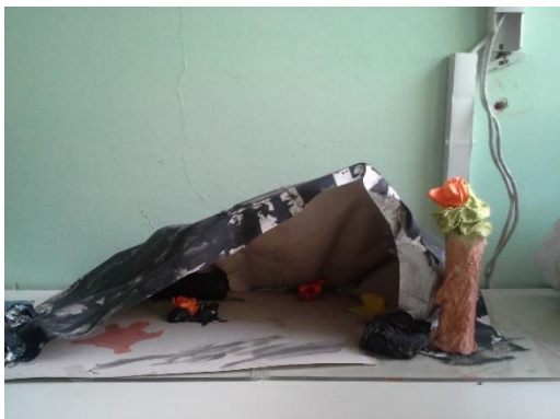
Slika 1: Prapovijesno razdoblje: špilja