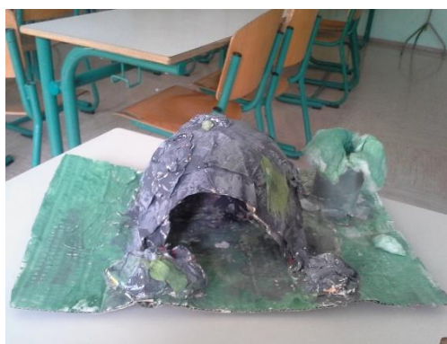
Slika 2: Prapovijesno razdoblje: špilja