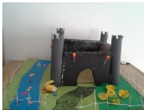
Slika 4: Srednji vijek: dvorac