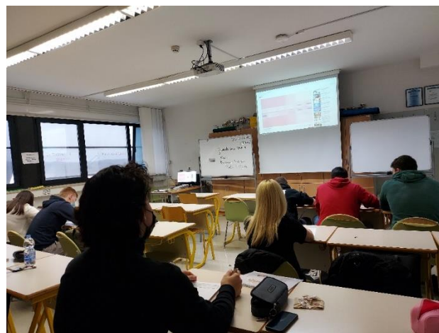
Slika 3: Učenika tijekom aktivnosti