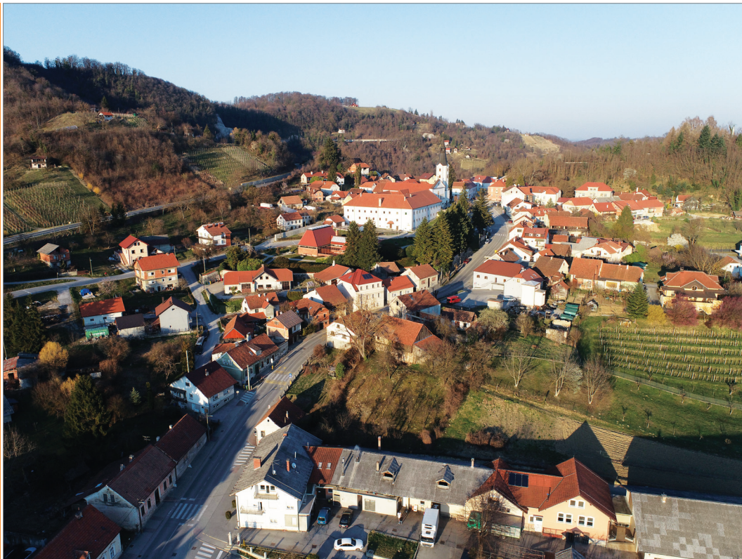
Sl. 2 Grad Klanjec