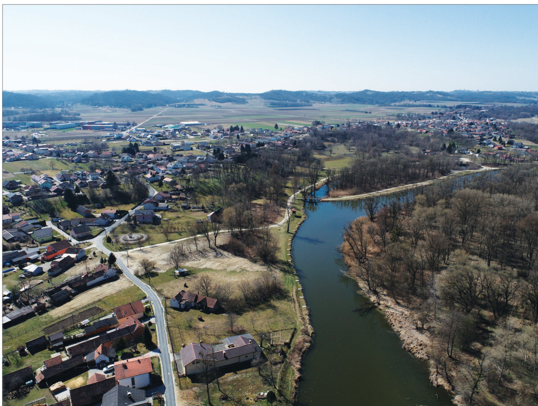
Sl. 3 Općina Sveti Martin na Muri

imala parcela. Općina je prostornim planom definirala želje, potrebe i mogućnosti, urbanistički uredila zonu i odradila administraciju. Privatni investitori su zatim otkupili zemljišta i izgradili svoje hale. LAG ističe kako je u Međimurju izgrađen velik broj gospodarskih zona u koje je uloženo i puno novaca, no iste su polupopunjene ili gotovo prazne, dok je u slučaju općine Sveti Martin na Muri lokalna politika intenzivno privlačila investitore, te je brzom administracijom, uređenom infrastrukturom i suradnjom s poduzetnicima uspjela osigurati rast zone. Zona djeluje od 2005. godine i kasnije je proširena. Veličine je 220.000 m 2 , od kojih je 140.000 m 2 izgrađeno i u funkciji. U zoni djeluju tvrtke ponajviše metalske djelatnosti te