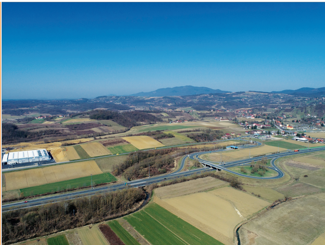
Sl. 5 Općina Breznički Hum

Općina Breznički Hum nalazi se na važnom međunarodnom prometnom pravcu Budimpešta – Varaždin – Zagreb – Rijeka, a dodatni značaj općina je dobila dobivanjem izravnog priključka (čvor Breznički Hum) na autocestu A4 prema Zagrebu i Goričanu. Smještaj i prometni položaj dodatno su poboljšani položajem općine na državnoj cesti D3 između dva velika grada, Zagreba (40 km) i Varaždina (25 km). Kao i u slučaju ostalih zagorskih općina, a sukladno prirodno-geografskoj osnovi i zemljišno-katastarskim razlozima (prosječna veličina parcela je 0,3 ha), poljoprivreda je pretežito ekstenzivnog i autarkičnog tipa, a tla su pogodnija za vinograde i voćnjake. Na području općine registrirana su 232 poljo-