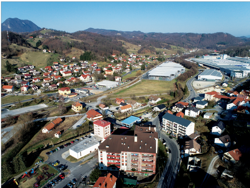
Sl. 4 Općina Hum na Sutli

i udoline. Općinu Hum na Sutli čini osamnaest naselja s ukupno 4608 stanovnika (DZS, 2021). U centru općine i najvećem naselju, Humu na Sutli, živi petina stanovništva (964). U zadnjem međupopisnom razdoblju općina Hum na Sutli smanjena je za 452 stanovnika (indeks promjene 91,1), a i općinsko središte zabilježilo je pad od 132 stanovnika. Blagi rast zabilježila su ipak Humu na Sutli susjedna naselja Lastine i Vrbišnica.