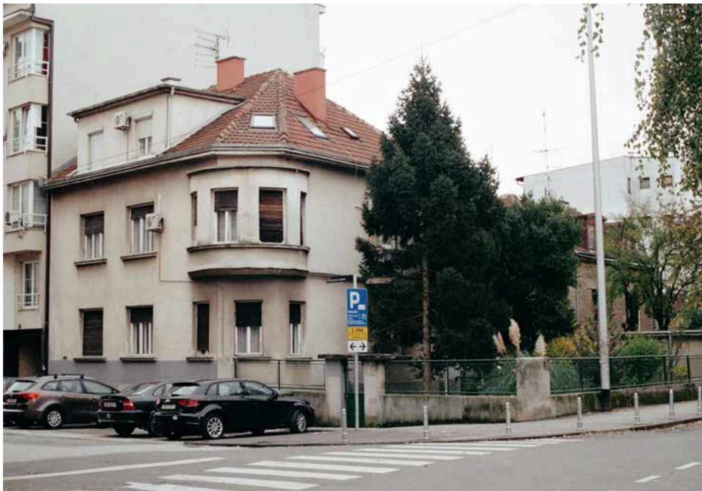
Kuća Miletić-Braut u jesen 2014.