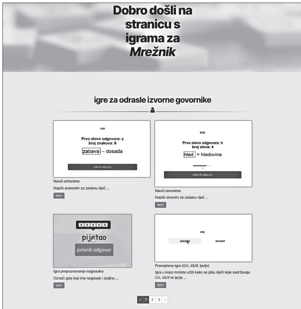
4. slika: Prikaz stranice s igrama za Mrežnik

Stranica s igrama ima sličan dizajn kao stranica rječnika te je napravljena kako bi se lakše razvrstale te pronašle igre izrađene na temelju određenoga rječničkog sadržaja.