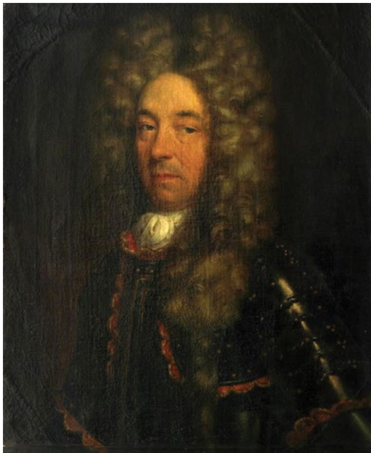
1 Nepoznati francuski slikar, Portrait of François-Louis-Joseph du Mont , 18. stoljeće, ulje na platnu, 65,2 × 54,3 cm, Strossmayerova galerija starih majstora HAZU, inv. br. SG-313

Ipak, u većini su slučajeva vlasništvo nad svojim dvorcima plemićke obitelji zadržale do kraja Drugog svjetskog rata, nakon čega je u poratnom