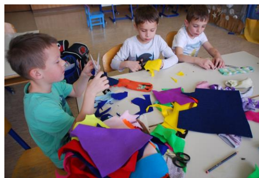
Slika 5., 6. Učenici izrađuju grad iznad koraljnog grebena i ribice od čarapa.

Od čarapa, koje su učenici donijeli od kuće, napravili smo ribice. Glavna riba Alba izrađena je od kartona. Postavili smo pozornicu za našu dramatizaciju.