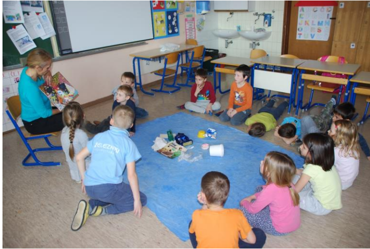
Slika 2. Učenici pažljivo slušaju priču.

Usljedila je emotivna stanka. Već tijekom pripovijedanja primijetila sam pojedine učenike kako su se uživali u ulogu ribe Albe. Sretan završetak priče donekle ih je smirio. Međutim, slijedila su pitanja: