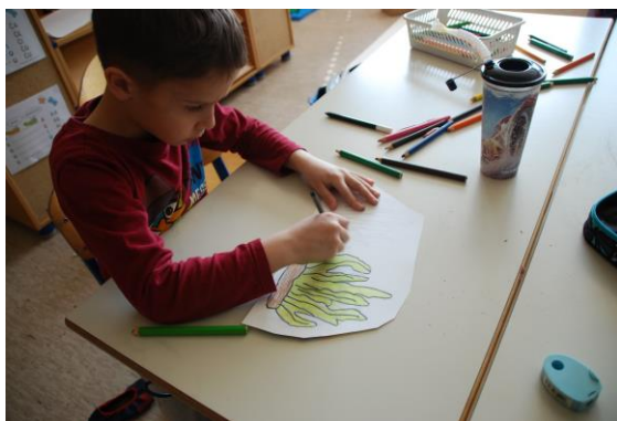
Slika 3. Učenik boji maketu koralja.