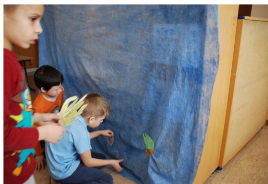
Slika 4. Učenici lijepe izrađene koralje na tkaninu.

Grupa učenika napravila je grad: kućice iznad obale oslikali su voštenim bojama, a vjetrenjače su nacrtali za iskorištavanje energije vjetra.