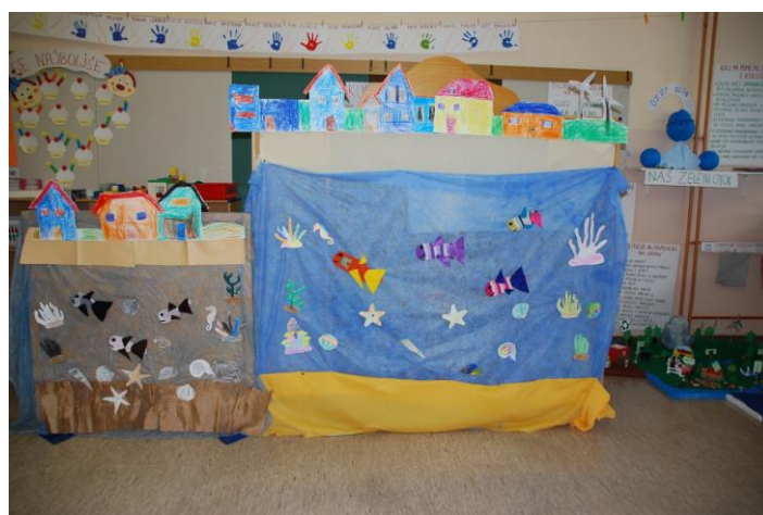
Slika 7. Učenici su postavili pozornicu za dramatizaciju.

Od čarapa, koje su učenici donijeli od kuće, napravili smo ribice. Glavna riba Alba izrađena je od kartona. Postavili smo pozornicu za našu dramatizaciju.