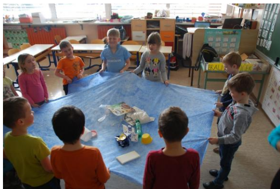
Slika 1. Učenici prikazuju morske valove dok slušaju glazbu.

Učenike pozovem da legnu na pod, zatvore oči i prepuste se glazbi – zvukovima morskih valova (sami pogađaju što su slušali). Sljedeći put prepuštaju se valovima koji ih pomiču gore-dolje – učenici pokretima ilustriraju kako valovi pomiču njihova tijela. Tijekom „valova“ svi zajedno držimo plavu ceradu koja prikazuje more te je spuštamo i podižemo kao da se radi o morskim valovima. Na ceradu polako odlažem otpad (otpadnu ambalažu, limenke, plastični pribor, čaše, plastične vrećice...).