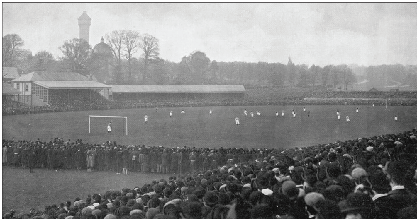
Finale FA kupa 1897. godine između Aston Ville i Evertona