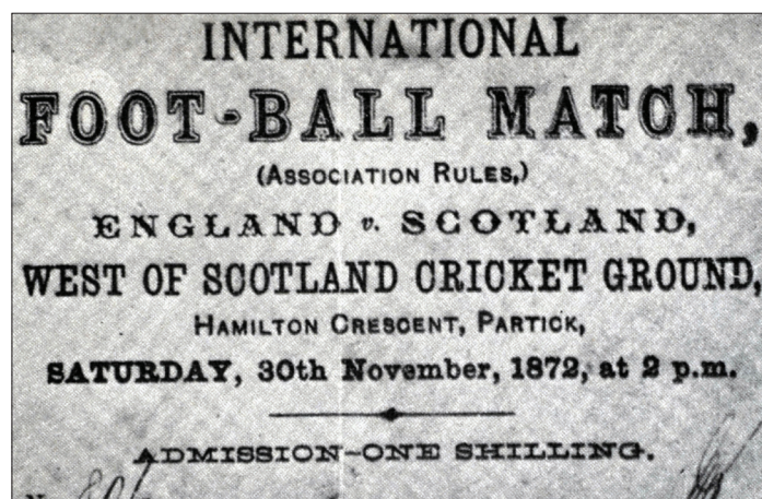
Ulaznica za prvu priznatu međunarodnu utakmicu između Engleske i Škotske, odigrane 30. studenog 1872.

Prvi FA kup započeo je u studenom 1871., a u njemu je sudjelovalo 15 ekipa. Iako je 50 ekipa imalo pravo na sudjelovanje u turniru, mnogi nisu mogli sudjelovati zbog putnih troškova i drugih komplikacija (Goldblatt, 2008: 68). Sama organizacija kupa bila je vrlo kaotična. Od 15 klubova koji su službeno bili sudionici kupa, samo 12 ih je zapravo i odigralo utakmice, kojih je ukupno bilo 13 (1). U finalu koje se odigralo u ožujku 1872., momčad Wanderersa pobijedila je Royal Engineerse 1-0, a zanimljivo je napomenuti kako je tajnik FA-a Alcock bio kapetan pobjedničke ekipe. Utakmicu je pratilo oko 2000 gledatelja. Početkom 1870-ih ragbi je još uvijek bio popularniji od FA-ovog nogometa, pa ne čudi donekle skromna nazočnost gledatelja. Brojke su tijekom ovog desetljeća i dalje išle u prilog ragbiju: na početku sezone 1874./75., četiri godine mlađi RFU brojao je 113 klubova, dok se pod FA-om nalazilo 78 klubova, od kojih je 18 dolazilo iz sheffieldskog FA-a (Collins, 2019: 38). Međutim, samo dvadesetak godina kasnije situacija je bila potpuno drukčija. Dok je ragbijaški svijet bio usred debate oko profesionalizacije sporta koja je u konačnici dovela do podjela unutar RFU-a, nogomet igran