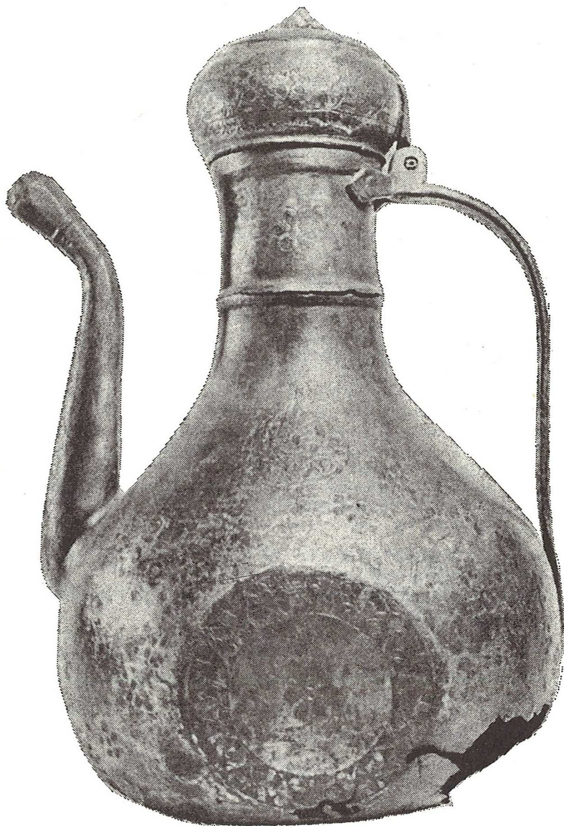
Slika 1. Bakreni posrebreni ibrik, 17. st. visina 26 cm Gradski muzej Virovitica