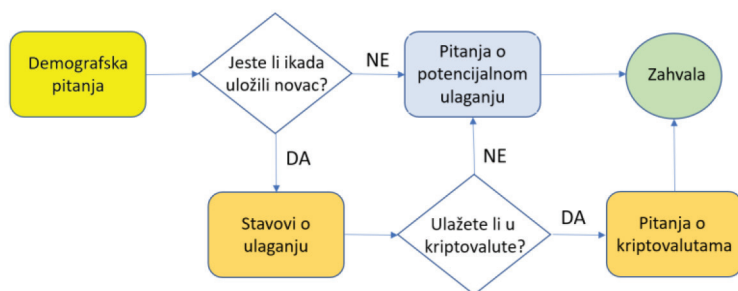
Slika 2 Blok shema ankete

Figure 2 Questionnaire block diagram