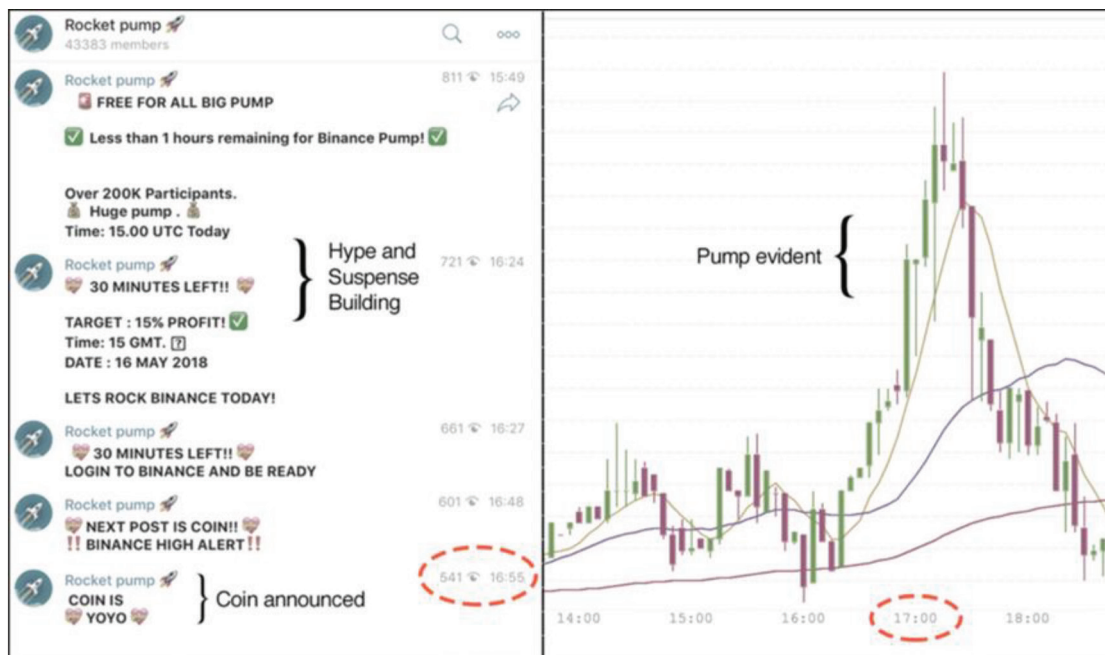
Slika 1 Primjer pump-and-dump sheme [5]