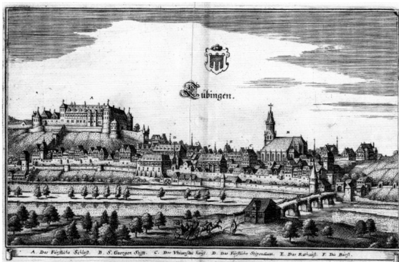
Tübingen (17 st.)

tol., Zemaljski grof od Hessena 200 tol., Izborni vojvoda Saške (Saksonije) 200 tol., Pruski vojvoda Albrecht I. 100 tol. itd. 11