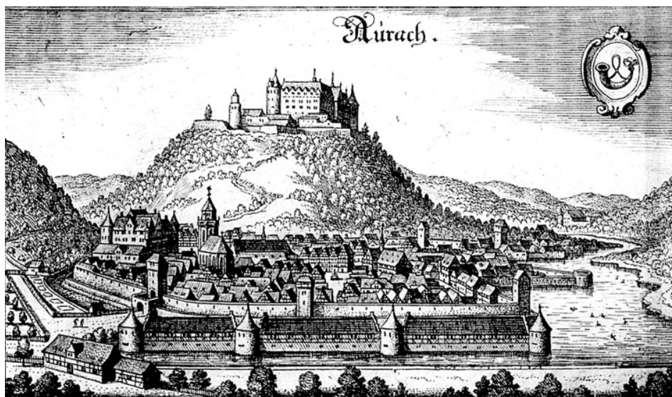
Urach (17 st.)