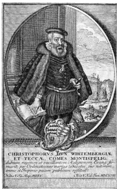
Württembergski vojvoda Kristof (1515. - 1568.)