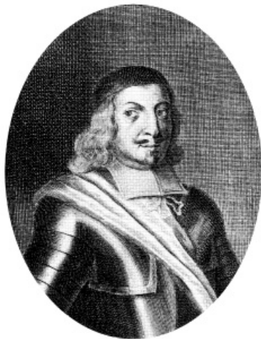
Ivan Ungnad (1493. - 1564.)