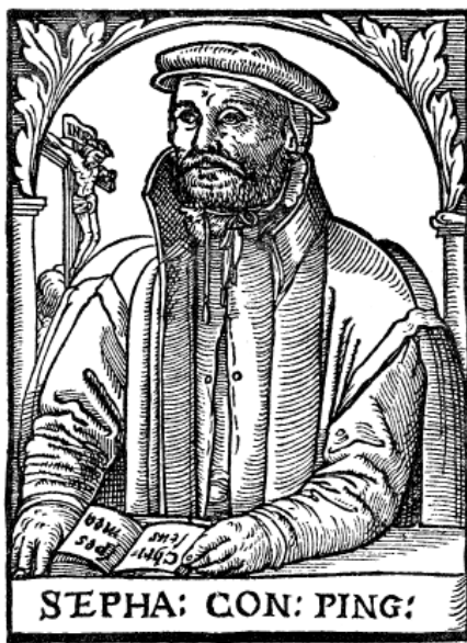
Stipan Konzul (1521. - 1579.)

Potpisani autori spomenutoga predgovora „služabnici i kapelani Anton Dalmatin i Stipan Istrian“ zaključuju da u hrvatskome, do tada, nema knjiga osim brevijara i misala, tj. knjiga za uporabu samo u liturgiji. Stoga su oni, kao prevoditelji, svojim radom htjeli poslužiti narodu i dati mu u ruke Bibliju u njemu razumljivu jeziku. Nakon predgovora slijedi tekst upućen čitatelju K štavcu u kojemu, uz ostalo, navode čemu služe uglate zagrade [ ] i zvjezdica * kod pojedinih riječi u tekstu prijevoda NT.