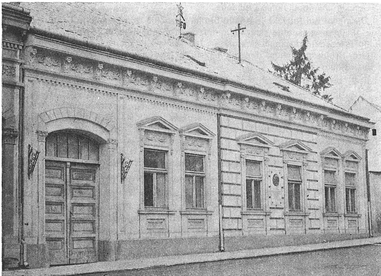
Slika 3. Ružičkina rodna kuća u Vukovaru

Od 1912. godine radi u Švicarskoj, obujam znanstvenog opusa profesora Ružičke je golem. Fotografije Ružičke u laboratoriju, Savezne visoke tehničke škole u Zürichu, gdje je postigao najveće uspjehe, lista od 600 objavljenih radova, s kratkim prikazom u čemu su Ružičkini glavni znanstveni prilozi. Tri su glavna područja znanstvenog rada Lavoslava Ružičke: veliki prstenovi, viši terpeni ili politerpeni i spolni hormoni. Ružička je prvi otkrio da postoje veliki prstenovi za koje se mislilo da su nemogući. Ustanovio je da se muskon i civeton, prirodni mirisi, sastoje od po jednog prstena sa 15, odnosno 17 ugljikovih atoma. Studirao je