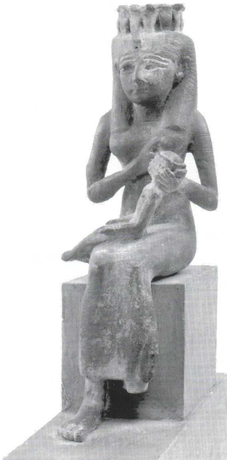
Slika 8. - Izida-Hator s Harpokratom, bronca (476) Figure 8. – Isis-Hathor with Harpokrates, bronze (486)