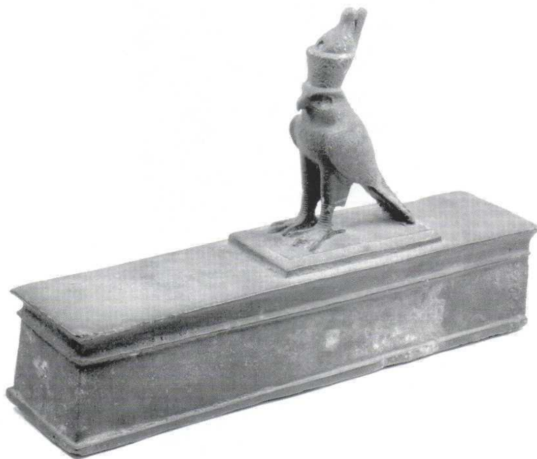
Slika 6. - kipić Horusa s postoljem, bronca (569) Figure 6. - statuette of Horus on basis, bronze (569)