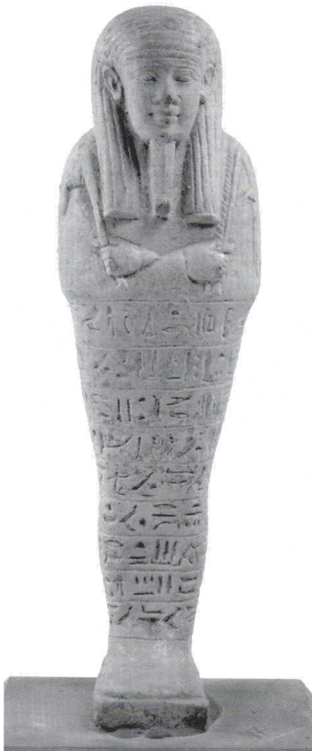
Slika 15. - ušabti Merit-Neit, fajansa (473) Figure 15. – shabti of Merit-Neit, fayence (473)