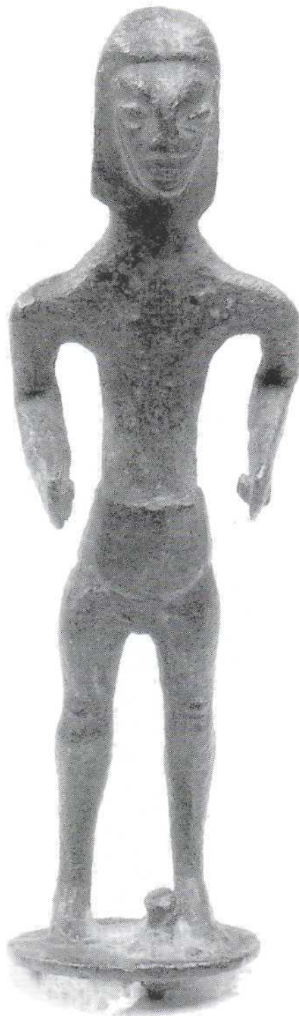
Slika 5. - kipić muškarca (Etrurija ?), bronca (3809) Figure 5. - male statuette (Etruria?), bronze (3809)