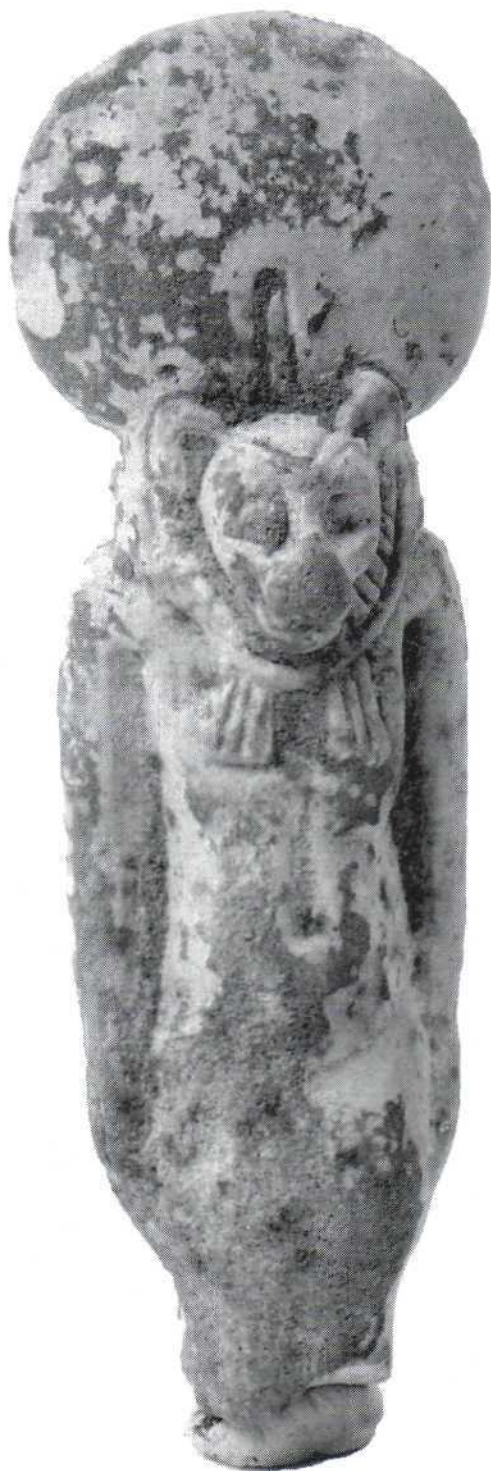
Slika 17. - kipić božice Sekhmet, kamen (509) Figure 17. - statuette of the goddess Sekhmet, Stone (509)