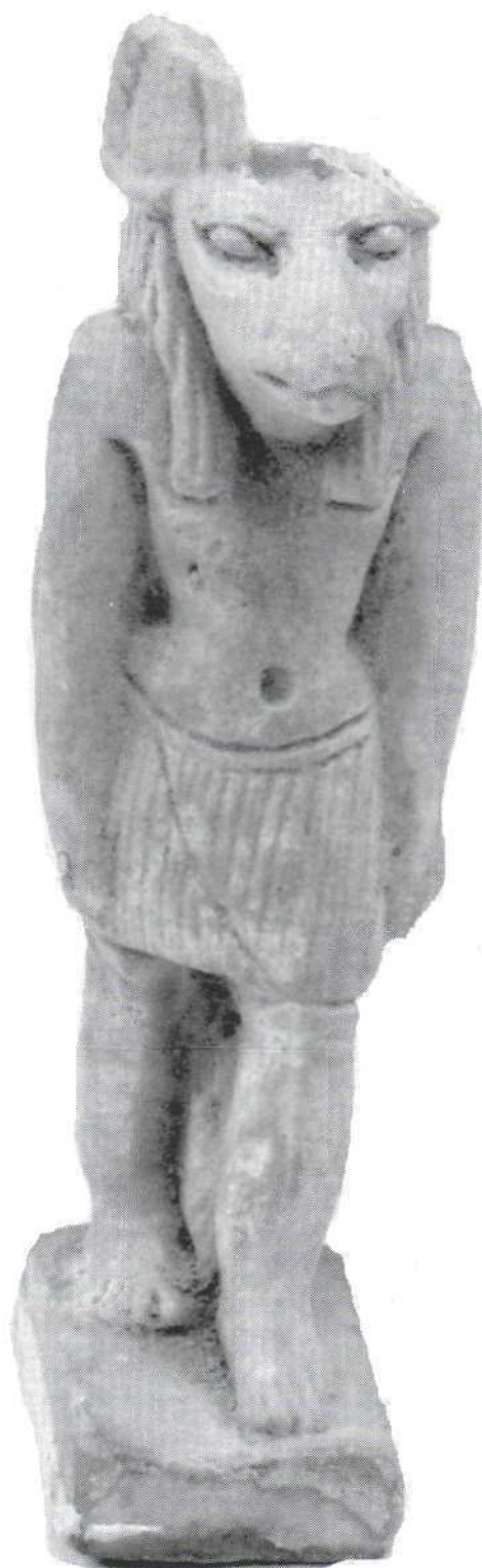
Slika 13. - amulet Anubisa, kamen (641) Figure 13. – Anubis amulet (641)