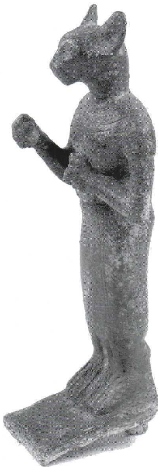
Slika 1. - kipić božice Bastet. bronca (Br. 546) Figure 1. – statuette of the goddess Bastet, bronze (No. 546)