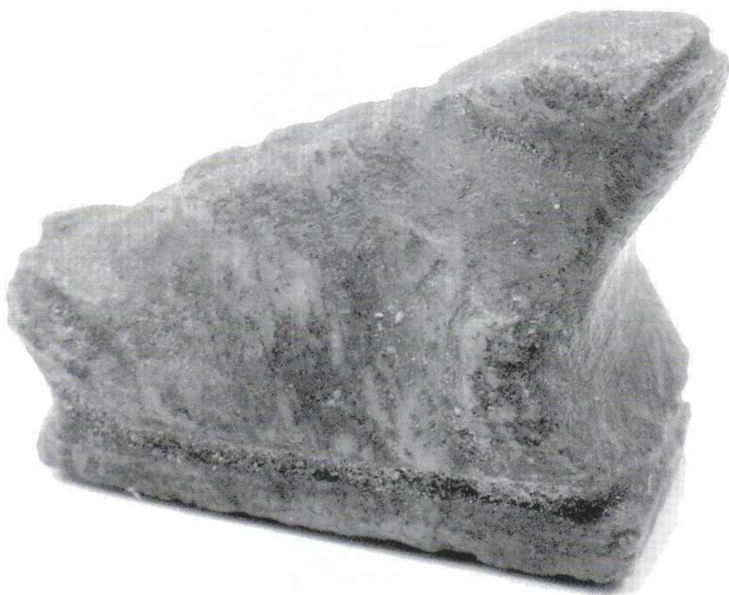
Slika 16. - amulet žabe, kamen (622) Figure 16. - frog amulet, stone (622)