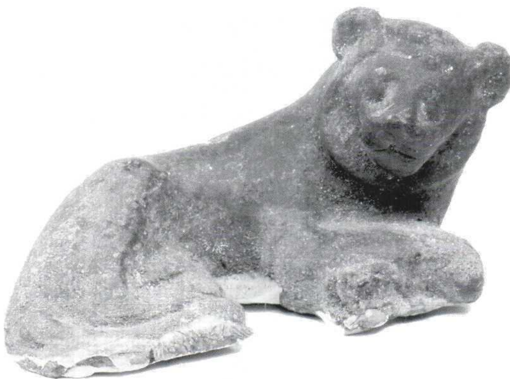
Slika 14. - kipić lava u ležećem položaju, fajansa (458) Figure 14. - statuette of a reclining lion, favence (458)