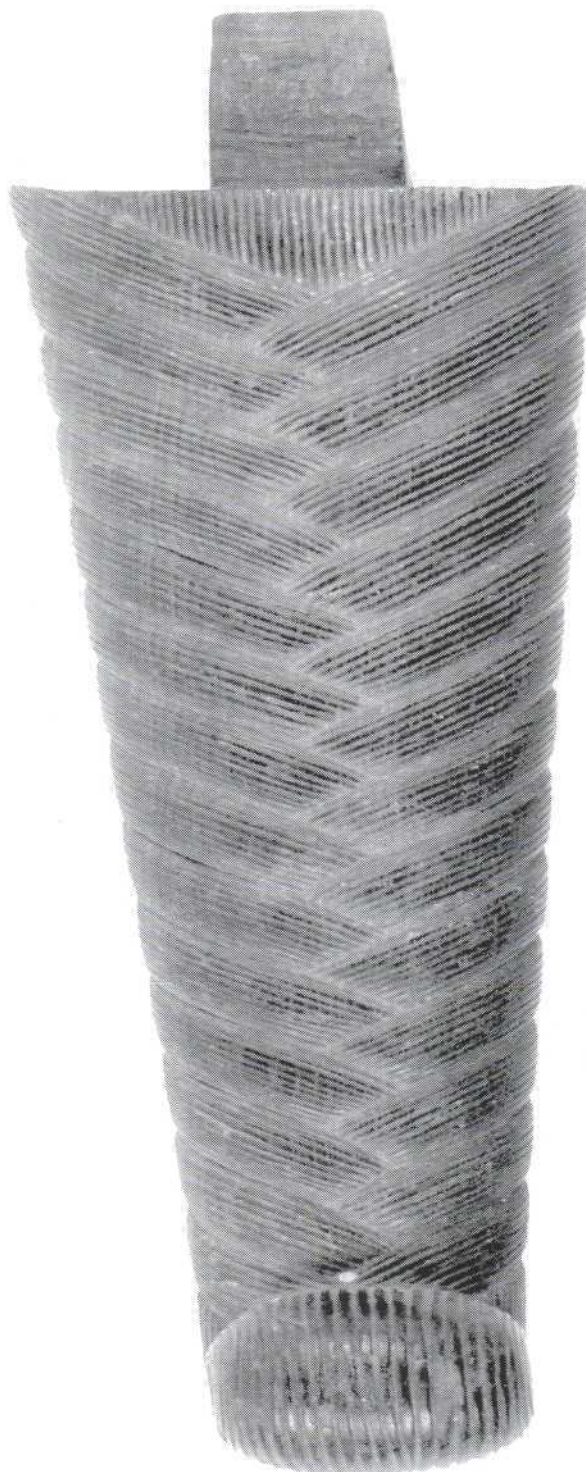
Slika 7. - lažna brada, ebanovina (535) Figure 7. – false beard, ebony (535)