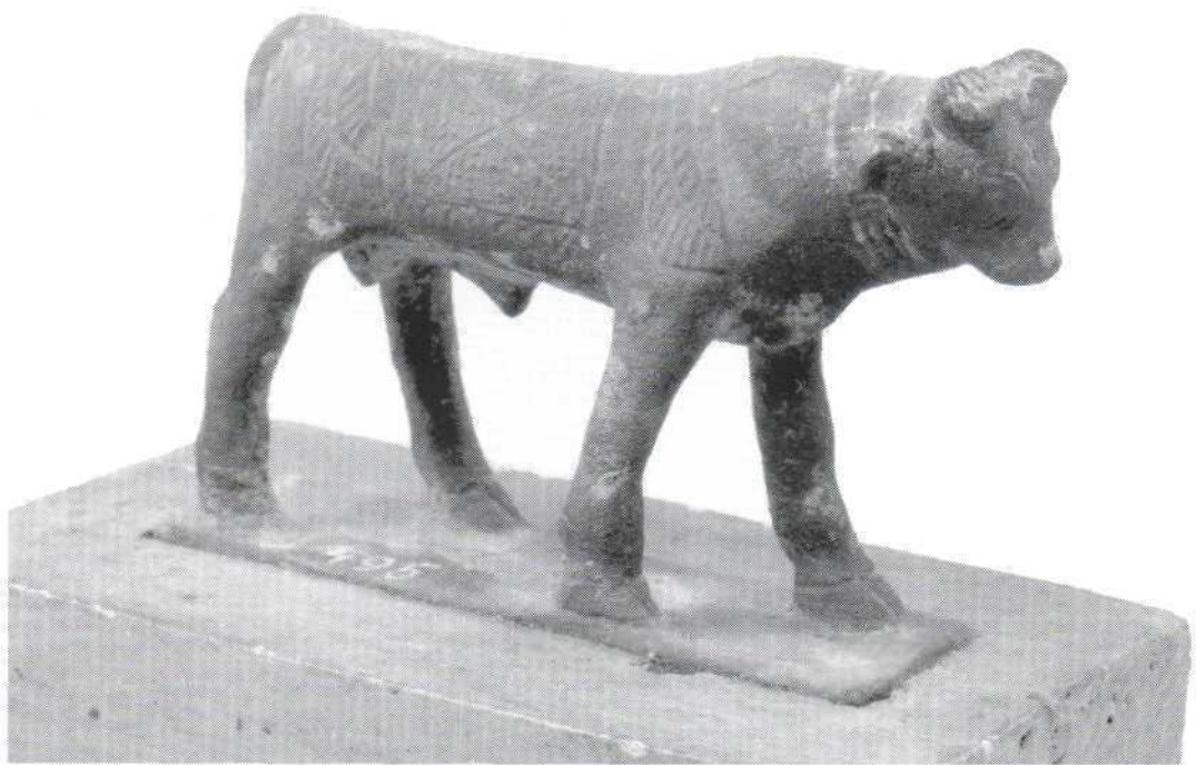
Slika 9. - kipić Apisova bika, bronca (495) Figure 9. - statuette of the Apis buli, bronze (495)