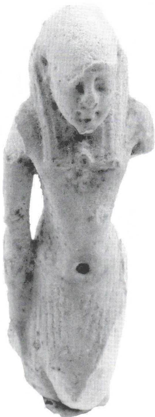
Slika 12. - kipiće muškarca, fajansa (3803) Figure 12. – male statuette, fayence (3803)