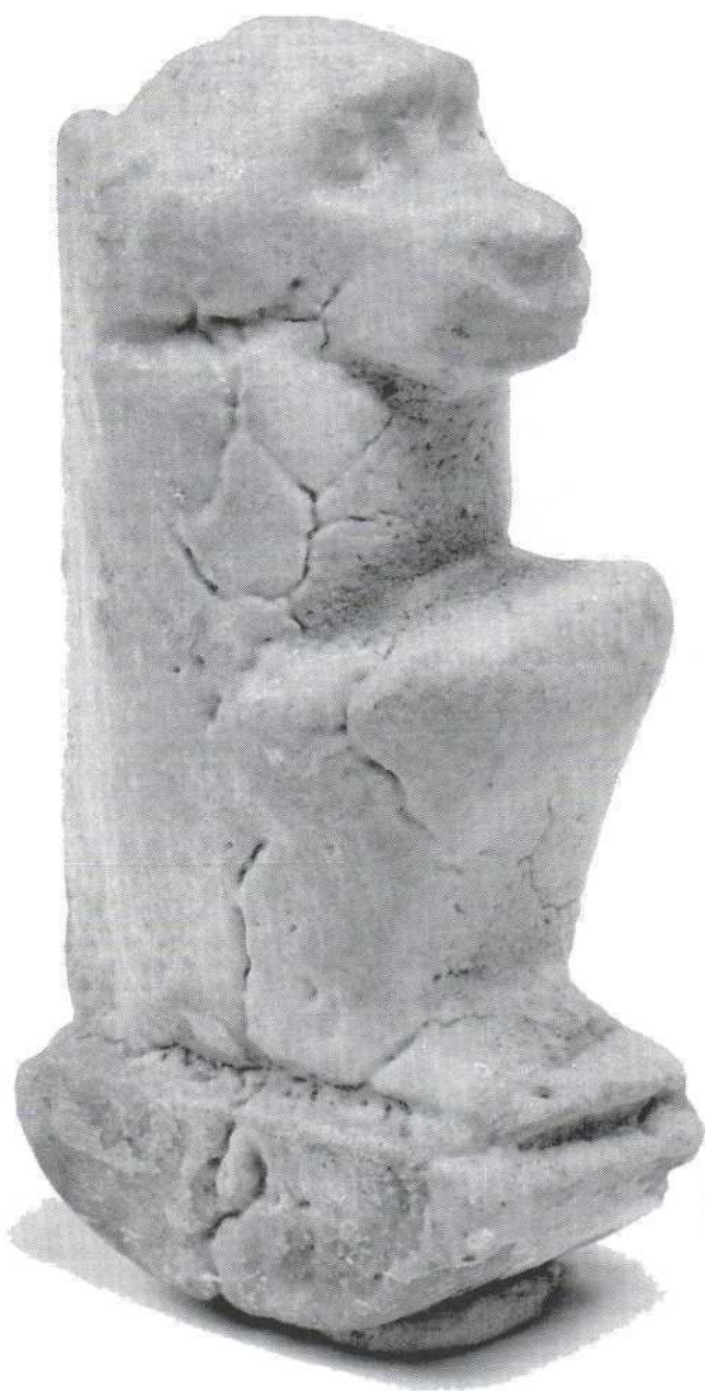
Slika 10. - amulet Tota, fajansa (533) Figure 10. - Thot amulet, fayence (533)