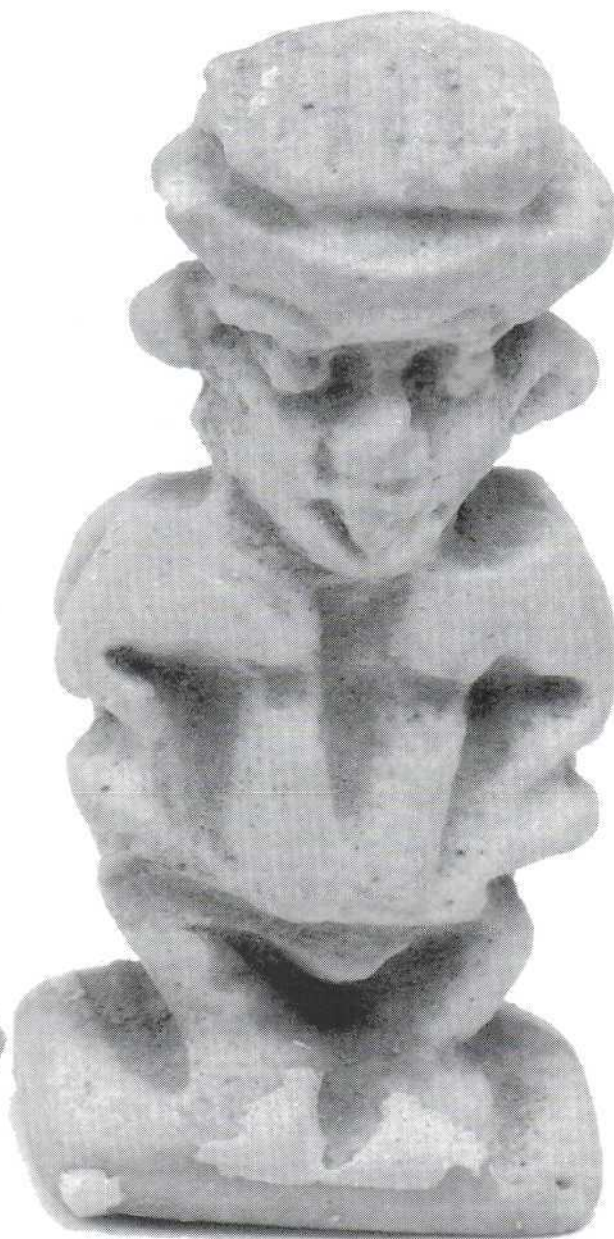
Slika 11. - amulet Patakea, fajansa (532) Figure 11. - Patake amulet, fayence (532)