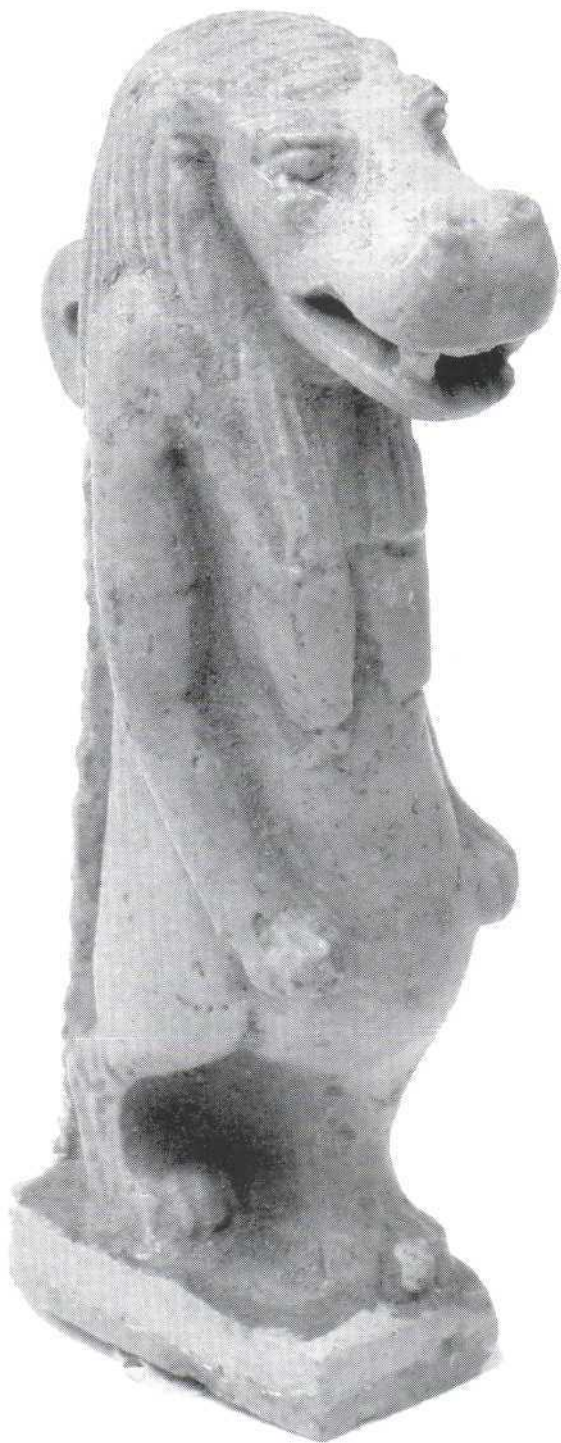
Slika 4. - amulet božice Toeris, emajl (640) Figure 4. - amulet of the goddess Toeris, enamel (640)