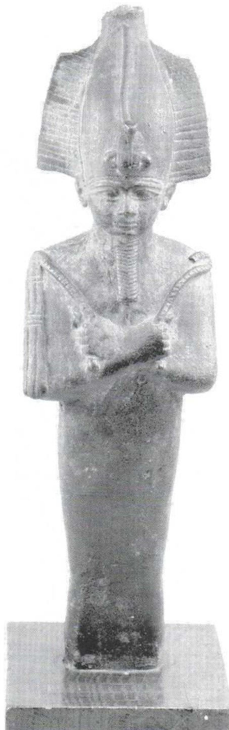
Slika 3. - kipić boga Ozirisa s krunom atef , bronca (479) Figure 3. – statuette of the god Osiris with the atef crown, bronze (479)