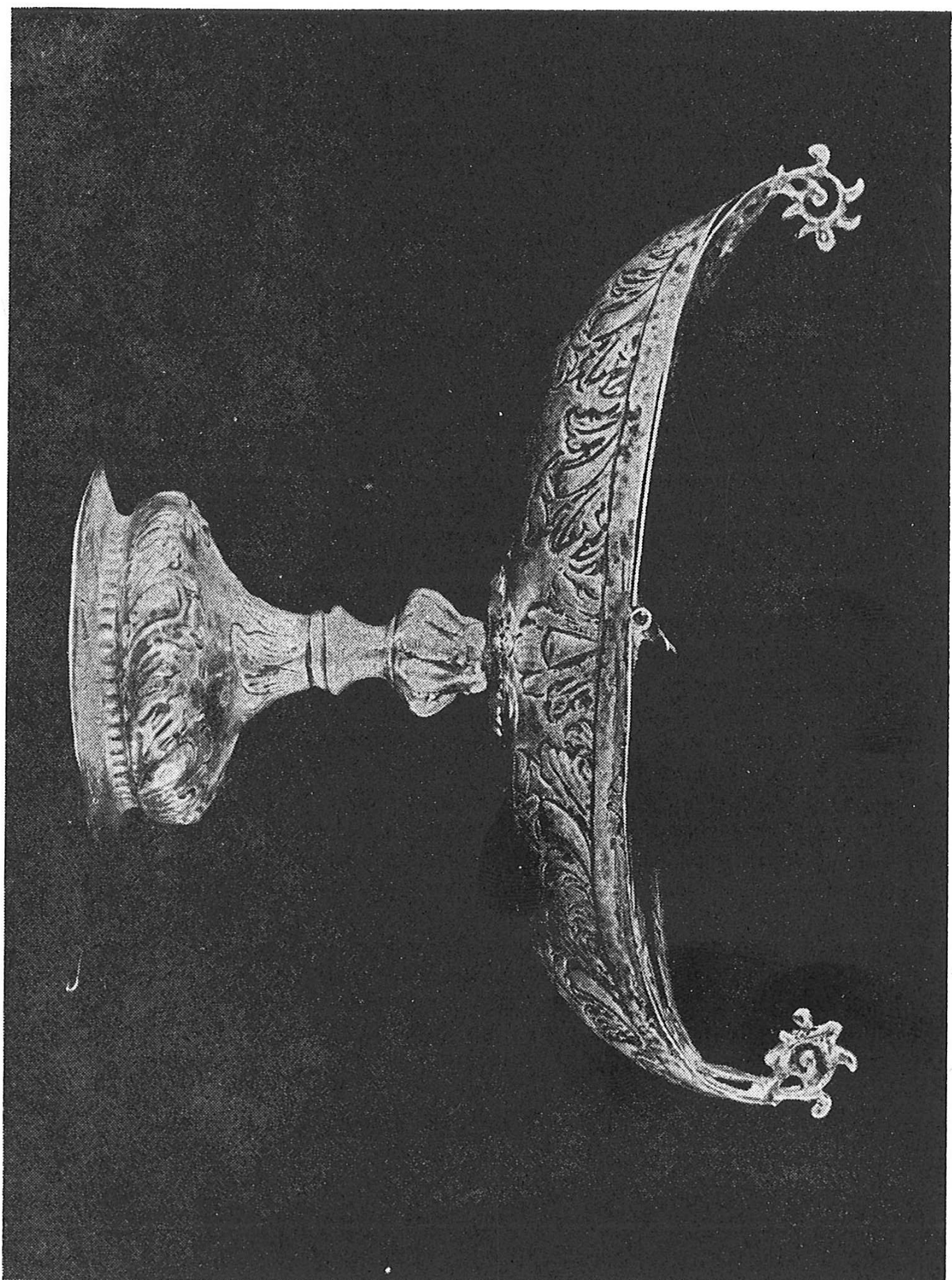
Slika 1. CERNIK, Franjevački samostan — Srebrna ladica za tamjan (venecijanski majstor 18. stoljeća)