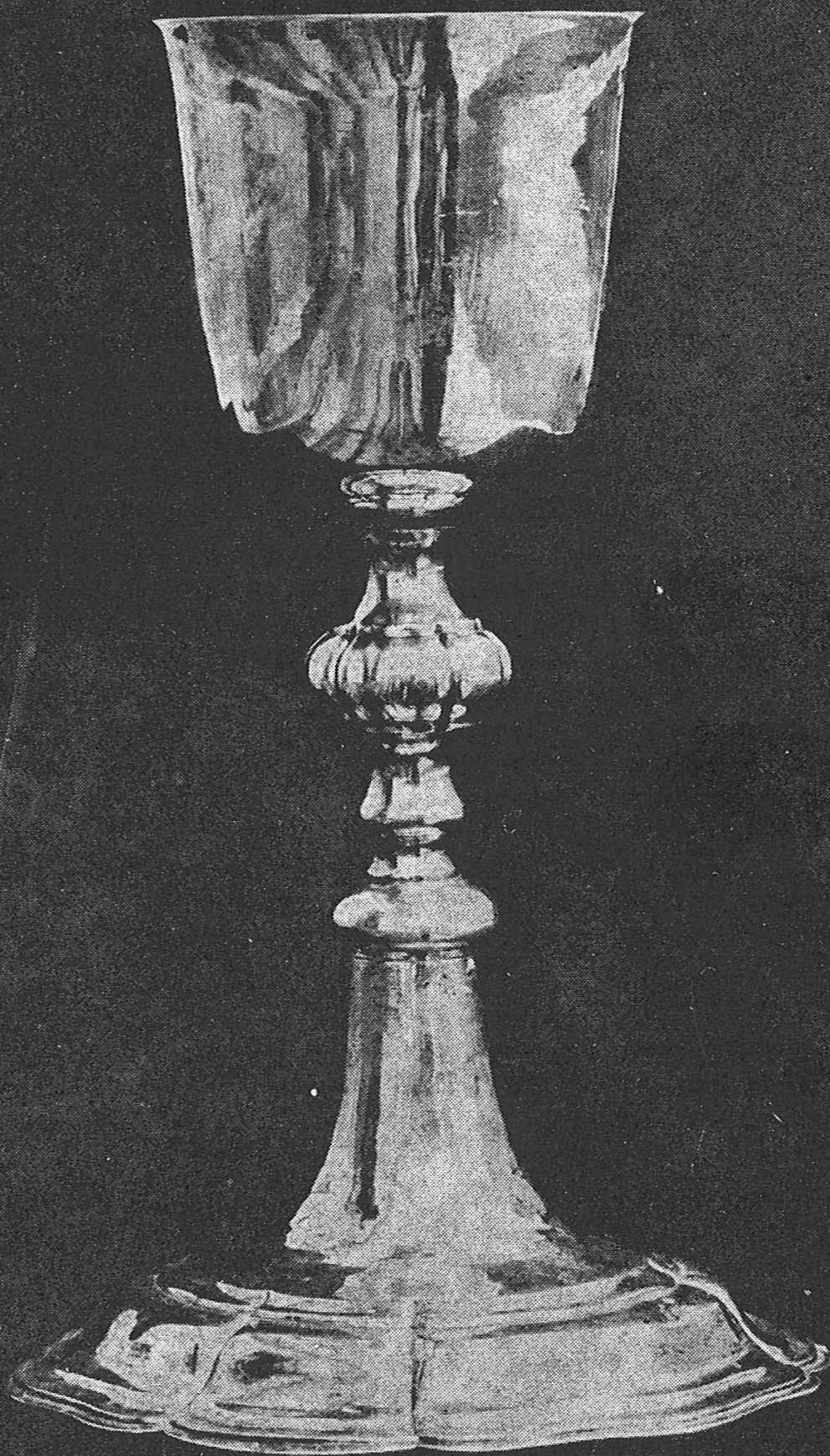
Slika 5. OSIJEK, Franjevački samostan — Srebrni kalež (rad osječkog zlatara Antona Mayra iz 1780)