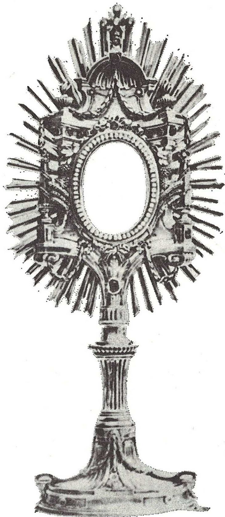
Slika 4. OSIJEK, Franjevački samostan — Srebrna pokaznica (rad bečkog zlatarskog majstora Josepha Mosera iz 1776)