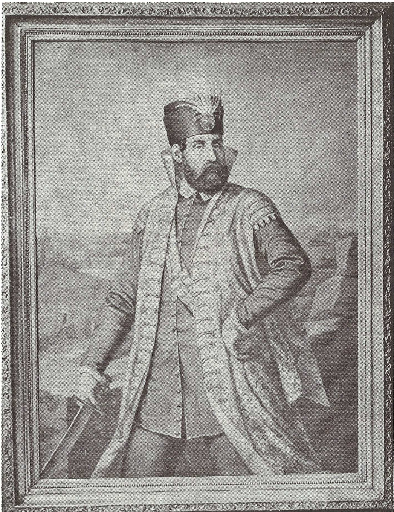
Slika 1. J. F. Mücke: Nikola Šubić Zrinski, 1866.