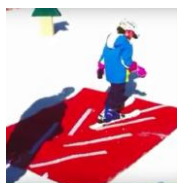
Slika 3: Didaktički tepih