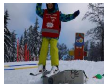
Slika 4: Skijaška skakaonica