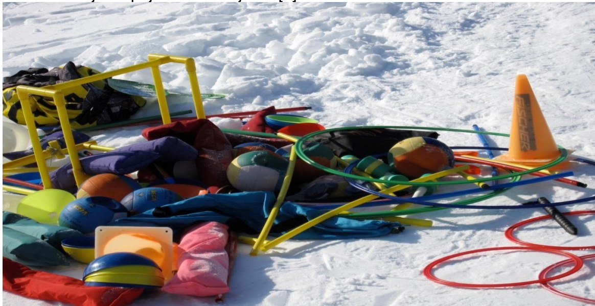
Slika 1: Asortiman didaktičkih predmeta

Posljednjih godina primjena nastavnih pomagala, prije svega u učenju znanja kretanja djece, postala je skoro konstanta. Njihovom sistematičnom primjenom brzo se širi krug temeljnih znanja kretanja, do kojih djeca dolaze igrom skoro nesvjesno. Zato mogu da se poistovjete sa sportom, odnosno kretanjem u njima emotivno i socijalno prijatnom ambijentu [4].